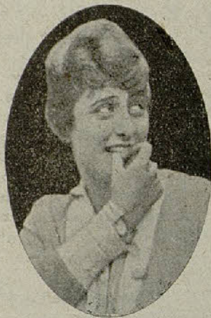
GRACE CUNARD (LUCILLE)

Días después veíase la causa contra Gerardo por asesinato de su padre. Josefina llegó junto al procesado y, sin ser vista de nadie, introdujo en su mano un papel avisándole de que se fugara al oír un disparo; minutos más tarde hacía Pluma Bermeja con el