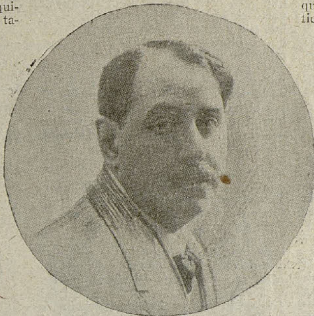
Eduardo Marquina, egregio poeta a quien Barcelona ha rendido un grandioso homenaje de admiración

Alma pura y en llaga viva de sentimiento luchando con el materialismo de los tiempos modernos. Y las dificultades fueron vencidas y los abrojos del camino segados. Y quedó como un inconcebible sendero llano y amplio, rutilante de luz, por el que la emoción podía marchar, quintaesenciada y pura, hasta el corazón—olvidados por obra y gracia del poeta del ambiente cotidiano—de los espectadores.