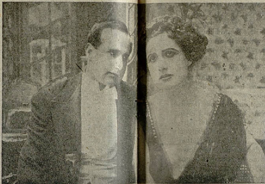
GUSTAVO SERENA y FRANCESCA BERTINI

«Cuando estalló la guerra me encontraba en la India y me costó no poco