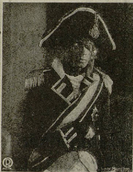
Conrad Veidt en el papel de Lord Nelson

Las tribus salvajes. — Evalina conoce que su marido vive aún, que el «Chacal» la había anunciado su muerte y encuentra a Eva, y con Raul van en busca de Teodoro, que es encontrado por Eva cuando los cómplices del «Chacal» ya han aprisionado a Raul y Evalina. Ya conforme el «Chacal» con su nieta decide internarla en una gran pensión educativa en Nueva York, de