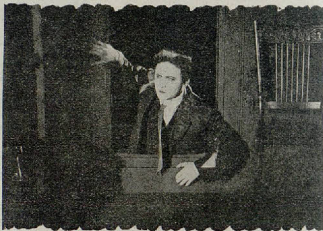
Una escena de la película «Houdini y el tanque humano»

Verdaguer. —Se pasó la extraordinaria «Estirpe» hermoso drama de 1.600 metros, marca Milano films, las del programa americano «Calavera y sacamuelas» graciosa comedia de la L. Ko y la superproducción «El silencio culpable» grandioso drama de 1.650 metros en el que