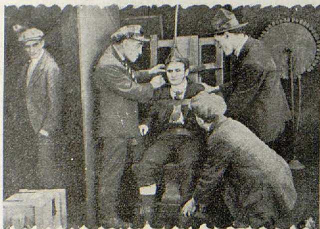
Una escena de la película «Houdini y el tanque humano»