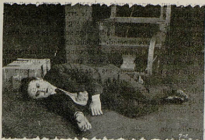
Una escena de la película «Houdini y el tanque humano»