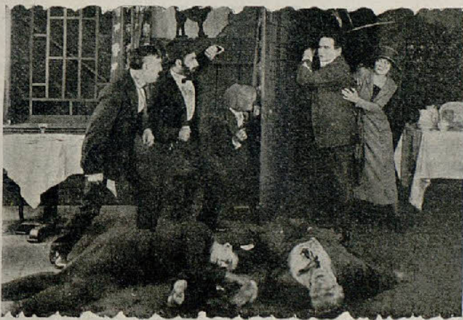
Una escena de la película «Houdini y el tanque humano»

Con no poca sorpresa hallan a Olga los esbirros sin conocimiento y ven la hendidura por donde el terrible yankee ha logrado evadirse. Sin perder tiempo, coje en sus brazos su inanimado cuerpo y le trasladan a uno de los almacenes, donde en una caja de embalaje introducen su cuerpo y le conducen a otro lugar para despistar al terrible americano.