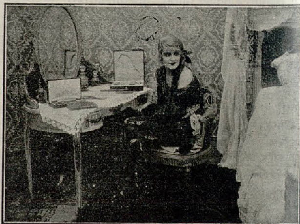
Una escena de la película «Una hija de Eva... moderna»

Casanovas y Piñol. —Con el conocido Conde Hugo, como protagonista, al que secundan Mae Gaston y Rosemary Theby, nos presentó esta casa una interesante serie, en quince episodios, la que titu-