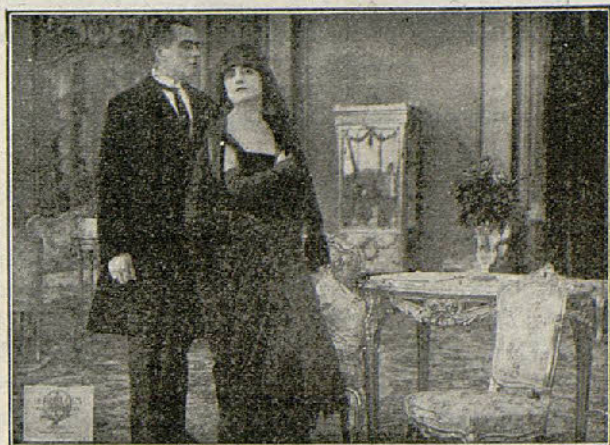
Una escena de la película «Lujuria»

Extrañado de la contestación y viendo en ella algo de luz que pudiera descubrir el crimen, se decide a visitar a Hugo para