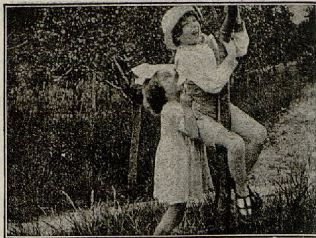
Una escena de la película «El escándalo»

al oír las terribles palabras del detective y se ofrece para poder detener a los culpables del crimen.