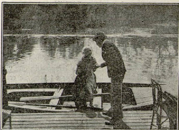
Una escena de la película «Una hija de Eva... moderna»

Se asegura que las populares artistas Soava y Carmira Gallone han sido contratadas por una importante manufactura americana donde producirán una serie de grandes films, con la obligación de impre-