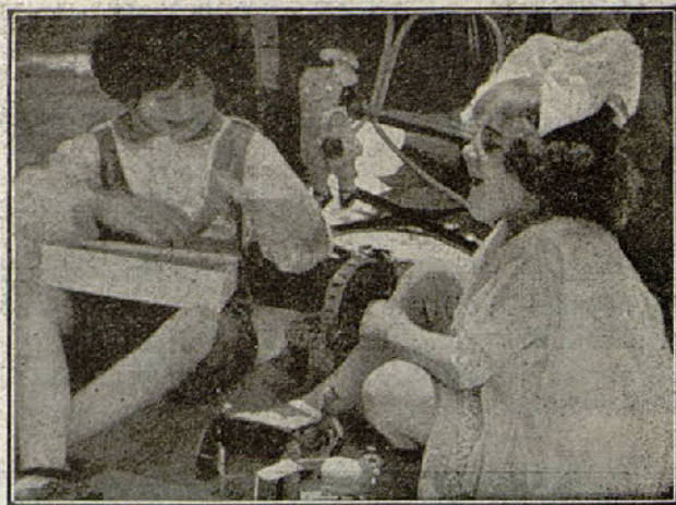
Una escena de la película «El escándalo»