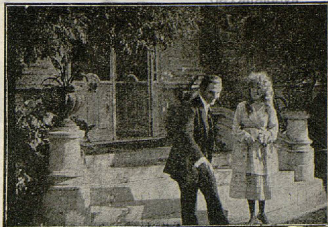
Una escena de la película «La novela de una madre»

Al volver me relató el encuentro con Ernesto y me explicó la impresión que le hizo la muerte.»