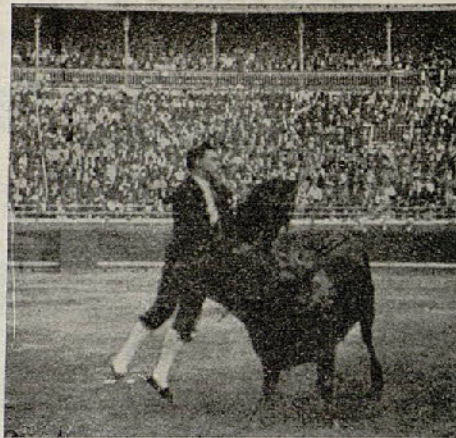
Cogida de Varelito por el tercer parlade

Vamos con los miuras. Grandes también. Aunque dieron menos peso que los parlades