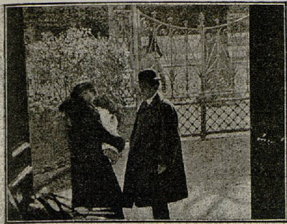
Una escena de la película «La novela de una madre»