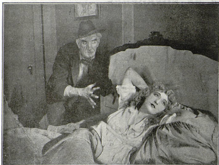
Una escena de la interesante película "El misterio de la Doble Cruz"