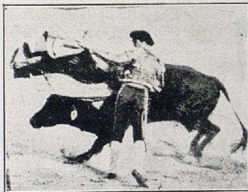
LIMEÑO, el domingo en Madrid.

Belmonte. —De azul eléctrico y oro.—Aunque el 2.º toro salió abanto y se iba del capote, Belmonte dibujó varias verónicas. Llegó el toro al último tercio quedadísimo, amansado. Pero gracias al temple maravilloso del torero, a ese mando suyo característico, el toro pasó unas ocho veces seguidas, ligado un pase con otro: parecía un solo pase. Se arrodilló después de espaldas al bicho y luego dió un molinete entre los dos pitones. Y cuadrado el parladé, entra Belmonte a herr, despacio, suavemente, se queda el toro, lo hace él todo y mete el estoque en la