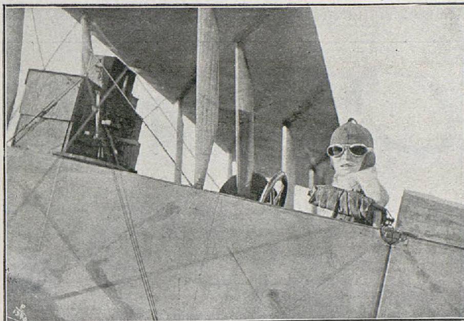
Una escena de la interesante película «La heroína de New-York»

Hubert Brewster se marcha y confía a su esposa a una criada de confianza. Al día siguiente Mrs Brewster da a luz dos gemelas