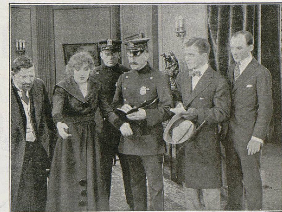
Una escena de la interesante película "El misterio de la Doble Cruz"

Bridgey Bentley, individuo de dudosa moralidad que ocupa una habitación contigua, en el hotel donde se hospeda Patrick en New York, le suministra por casualidad un precioso indicio. Escuchando a través del tabique. Patrick conoce que el aventurero proyecta obtener por una miseria inmensos terrenos petrolíferos cuyo valor no sospecha su propietario, Hubert Brewster. Patrick se promete desbaratar sus planes yendo antes a casa de Brewster. Júzguese pues de su extrañeza al reconocer en la hija de Brewster a la desconocida del camarote. La joven niega haberle visto antes, pero desde este momento su conducta es inexplicable, ya que unas veces acepta