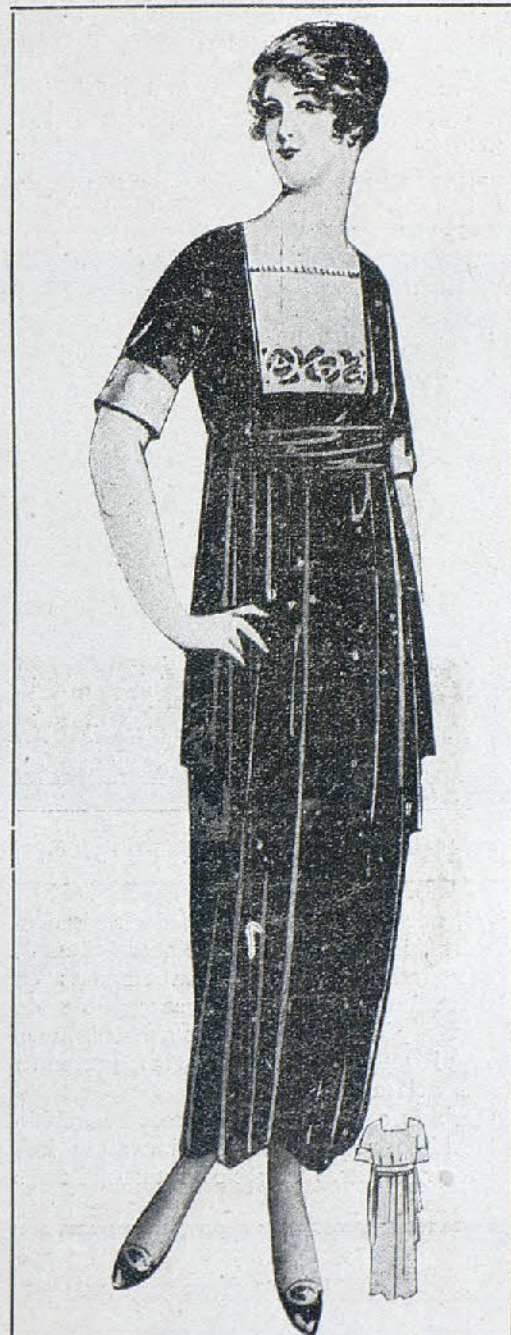
ELEGANTE TOILETTE de terciopelo negro. La falda es recta; lleva faja de lo mismo que cuelga en doble por ambos lados. Cuerpo liso muy abierto sobre bajo blanco, bordado en azul vivo, como la faja.