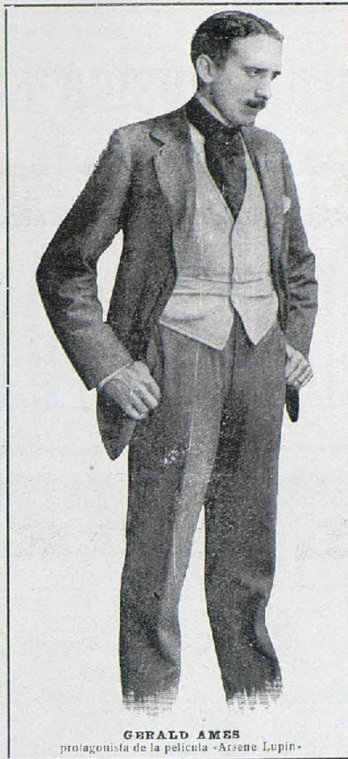
GERALD AMES protagonista de la película «Arsene Lupin»