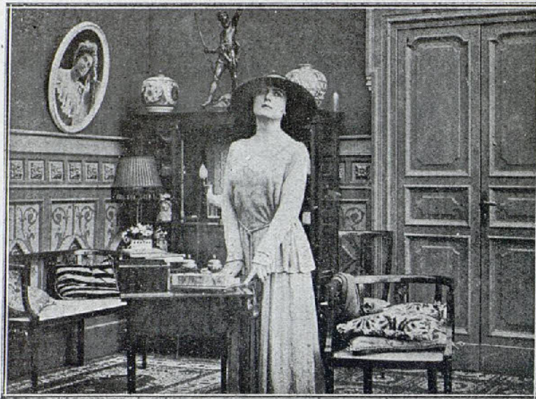
Una escena de la película «Los siete pecados capitales», Soberbia

plaza, nos ruega la inserción de la siguiente carta, lo que con sumo placer hacemos.