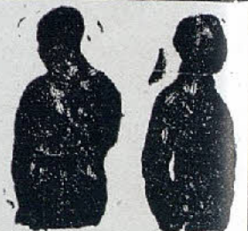
Sin Benefactor Con Benefactor

Para el desarrollo de pechos de las señoras, caballeros y niños :-: Indispensable a toda persona que aprecie y practique la higiene en el vestir :-: Con el uso del Tirante-Benefactor , las señoras conseguirán el desarrollo de sus senos pudiendo prescindir así de medicinas y ungüentos perjudiciales muchas veces a la salud De venta en casa los Sres. Eduardo Schilling, S. en C. (Barcelona-Madrid-Valencia) y al fabricante de Ligas y Tirantes "Smart" AMADOR ALSINA Lladó, 7, pral - BARCELONA - Teléf. A-4851, que mandará folleto gratis a quien lo pida