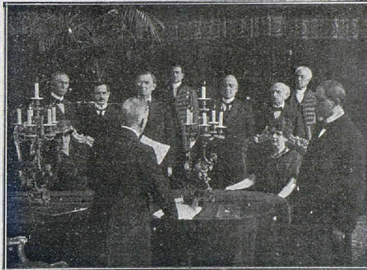
Una escena de la película "Los siete pecados capitales", Soberbia .

que Miles Gaston y Armando les seguían los pasos, sacaron a Betty del automóvil y la embarcaron en una locomotora sin freno, creyendo que de esta manera el «Hombre Misterioso» acudiría en su auxilio, como era su costumbre cuando Betty se hallaba en un grave peligro. Más Gaston y Fay observaron la maniobra de los espías y, acercándose a la locomotora, que corría a toda velocidad, le arrojaron una