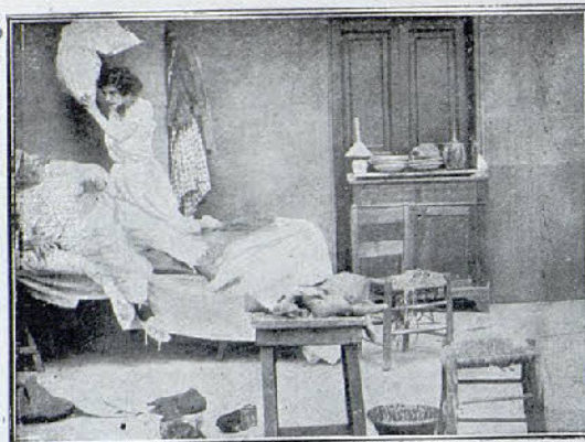
Una escena de la película «Crispín y la comadre»

Errando por las calles de París, Manglas se hace atropellar por un automóvil, cuya