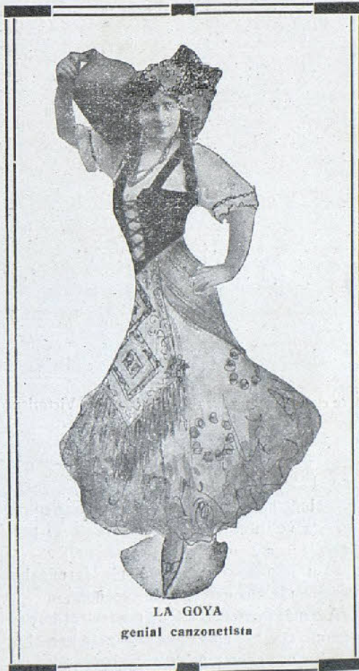
LA GOYA genial canzonetista