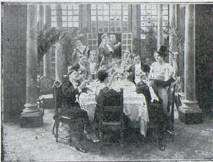
Una interesante escena de la película «Ella no traicionó»

«Creo honrado a Teodosio y sólo pido que el imperio romano de Oriente eleve a 1 000 las 700 libras de oro del tributo establecido.