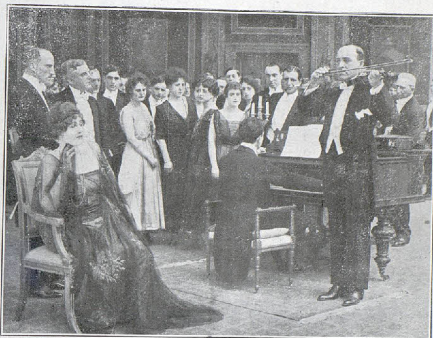
Una escena de la interesante película «La mujer abandonada»

El detective Ackerton ha sido asesinado,