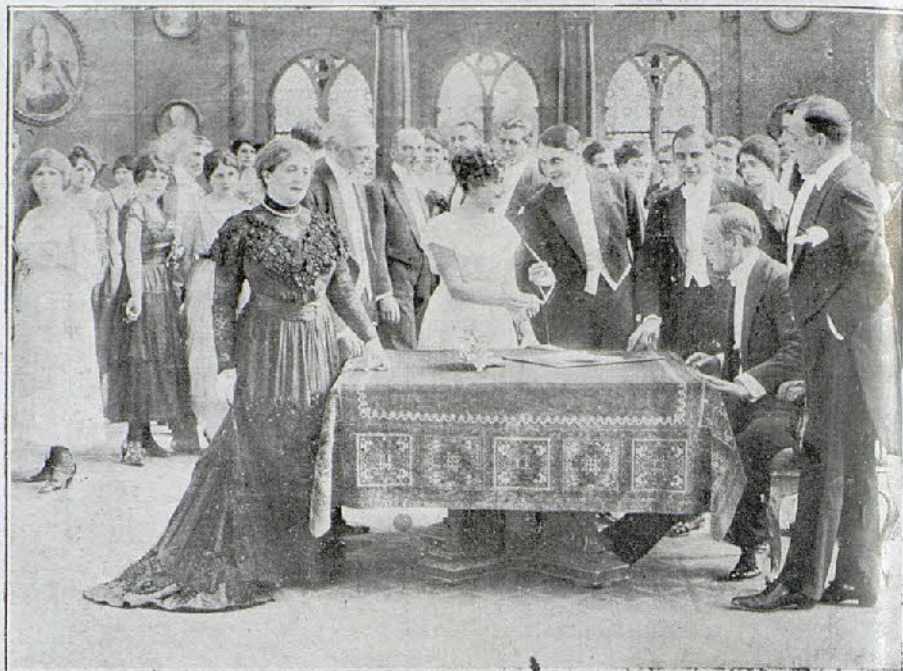
Una escena de la interesante película «200 por hora».

De todas maneras, en esta ocasión se encuentra justificado el favor con que el público ha acogido esta cinta, pues aparte del lujo de su presentación, es una de las películas en la