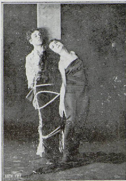
Una interesante escena de la película «Liliana»

El interés que despierta esta serie es tan enorme que los públicos de Italia, Francia y demás naciones en que se ha proyectado, han llegado a apostar mutuamente respetables