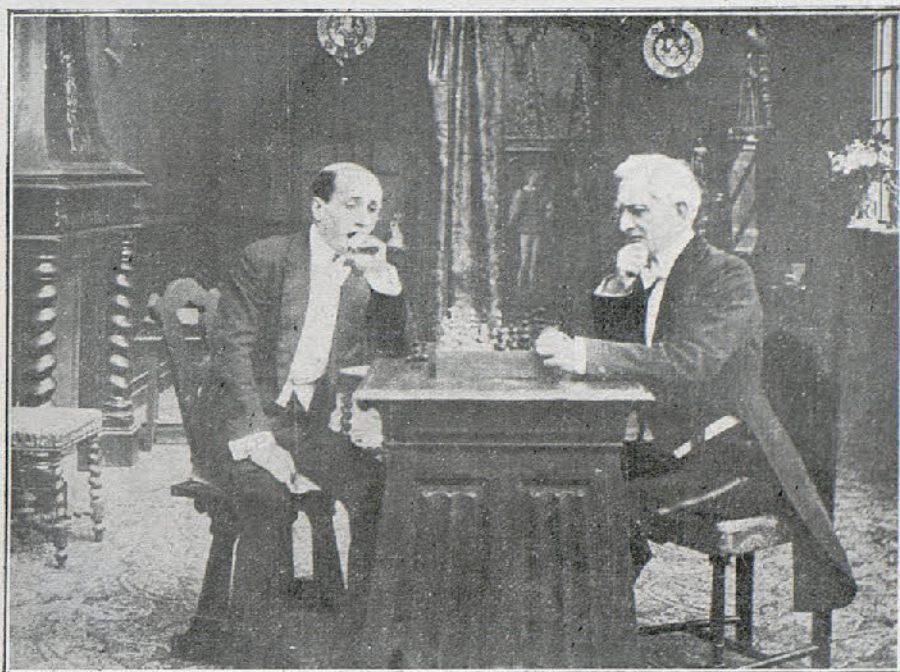
Una escena de la película «Maternidad».

Cuando llegó Jack Johnson al lujoso despacho del conde Brunzi, hallóle en compañía de su sobrino, vizconde de Kergéz; un hombre que, habiendo derrochado su patrimonio en una vida de libertinaje y disipación, aguardaba ansioso la muerte de su tío para heredarle. Jack rehusa, con noble desinterés, la importante suma que el conde Brunzi le ofre-