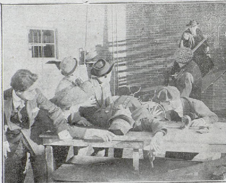
Una escena de la película «El teléfono de la muerte».