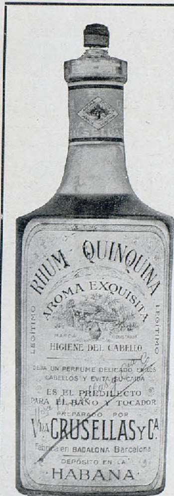
Exijase la firma azul

Kursaal. —A las secciones de patines y bailes, alternando con preciosas películas, concurre a diario lo más distinguido de nuestra buena sociedad. —ROSELLÓ.