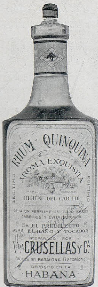
Exijase la firma azul

Teatro Conservatorio. —Terminó con éxito la cinta de episodios «El Gran Secreto».—UNO.