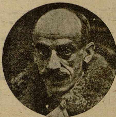
El insigne literato Gregorio Martínez Sierra, cuya voz profunda y clamorosa ha conmovido a España, originando suscripciones, que crecen por momentos, en favor de la Rusia desamparada y hambrienta.

Ha sido preciso que el arte anime con palabras bellas, sinceras y claras la piedad manante del corazón nobilísimo de un poeta, para que nos sintamos sacudidos, inquietos, penetrados de la realidad