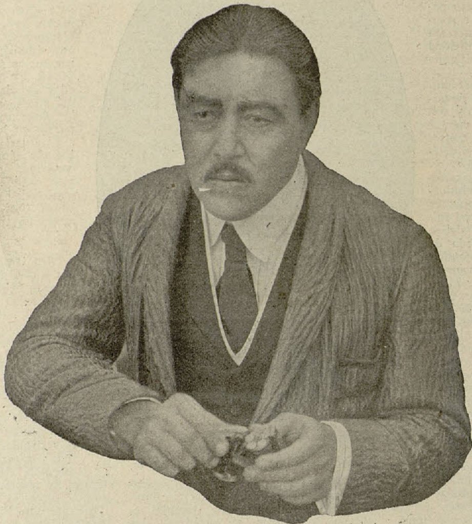
Warner Oland en «Los ojos del mal»

Polo en «El atleta invencible» continúa entusiasmando a sus múltiples admiradores con sus heroicidades, en las pantallas del Cine Ideal, Cinema X, Proyecciones y Cine Hispano-Francés. En el coliseo citado primeramente se proyectaron además bellas cintas como «Déjalo para mí» y «El caballero batallador» ambas interpretadas por