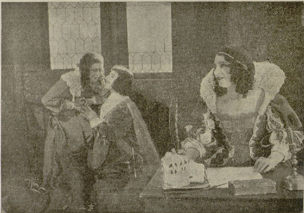
«Los Tres Mosqueteros»

En cuanto llegó a la aldea se dirigió al mercado, pero su madre no reconoció en él al hijo que había perdido ha-