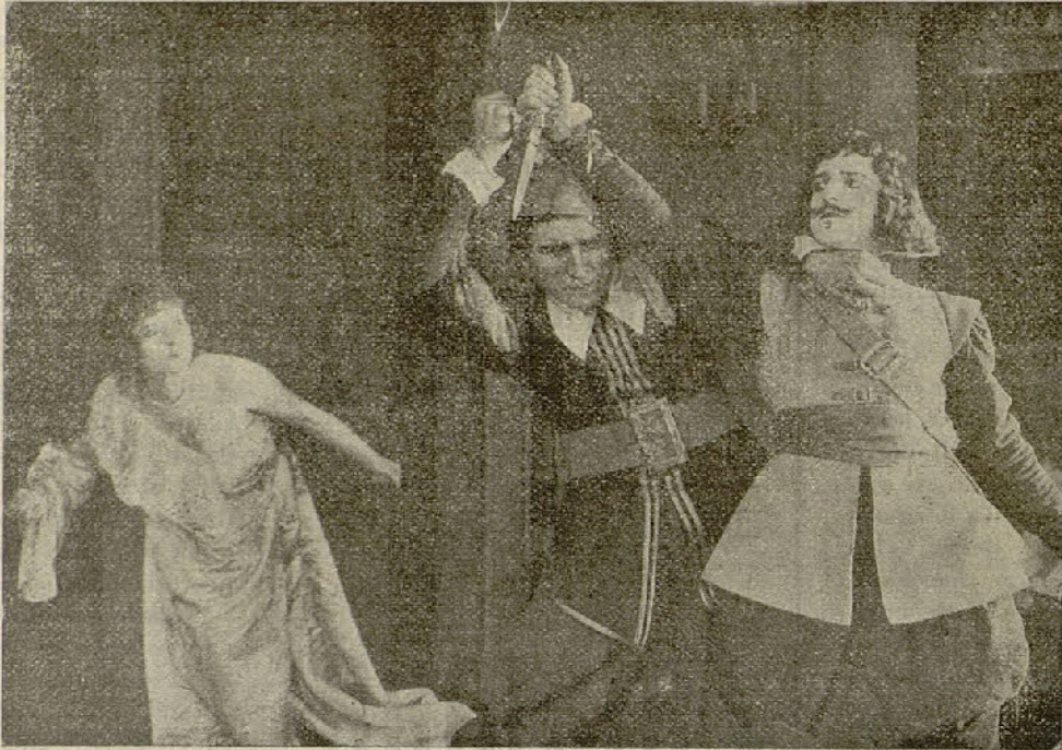
«Los Tres Mosqueteros»

En el hospital Elena encuentra al buen viejo Winters quien el mismo día fué conducido al benéfico establecimiento por el misterioso personaje de la motocicleta. Durante su permanencia en el hospital el viejo payaso del circo hace sensacionales revelaciones a Elena acerca del nebuloso pasado de Eddie Polo, contando sucintamente a la joven los sucesos ocurridos en el circo la noche trágica de la muerte del padre de Polo, víctima de una bala homicida disparada a mansalva por el