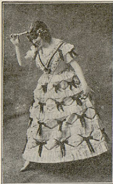
La Goya en «Juan Antón»

partitura de Phi-Phi estaba formada por retazos de otras partituras, cuando precisamente era todo lo contrario.