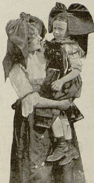
«Mi última aventura»

No tardó mucho tiempo el desconocido en aprisionar a la fugitiva. El desconocido no era otro que Ricardo. Cuando