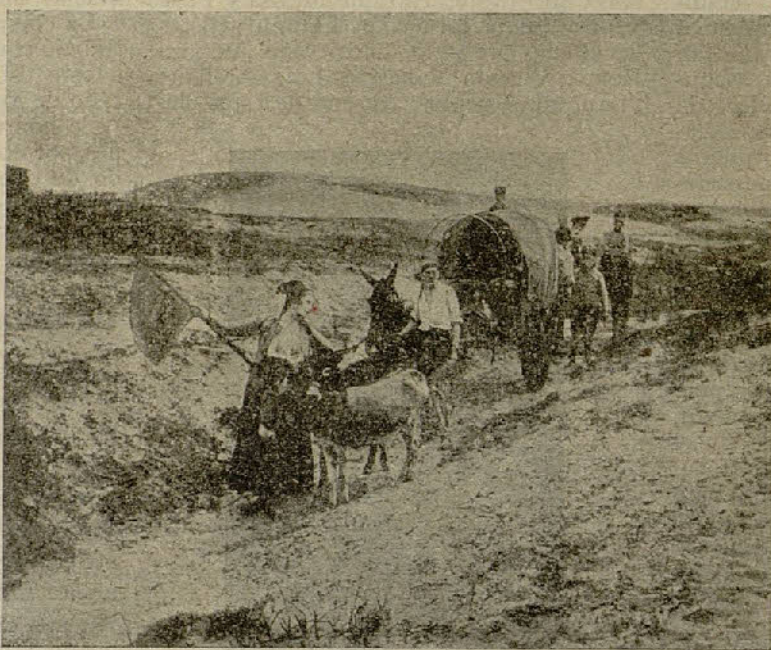
«El Alcalde de Zalamea»

Louise Lovely, artista que debutó en los producciones Universal y que per-