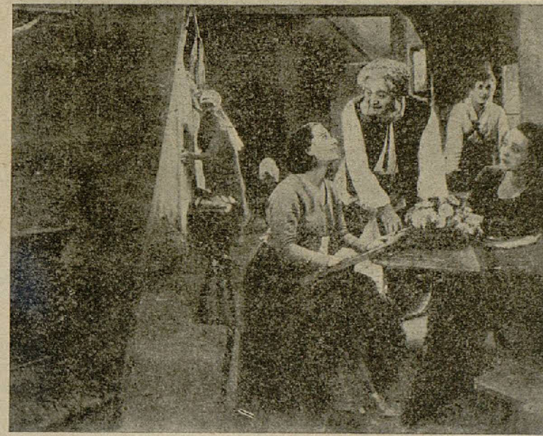
«El Alcalde de Zalamea»

Como observará el inteligente lector, la mayoría de las cualidades que acabamos de enumerar corresponden a la vida privada o íntima del actor o actriz. El lector curioso que pasee la vista por estas líneas, tal vez tendrá otros motivos, muy respetables por cierto, para querer a esas estrellas y a otras de la Paramount, que no mencionamos, motivos basados, no en sus