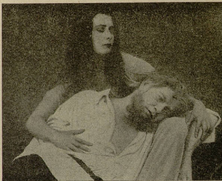
«El Alcalde de Zalamea»

Pero El Torbellino se hallaba por allí cerca, montando su motocicleta, y logra salvarla, arrebatándola de la silla. Una inmensa gratitud invade el alma de Elena; pero su compromiso con Carley le impulsa a no dejarse llevar