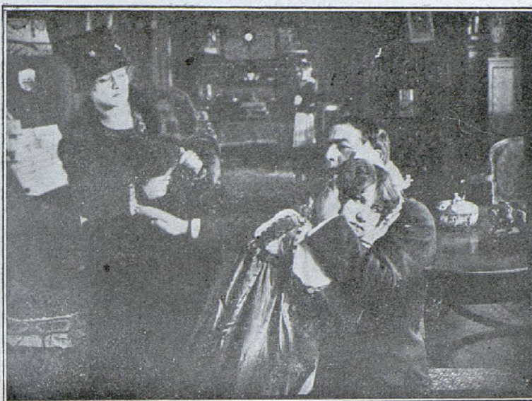
Una escena de la película «Nocturno de muñeca»

Aquella tarde Cleo y Hook el contramestre también pasean por el mismo lugar. Mientras el acompañante de Cleo se detiene a comprar un periódico la joven, en virtud de un proyecto meditado, es raptada por los conspiradores que la llevan a la cabaña de Ricardo Patten, individuo de la banda de Olga. Allí la intimidan para que descubra el secreto, que en realidad no puede revelar, porque en absoluto lo desconoce. Para que adquiera mayores seguridades el secuestro de Cleo, Morton la conduce a una vivienda abandonada en lo alto de la montaña valiéndose del aeroplano de Smith, de cuyo aparato se apodera sobornando al criado del aviador. Inútiles son los esfuerzos sobrehumanos de la joven para escapar de su prisión. Valiéndose de un ingenioso procedimiento logra comunicar con los habitantes del valle y envía por mediación de ellos una nota al hotel de Hope demandando el auxilio de este. Entretanto, la casualidad le hace poseedora en su encierro de un feliz hallazgo. Un libro de Metalurgia que perteneció al Burke, descubriéndole que la clave del secreto se encuentra en un tratado de Filosofía también de su propiedad.