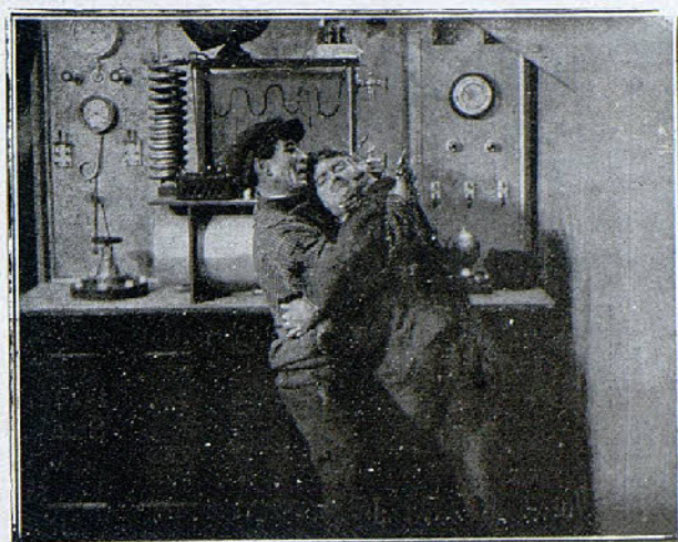
Una escena de la película «El secreto del submarino»

—Perdóneme: es esta mujer la que me ha perdido.