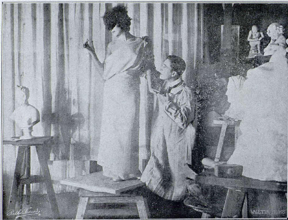
Una escena de la película «Flor emponzoñada»

En la isla de Santa Cruz. —Milagrosamente han escapado del peligro llegando a la isla de Santa Cruz, donde arriban. También Mahlin y su cómplice Satsuma, lo mismo que Morton Olga. La presencia de Hope contraría los planes de la espía. Pero todos, por su parte, se proponen adquirir los famosos ejemplares, por si contienen el secreto del submarino. Hope se encamina a visitar a Fitzmaurice,