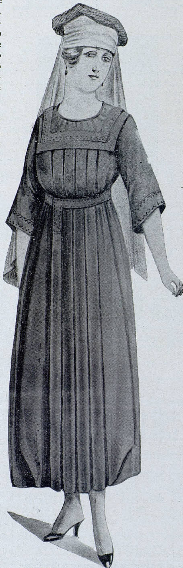
Sencilla toilette de luto, compuesta de una túnica calada formando tableros, y adornados el escote, las mangas y la faja con biesses bordados en seda.