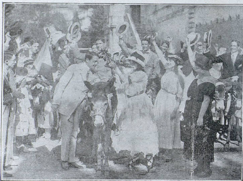
Una escena de la película «Las víctimas del amor»

En la hermosa comarca que rodea a la en-