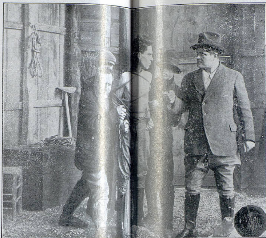
Una interesante escena de la extraordinaria película de casa Pasquali-Film «El escándalo de la princesa Jorge» (Exclusiva de M. de Miguel)

De entonces acá, muchas fueron las cartas que recibimos pidiéndonos datos y cuentas no-