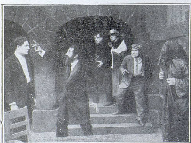
Una escena de la película «La Mancha Roja»

Las grandes exclusividades * Próximamente las grandiosas películas