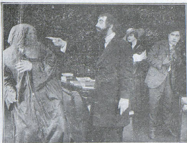
Una escena de la interesante película «La mancha roja»

Pero Jenny se asusta de su propia maldad y viendo que es inminente una desgracia, se arriesga a avisar a Enrique de que no acuda a la cita con Susana, y, equivocadamente, toma un mantón de ésta y atraviesa el jardín. Armando, que aquel día ha regresado tarde y