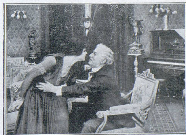
Una escena de la película «La Mancha Roja»

A poco, salen los bandidos del cuarto, y, al mirar el Dr. Montrose si han apurado los vasos, Tanner ve la maniobra y le asesta un terrible golpe en la cabeza que hace que el Dr. Montrose se desplome sin sentido.