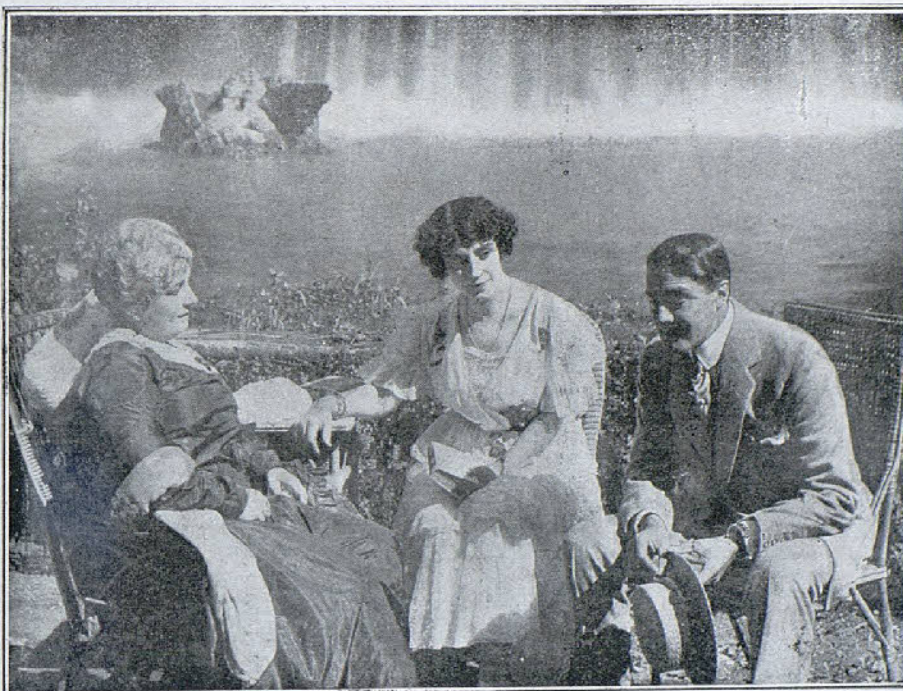
Una escena de la película «Las víctimas del amor»

El lisiado se dirige a un puesto telefónico