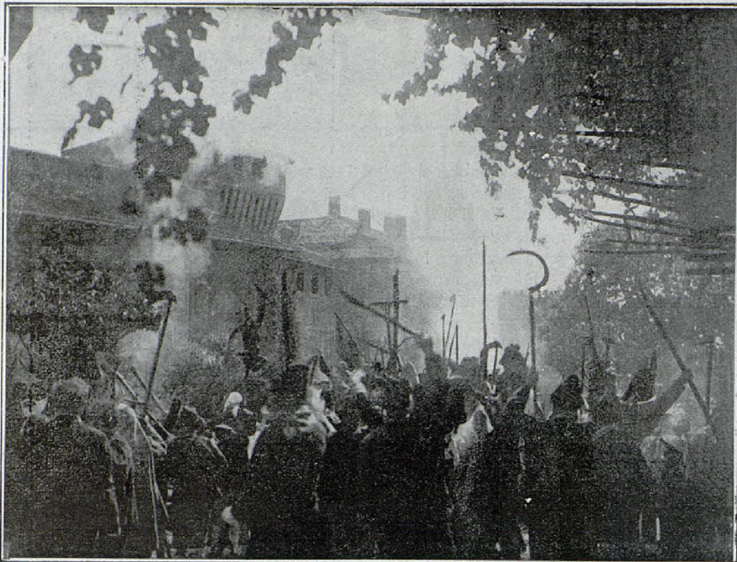
Una escena de la película «La muerte del Duque de Ofena»

Y sobre aquel cuadro de dolor y de vergüenza se levanta solamente Intacto, el faro divino de la redención.