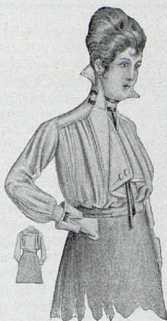
Bonita blusa de fayetina, plisada y recogida por la pieza del hombro. Grandes solapas, cuello y bocamangas con calados, y lazos de moaré sosteniendo el cuello.

Y el resto de los teatros se aguantan como pueden, esperando la hora del cierre.