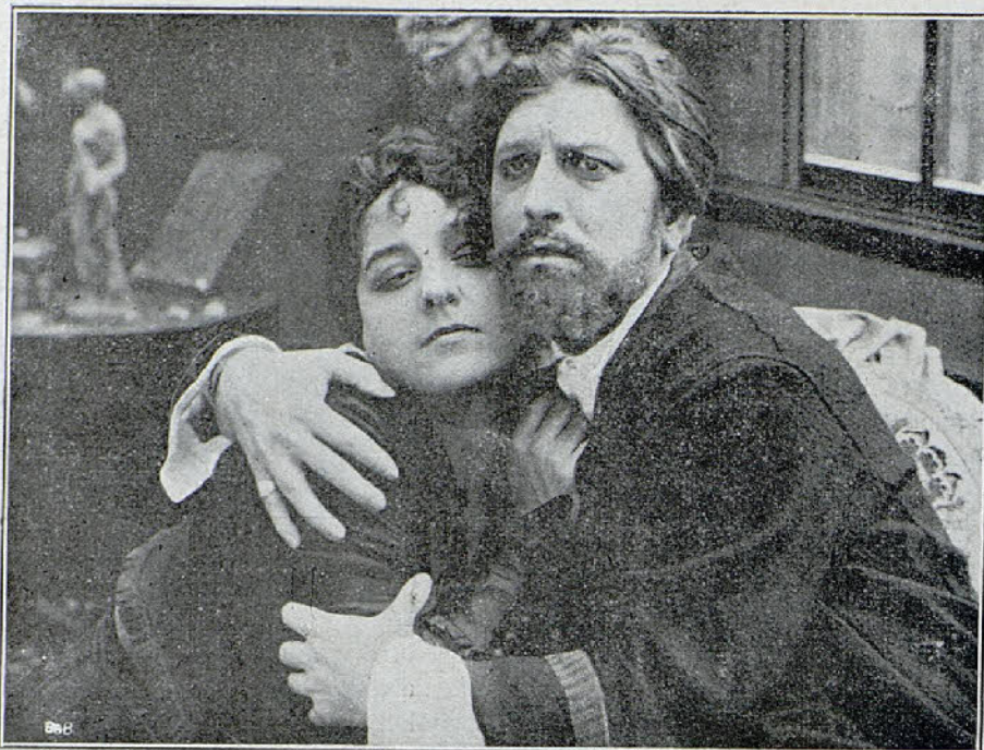
Una escena de la película «La huella reveladora»

El trastorno que le produce el desprecio que le testimonia la condesa, acaba por perturbar la razón del escultor, hasta que un amigo de este, que teme por su salud, escribe una carta urgente a la condesa insistiendo quiera convencerse de una vez de la inocencia de Rodier para lo cual le remite la prueba con-