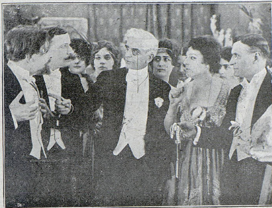
Una escena de la película «La huella reveladora».

Vanya telefona a Haroldo y logra que éste vaya al estudio del pintor, donde, una vez reunidos los tres, entra ella en otra habitación para traer cierta bebida a sus amigos, y desliza en ambos vasos unos polvos que producen un profundo sueño letárgico. A Haroldo se le rompe casualmente el vaso, y se marcha para ir a buscar a Florencia, como le