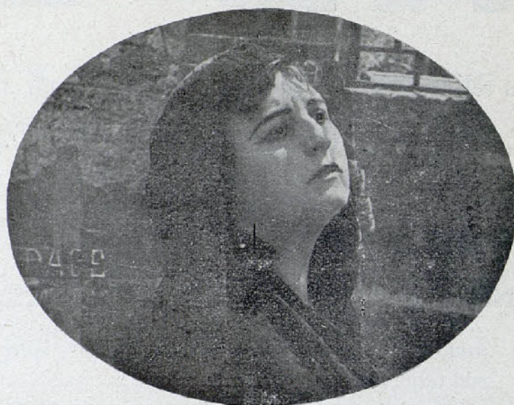
Una de las principales intérpretes de la película «La muerte del duque de Olen»

Figuran en primer término «L'Affaire Clemenceau», editado por la casa César, de Roma, y de la que es protagonista la célebre actriz Francesca Bertini.