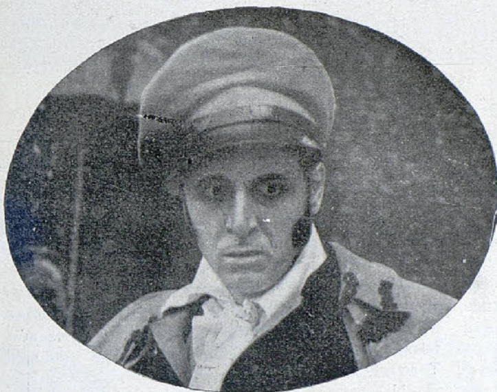
Uno de los principales intérpretes de la película «La muerte del Duque de Ofena»

Mientras los aldeanos esperan con ansia una decisión, Mazagrón y los criados del