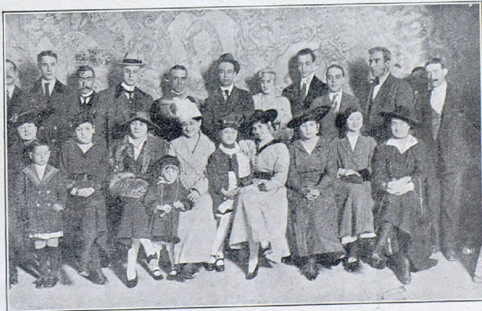
Artistas que tomaron parte en el Festival de la Cooperativa de Periodistas para la construcción de casas baratas

A todos ellos les debemos los periodistas barceloneses eterna gratitud.