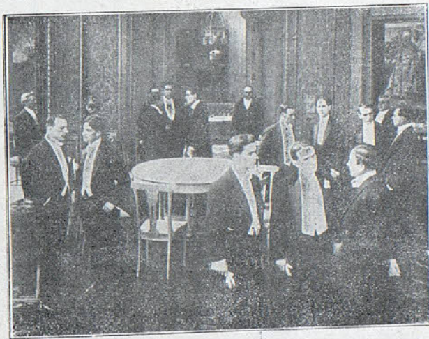
Una escena de la película el «Club número 13»

Y mientras tanto, Blanca, víctima de una de esas ilusiones que da la fiebre, continuaba su ruta hacia lo desconocido, una sombra seguía sus pasos como un misterioso protector.