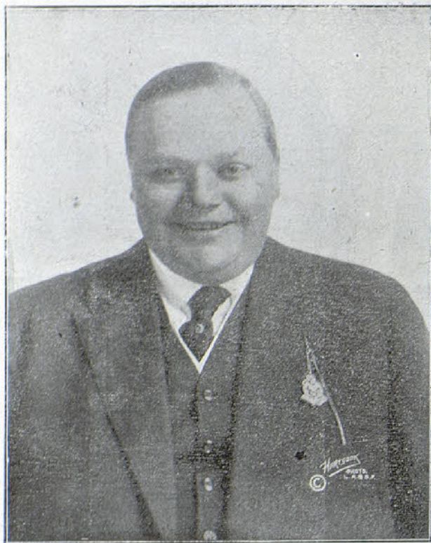
Roscoe Arbuckle (Fatty)

El renombrado cómico de la Triangle Plays, del grupo «Keystone»