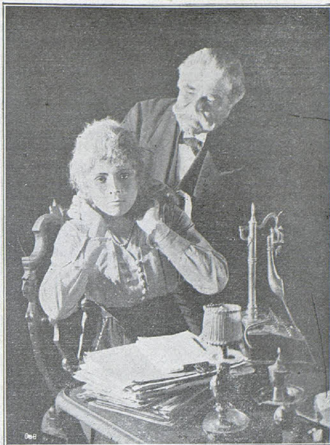
Una escena de la película «¿Lo escrito queda?...»

Desgraciadamente para ellos, el haber estado a las órdenes de Fischer constituye un estigma degradante, y