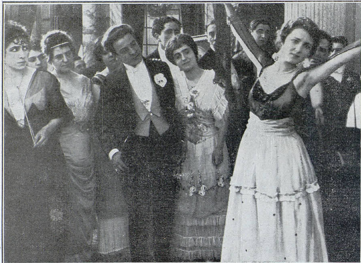
Una escena de la película «La bailarina enmascarada»

Ruegos, súplicas y algún conato de amenaza al fin, todo fué inútil, todos sus lamentos