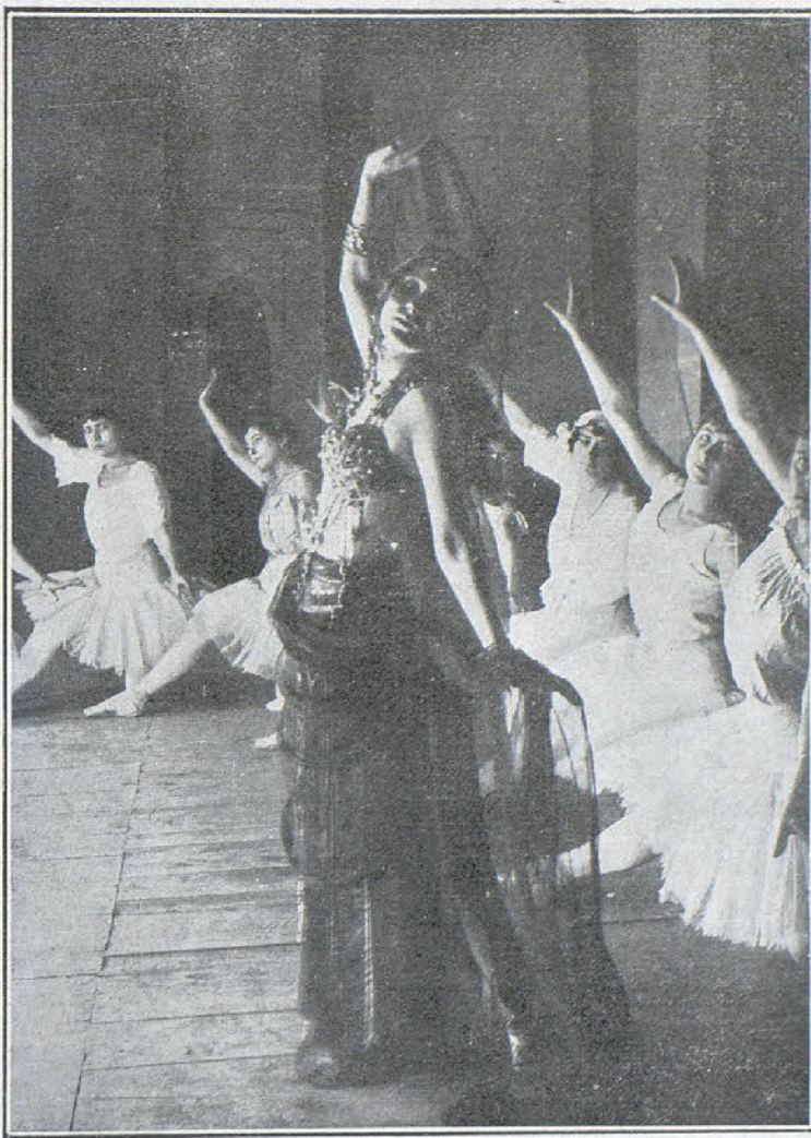
Una escena de la película «La bailarina enmascarada»

ha sido expulsado del Brasil, después de aquel trágico incidente. El encuentro con su hermano hace renacer en Cecilia apego a la vida que ya veía despedazada, y ocultando a Pedro su matrimonio, exclama con entusiasmo, que vivirá de nuevo con él y sus antiguos compañeros y que volverá a ser la pequeña