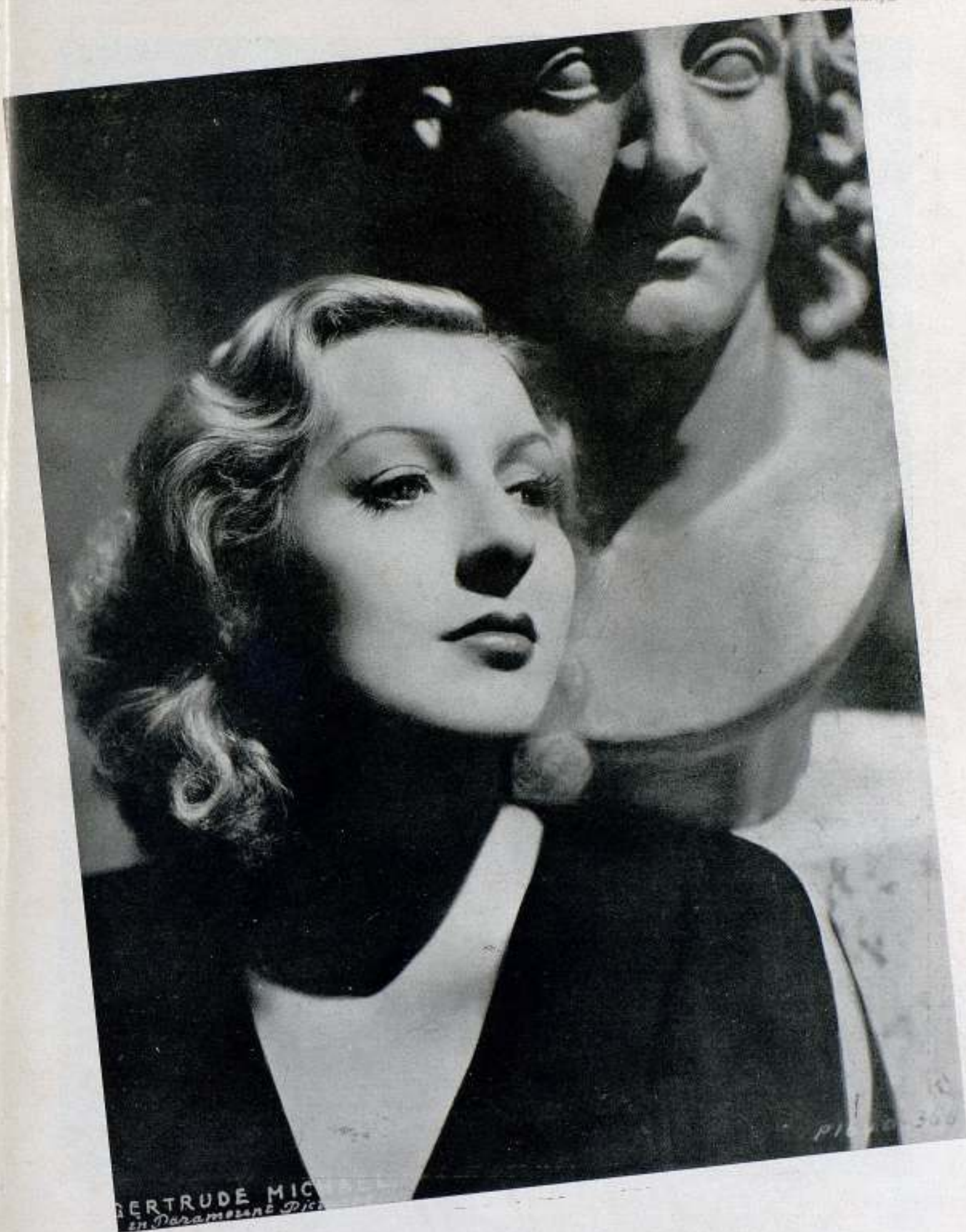
Gertrude Michael, de Paramount