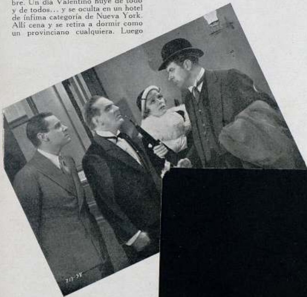
Obsérvense a Margaret Sullivan en dos incompares momentos de «Una chica angelical» de la Univ.

vieron a punto de sufrir un desmayo. Margaret fué descubierta en Nueva York, en «The Modern Virgin». Carlos Laemmle, hijo, la contrató para el rodaje de «Parece que fué ayer». Hollywood quedó asombrado ante el inesperado genio de la nueva estrella que apenas libadas las primeras mieles de su fantástico triunfo con su asistencia personal a los estrenos de Nueva York, desapareció de repente del círculo de sus admiradores. En vano los reporters de más agudo olfato buscaron a la Sullivan. En vano Carlos Laemmle, mediante un manifiesto, la instó para que en cumplimiento de su contrato se presentase en los Estudios. En vano las empresas