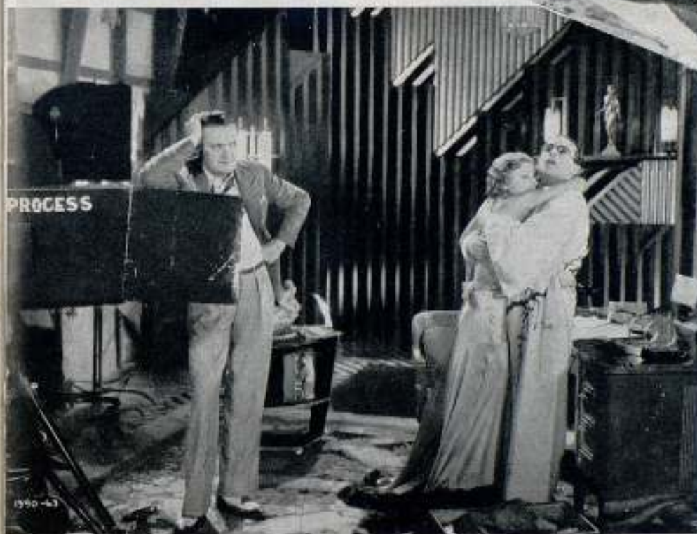
Aquí tenemos al incomparable Harold, en un curioso momento de la filmación de una escena, en la que figura desahogar al cameramen, por su "pose" afectadamente ridícula

yección. Dos o tres veces por semana el salón se convierte en una sala de proyección en la que se dan las películas de más éxito con asistencia de los familiares y sirvientes.