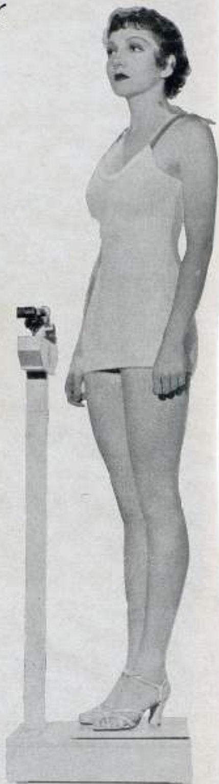
Claudette Colbert pesa 52 kilos y tiene 1,62 metros de estatura. Bebe tres vasos de leche entre comidas para recobrar el peso que pierde cuando trabaja en alguna película. No es adicta a dietas.