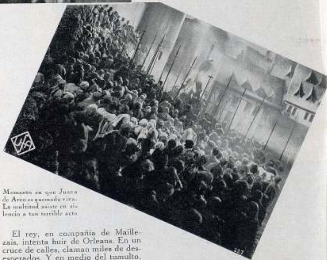
Momento en que Juana de Arco es quemada viva. La multitud asiste en silencio a tan terrible acto

Maillezais, un joven francés, gentilhombre, es enviado por el rey al campamento enemigo para lograr la paz; pero regresa maltratado y sin haber conseguido su propósito. Son inútiles sus intentos y los ruegos desesperados de la población atormentada, que no quiere entregar Orleans. El rey no puede mandar sus tropas, pues sólo obedecen a Dunois, que las tiene a sueldo.