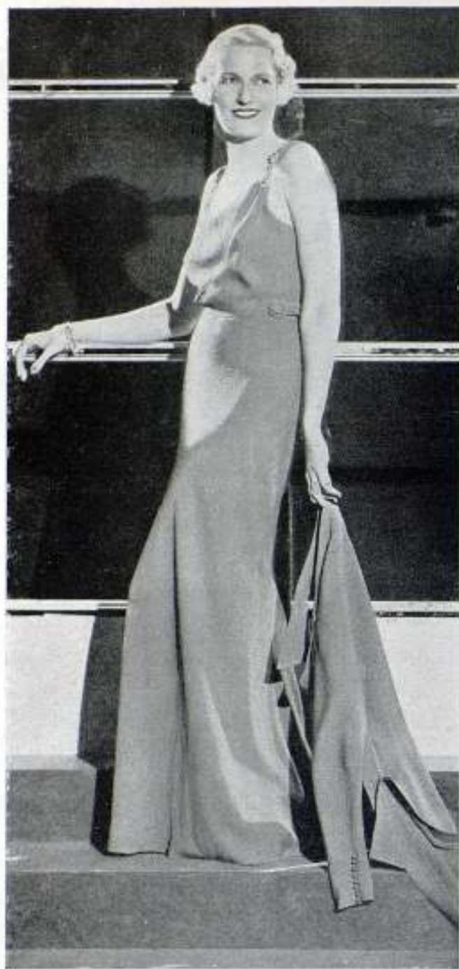
Precioso traje de noche y chaqueta complementaria, lucidos por Verree Teasdale, de la Warner Bros

Pues bien: ¿cómo alegrar los vestidos oscuros, ya sean de lanilla o seda, que hemos de lucir en los primeros días de octubre? La solución nos la ofrecen los creadores del arte modisteril con toda variedad de fruslerías, que son la boga esta temporada; ellos no se permiten reposo, buscando complacer siempre los deseos de la mujercita moderna, y han creado una extensa colección de cuellos, puños, chorreras, etc., etc., que nos permitirán transformar y rejuvenecer una toaleta por severa que sea.