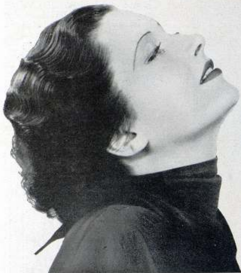
Kay Francis, en una pose altamente sugestiva, en vespere, al parecer, del beso deseado

Cada año Kay Francis visita una nación europea, guiándose por un itinerario que tiene preparado y en el cual van entrando en turno los distintos países que ella se ha propuesto recorrer en sus vacaciones anuales. Este año, Kay, fué a Italia.