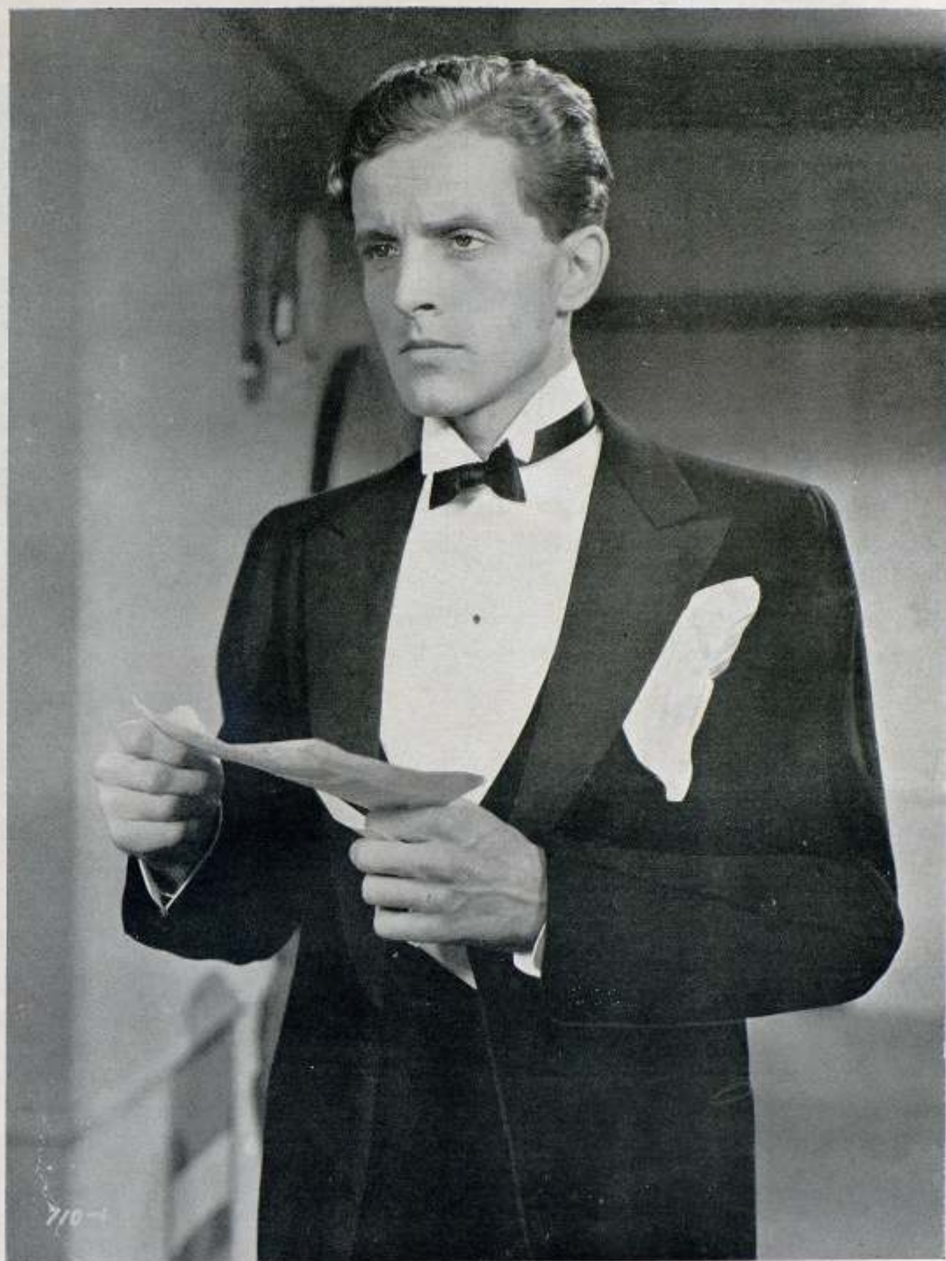
Phillips Holmes de la Universal