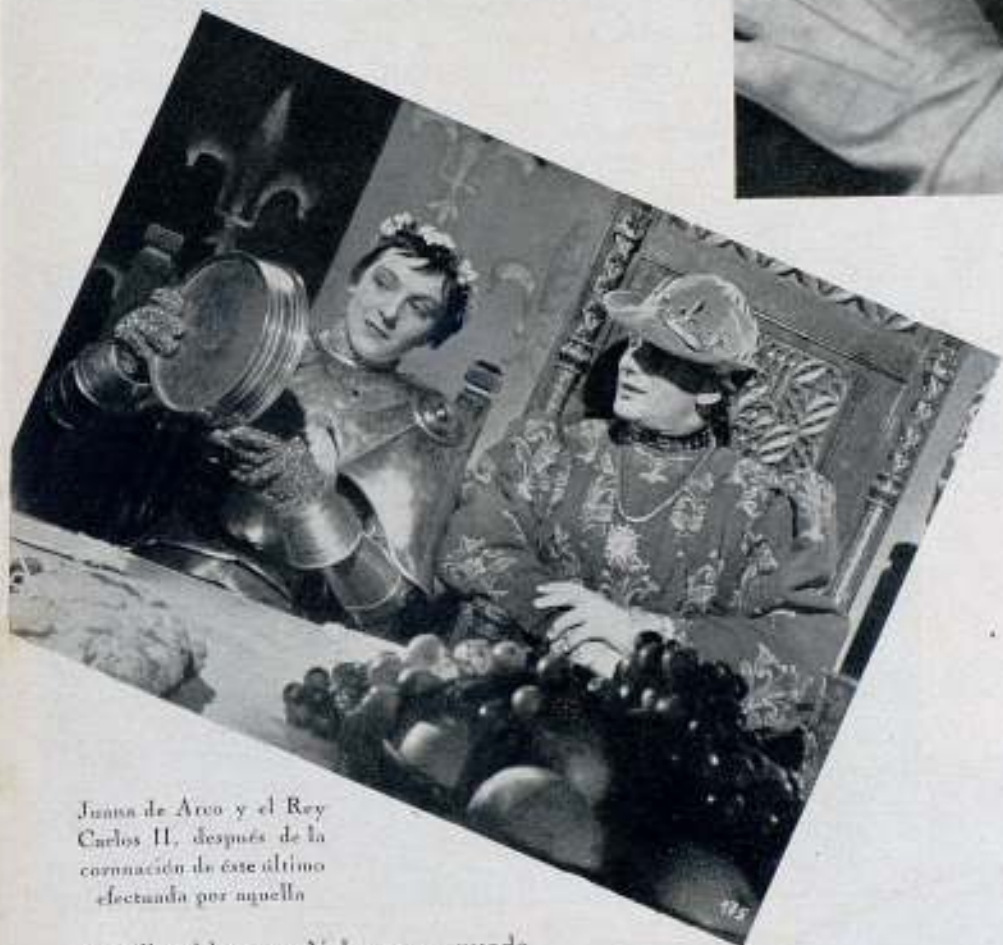
Juana de Arco y el Rey Carlos II, después de la coronación de éste último electuando por aquella

sencilla aldeana». Y Juana no puede vencer a la peste. Y el rey la abandona porque sabe que no puede arriesgar la fe y la obediencia de su pueblo por el oscuro destino de esta muchacha.