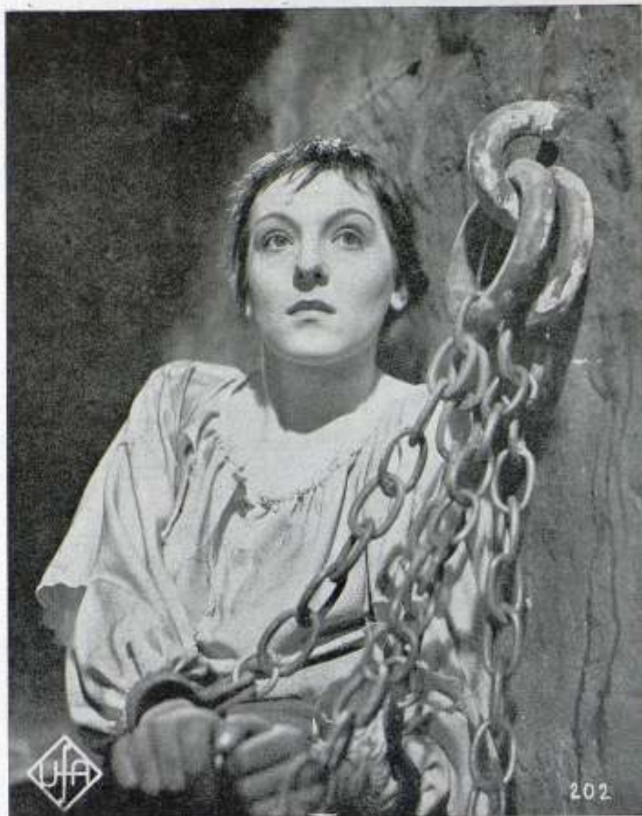
Juana de Arco, en la cárcel, pocas horas antes de ser ejecutada