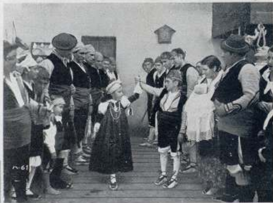
He aquí dos curiosas escenas de «El último contrabandista» film perteneciente al repertorio M. de Miguel

También cabalga Miguelón por entre las cortaduras escondidas, por sobre los pasos anfractuosos de la cordillera Pirenaica, que ofrecen, cabe los repliegues y corcovados de sus macizos pétreos rientes valles de ensueño, bellos remansos de paz.