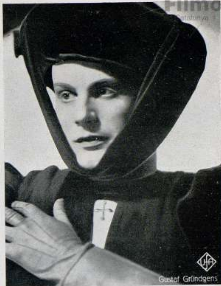
El Rey Carlos II, de Francia, que en este film encarna Gustav Gründgens

El rey no la defiende porque sabe que Juana solamente puede ser salvada por la fe que el pueblo ha puesto en ella. Pero esta fe, no existe ya. Se ahogó con la victoria obtenida. Desapareció al nacer la idea de «no es posible deber esta victoria a una