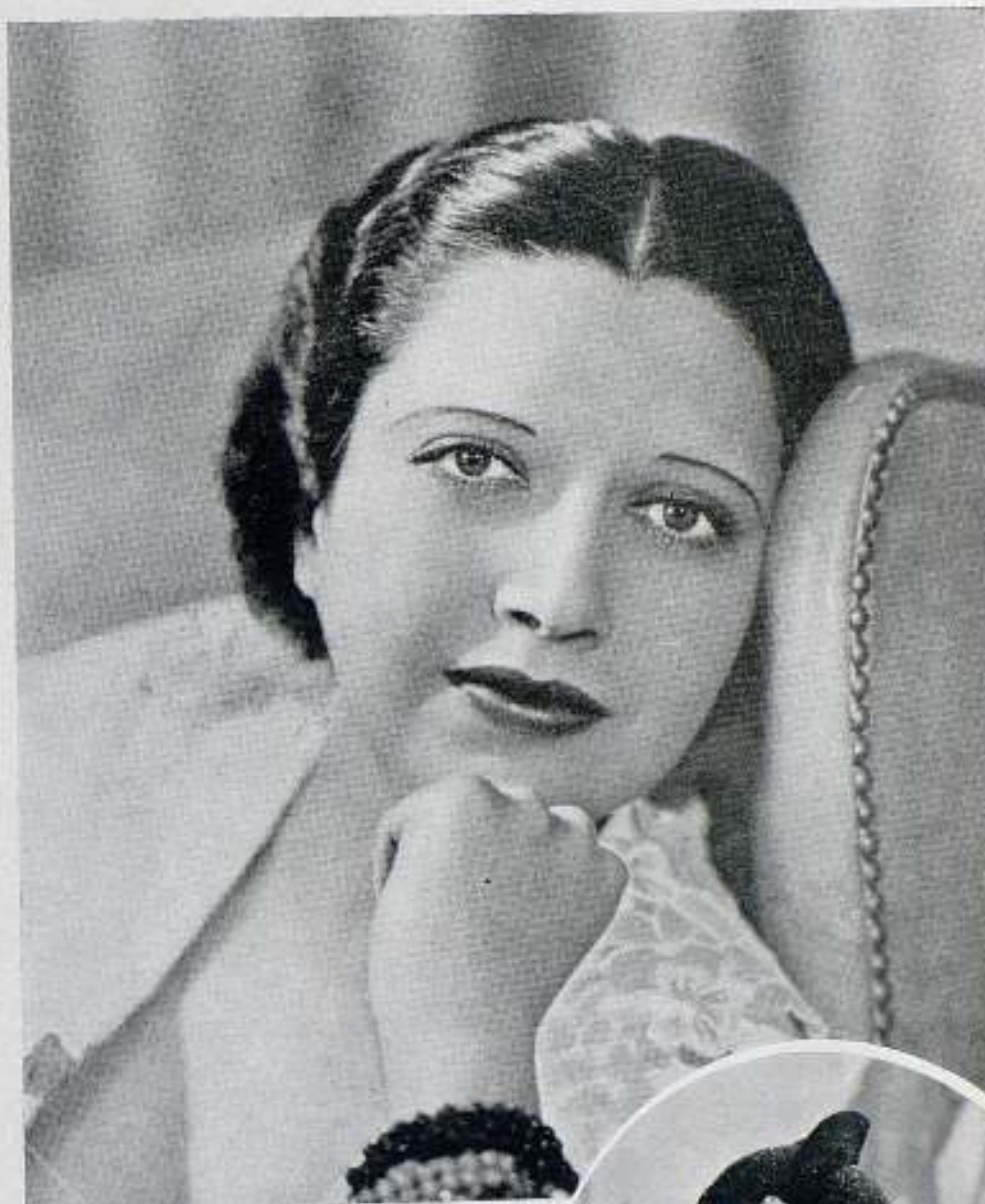
Bella, magnífica mujer, Kay Francis, de la cual están platónicamente enamorados millares de hombres de las cinco partes del mundo

Volviendo a nuestro tema de que Kay Francis es una de las pocas mujeres famosas que acceden a oír consejos y a seguirlos, deseamos puntualizar sobre el hecho de que ella no usa cosméticos de ninguna clase, exceptuando el líquido rojo para los labios, pues el creyón no le agrada, y prefiere el método que indicamos para colorear sus labios. Esto es debido a que en París se le aconsejó no usar afeites y Kay aceptó aquel consejo, con el resultado de que la ausencia de ellos le dan una apariencia positivamente excepcional.