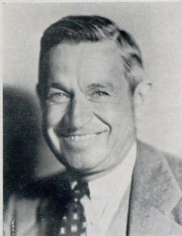
Will Rogers, el célebre actor cinematográfico, fallecido trágicamente en un accidente de aviación

por la radio. De él se cuentan las más extraordinarias anécdotas, lo que hizo que recientemente hiciera