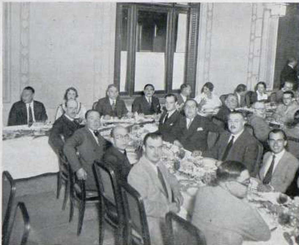
Presidencia del Congreso Fox, en el banquete celebrado en el Ritz de Barcelona

En viaje de recreo vino a Nueva York hace unas semanas; la estación del ferrocarril estaba llena de