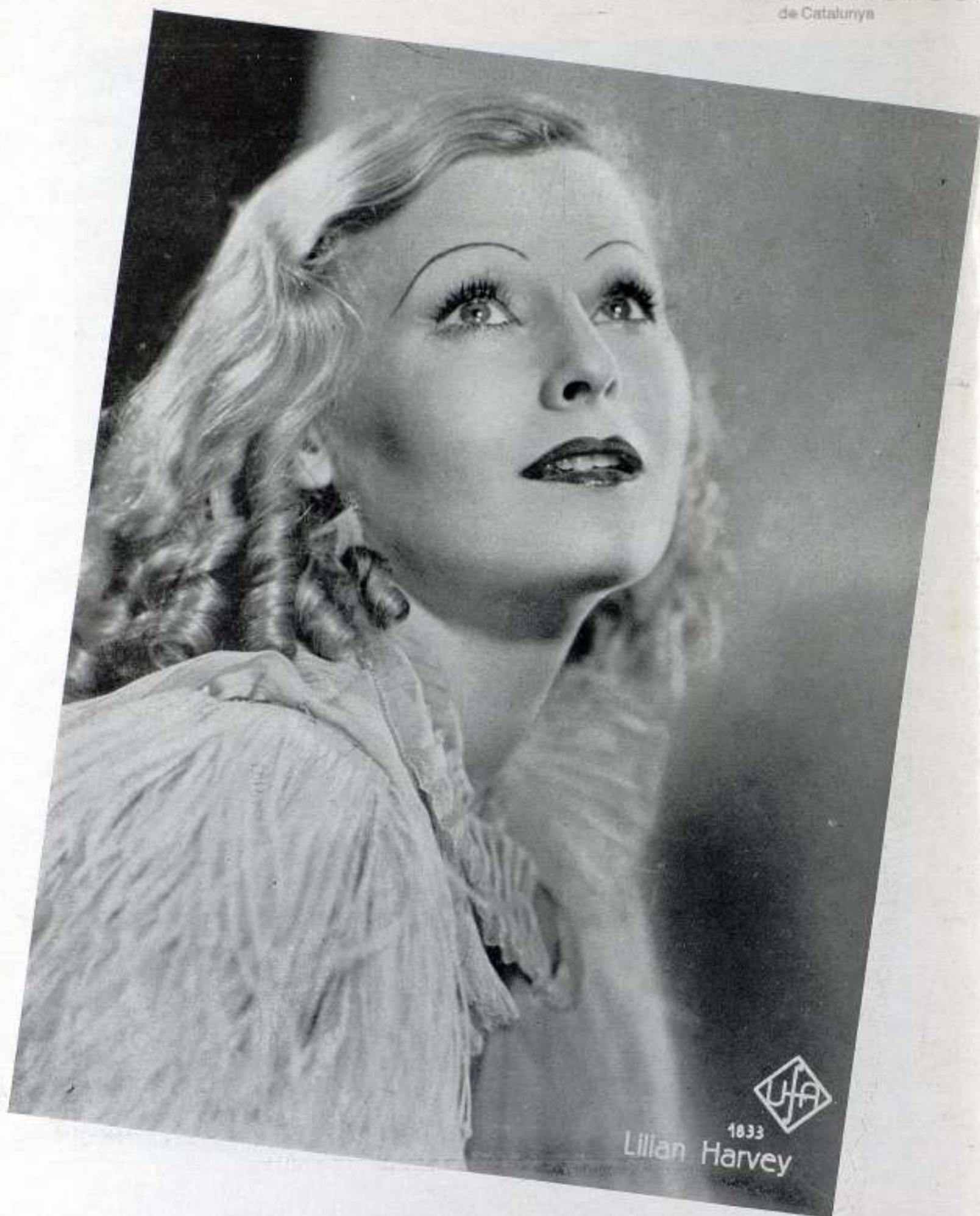
Lillian Harvey, de la Ufa