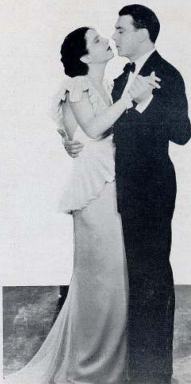
Kay Francis, baila apasionadamente con George Brent, en esta escena de «La vida es sustrato» de Warner Bros

to s acce infin los e exan tum ofre dad apa