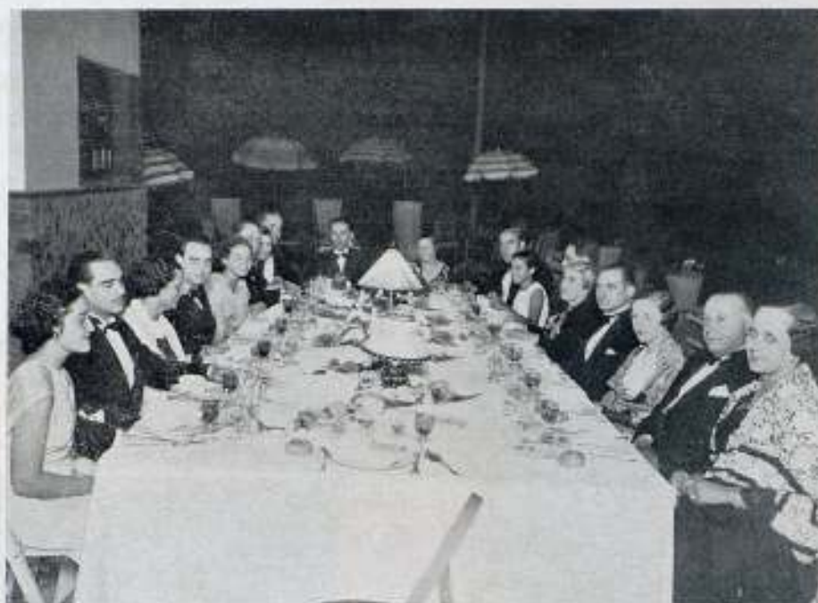
LA CONVENCION UFA EN ESPAÑA

Deseamos a la nueva casa mucha suerte en sus actividades comerciales.