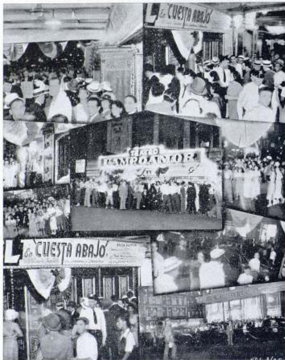
Varios curiosos aspectos del estreno de «Cuesta Abajo», en el Teatro Campesino de Buenos Aires