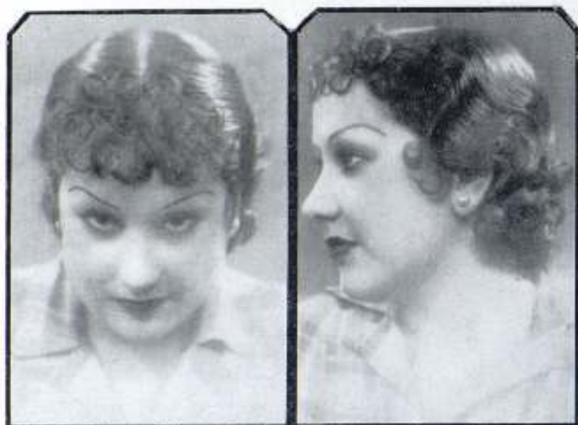
CREACIONES DE J. BORDALLO

Movimiento, flexibilidad, a veces una cuasi rigidez conseguidos por medio de recogidos, de corte adecuado. Y de adornos aprestados que les dan suma gracia de buena ley.