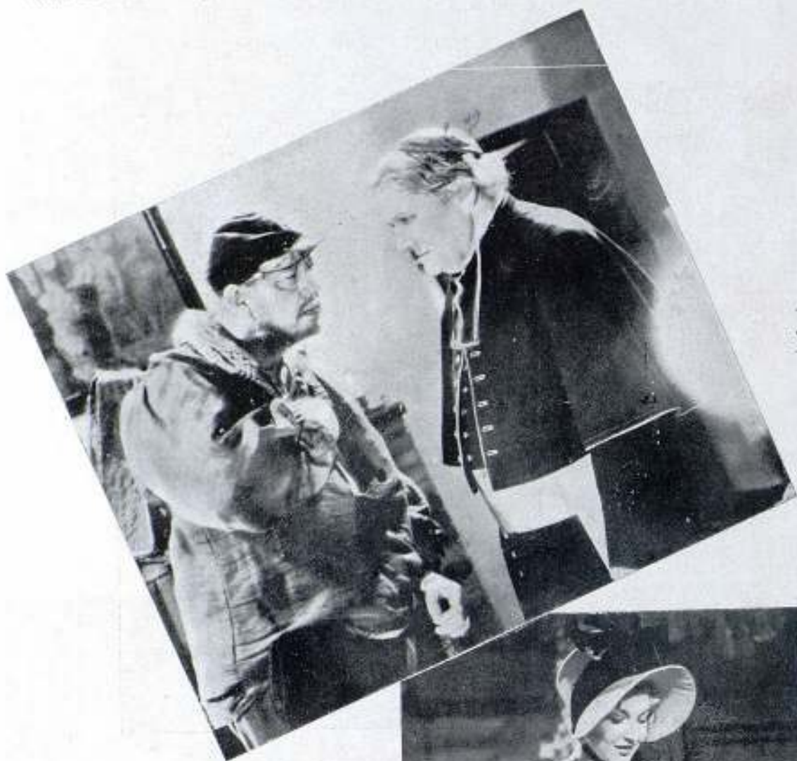
Das interesantes escenas del film Exclusivas Trian "Los Miserables"

cendencia como los de Juan Valjean, Fantina y Gavroche, pero la editora supo seleccionarlos con acierto. No hay más que observar desapasionadamente las fotografías