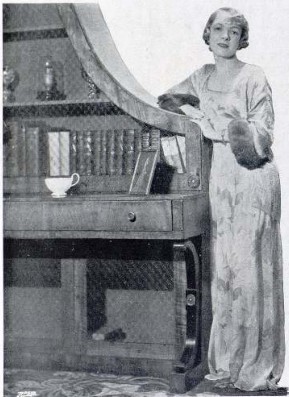
Helen Hayes en la intimidad de su hogar, en Hollywood

Y mientras se estaba escribiendo «Rasputin and the Empress» (también conocida por «Rasputin, the mad monk»), Charlie se encerraba en su habitación y yo me sentía arrullada en mi sueño hasta media noche con el tictac de su máquina. Charlie se vió también asediado por nuevas obras teatrales. Durante este período estuvo trabajando en