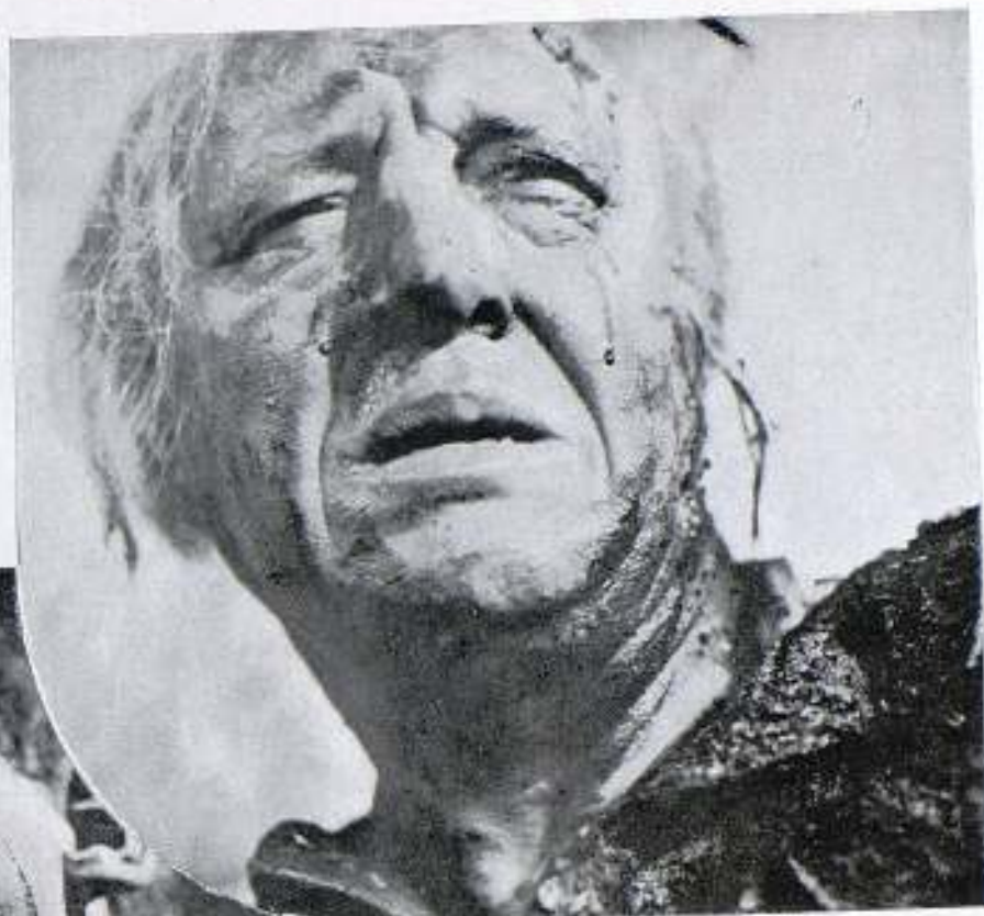
Tres rostros de dolor: Juan Valjean, Gavroche y Fantina, de «Los Miserables»