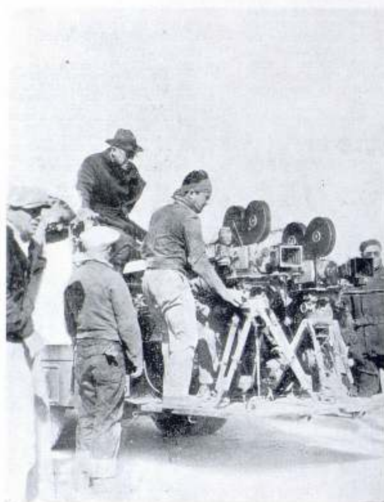
Cecil de Mille, dirigiendo su última producción para la Paramount

no que nos demuestre que tiene imaginación y que puede escribir de forma que interese y conmueva. El pide que le demos una oportunidad, pero, ¿cómo complacerle? La producción de una película cuesta alrededor de unos trescientos mil dólares y no hay editora que arriesgue esa suma con la obra de un hombre a quien el público no le ha reconocido.