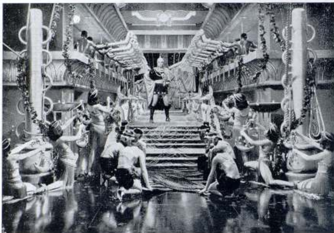
Una interesante escena de "Cleopatra"