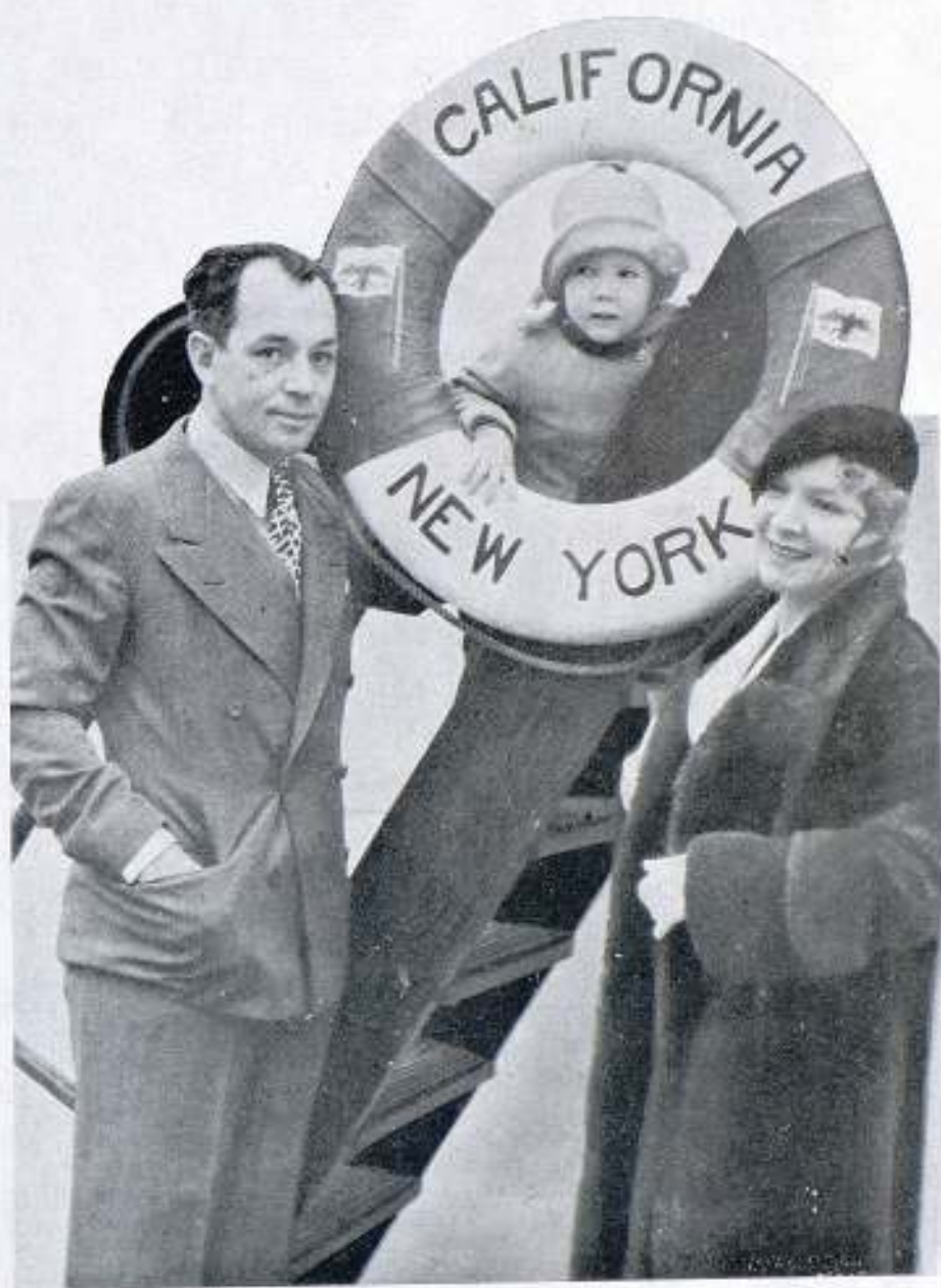
Helen Hayes con su esposo y su hija Mary, al llegar a Nueva York. Actualmente están viajando por Europa en compañía de Norma Shearer e Irwing Thalberg.