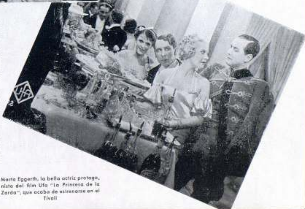
Marta Eggerth, la bella actriz protagonista del film Ufa «La Princesa de la Zarda», que acaba de estrenarse en el Tivoli

Es una frase estereotipada, decir que la mejor creación de una artista, es la más reciente, pero en esta ocasión está plenamente justificada.