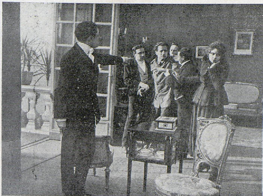
Una escena de la película «Triste caso»