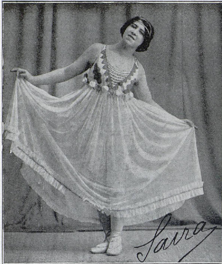
SAIRA renombrada danzarina que ha debutado en el Teatro Imperio donde es muy aplaudida