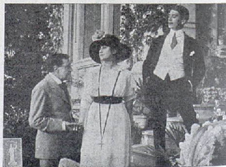
Una escena de la película «El límite de la vida» (Latina Ars.)

soy el único en el mundo que quito el Vello o pelo radical y para siempre, sin irritar ni perjudicar en lo más mínimo el cutis. 25.000 pesetas apuesto contra igual cantidad al que pruebe y justifique lo contrario, a mujer que tiene Vello o pelo es porque quiere, pues nada se paga si el Vello o pelo vuelve a renacer! ¿Puede darse mayor garantía? Este procedimiento de Depilación es el único que recomiendan todas las eminencias médicas por sus maravillosos resultados y por ser absolutamente inofensivo. Consulta de información y prueba gratis de 9 a 1 y de 3 a 7. Días festivos de 10 a 1. Plaza de Tetuán, 14, pral. Barcelona. También se dan consultas por escrito dirigiéndose a D. Heliodoro Lillo , inventor del maravilloso «Depilatorio de los Angeles». Visite o escriba V. hoy mismo pidiendo datos. No sea V. perezosa, lo que le conviene hacer hoy no lo espere a mañana, que mañana puede ser tarde. ¿Qué va V. a perder? NADA ¿Qué va V. a ganar? MUCHO. Su felicidad, alegría y bienestar para siempre.