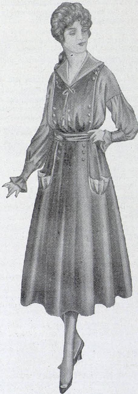
Tollette de casa, para jovencita. La falda y las estolas son de lana morada, y la blusa y los adornos de fayetina violada.

Pero no por estar justificada quedamos menos agradecidos y por lo tanto gracias, muchas gracias a todos, a nuestros queridos colegas y al público.