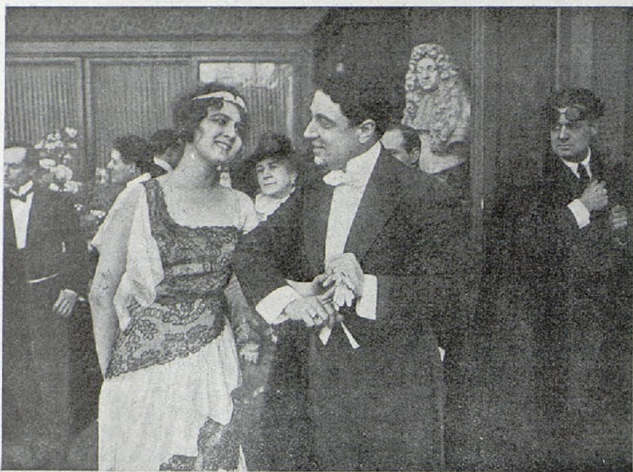
Una escena de la película «Triste caso»