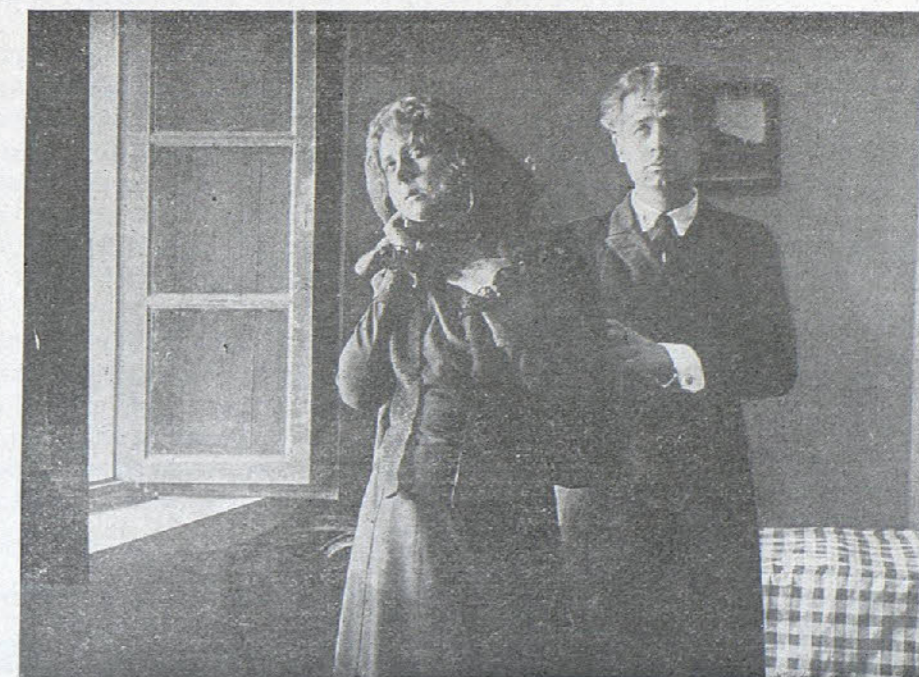
Una escena de la película «Triste ocaso».

PELICULAS y MATERIAL CINEMATOGRAFICO EDUARDO SOLÁ, S. en C. RAMBLA CANALETAS, 4, PRAL. Teléfono 3535.-Dirección Telefónica gráfica -Eduarsola -BARCELONA Agentes exclusivos de las casas Sociétaire des Films et Cinématographes ECLAIR, PARIS - JILBERT, PARIS Aparatos proyectores-Objetivos Sincronizadores Sovelens-J. DEBRIE, PARIS - Aparatos toma vistas Perov-Indores Optimis-Medidores-Tiradores Concesionarios para todo el mundo de la marca española de películas CONDAL FILM BARCELONA