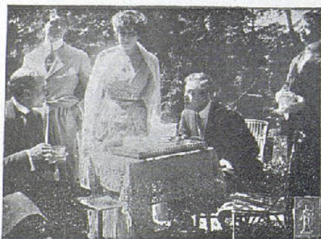
Una escena de la película «El límite de la vida» (Latina Ars.)

Mientras Jansen se lamentaba del poco éxito de su misión, su suegro Waters no cabía en sí de satisfacción por el excelente resultado de la operación y de los futuros pingües beneficios a percibir.