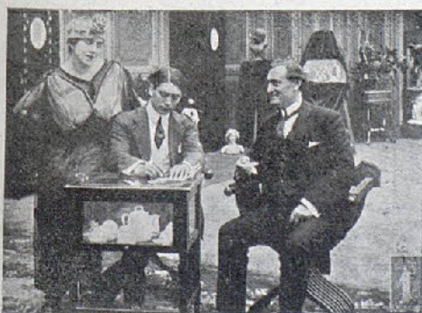
Una escena de la película «El límite de la vida»

El juego y las mujeres son su perdición.