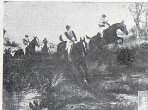
Una escena de la película «El límite de la vida»

Lupnow, sigue los consejos del anciano. Su sér renace a una nueva vida, y se someterá a prueba decisiva. Encarga a Williams se lo advierta Liliana, pero éste aprovecha la ocasión atormentarla con nuevos asedios, y su audacia provoca el desprecio de la pobre mártir que se defiende con todas sus fuerzas.