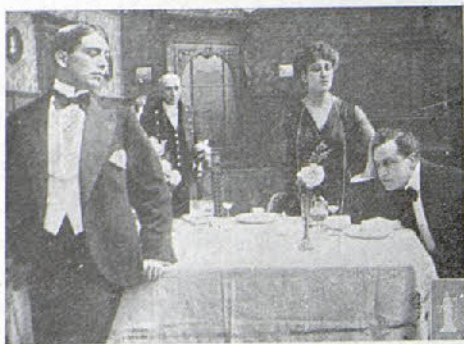
Una escena de la película «El límite de la vida»

«Ha vivido V. con la atrocidad pero ahora esta V. curado. El análisis de la sangre así lo prueba», y mientras Lupnow ebrio de júbilo, piensa en que será perdonado, le parece oír un grito, una suprema invocación de su amada Liliانا.