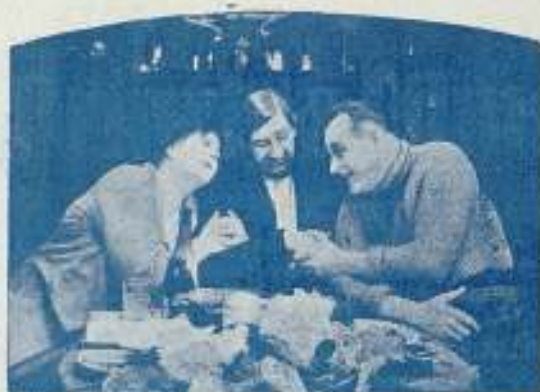
Una escena de LOS DOS PILLETES

Ha batido el «record» de los éxitos en la presente temporada