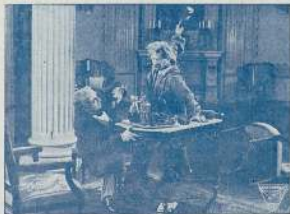
Una escena de EL TRAPERO DE PARIS

Representante para Madrid y Centro: ANTONIO CABALLERO, - Carmen, 6 y 8 - MADRID Región de Levante: VICENTE ALAGÓN, - Gran Teatro, - VALENCIA Región del Norte: CINEMATOGRAFICA DEL NORTE, S. A. - Elcano, 21, 1.º - BILBAO Región de Asturias y Galicia: ANTONIO MÉNDEZ LASERNA, - VIGO