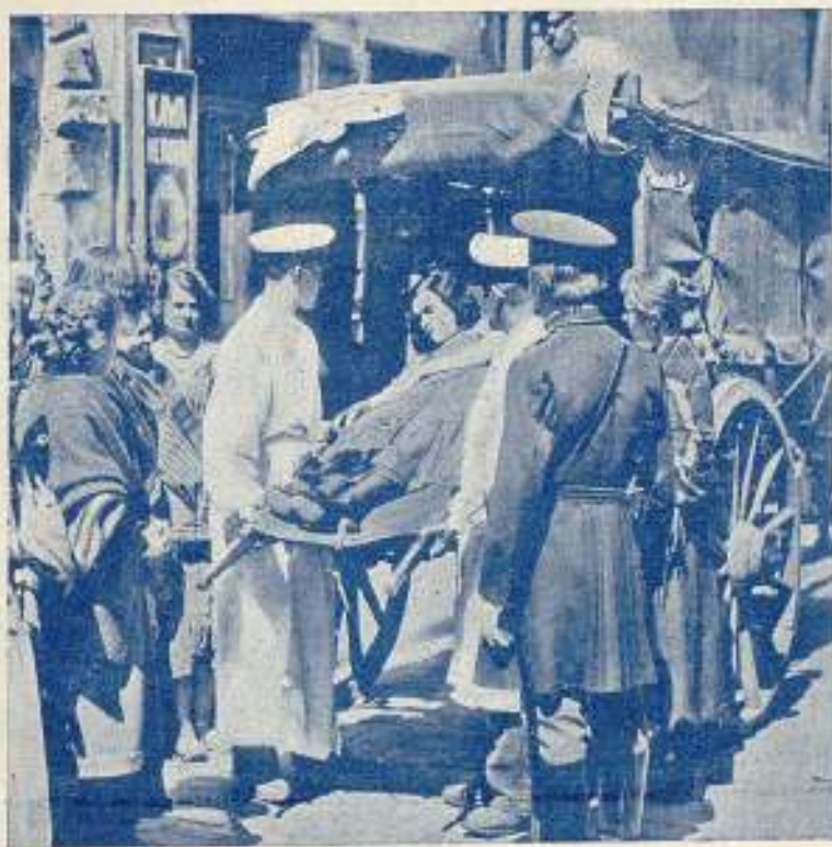
Una emocionante escena de la película

EMOCIONANTE Y DRAMÁTICA HISTORIA DE UNA MUCHACHA DEL PUEBLO PERDIDA EN MOSCÚ BAJO EL DOMINIO SOVIETISTA