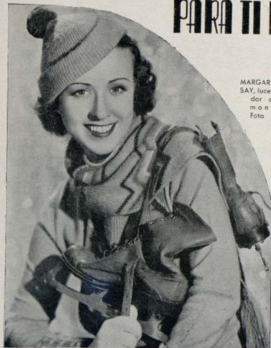
MARGARET LINDSAY, luce encantador a travé de montañés.

tividad igual de alcohol. Con este líquido se humedece por el lado derecho el terciopelo, o también los géneros de seda, y se plancha luego del revés, obteniendo así una limpieza perfecta.