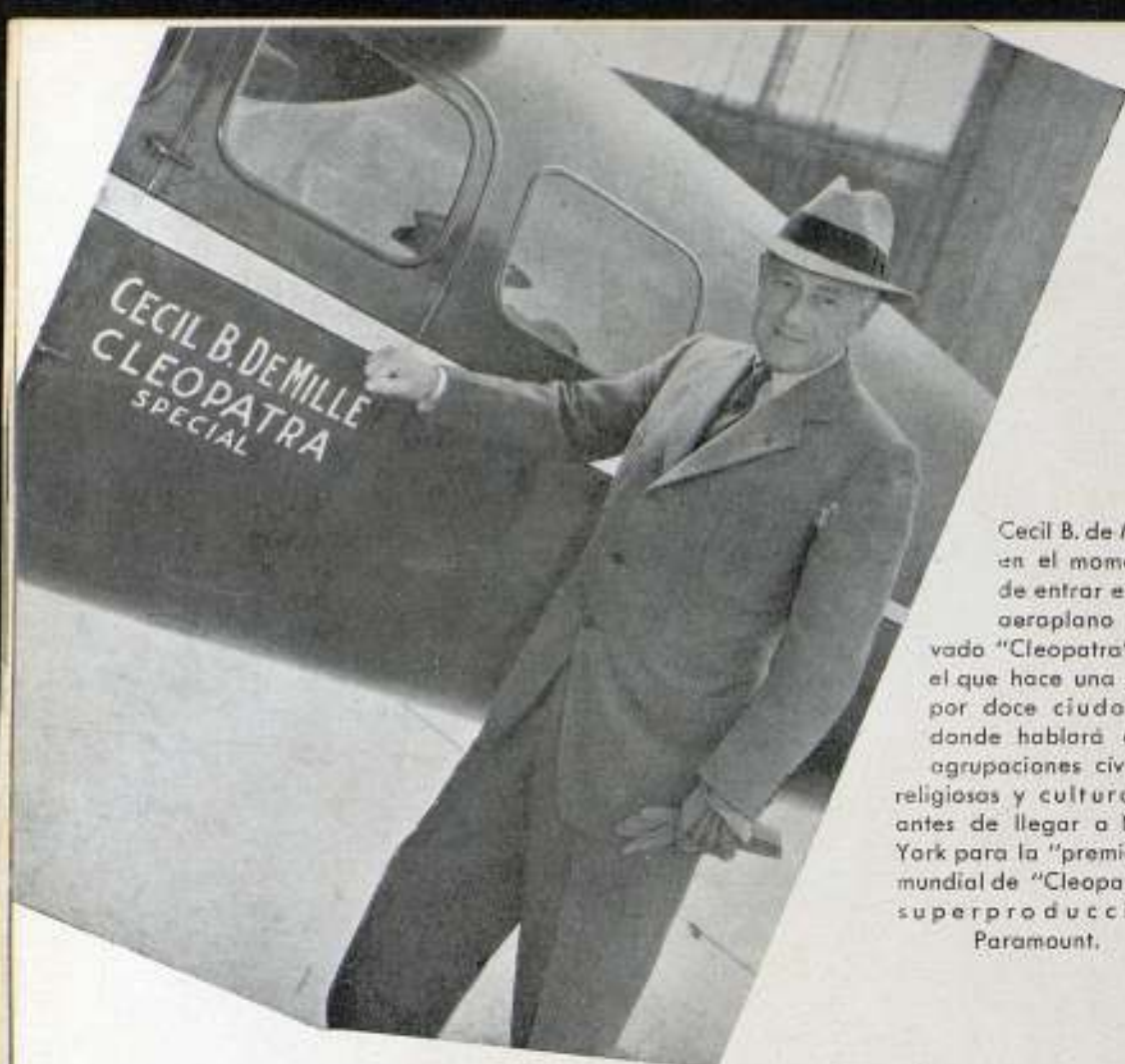
Cecil B. de Mille en el momento de entrar en su aeroplano privado "Cleopatra" en el que hace una gira por doce ciudades donde hablará ante agrupaciones cívicas, religiosas y culturales antes de llegar a New York para la "première" mundial de "Cleopatra", superproducción Paramount.