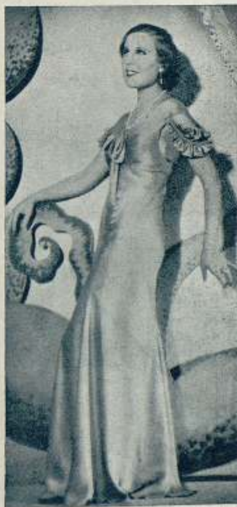
Rosita Díaz nuestra simpática estrella nacional en un movimiento característico de su gracioso andar