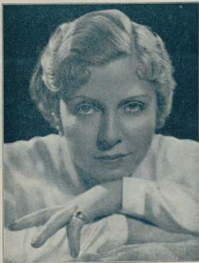
Catalina Bárcena, la principal protagonista de este magnífico film de la Fox.