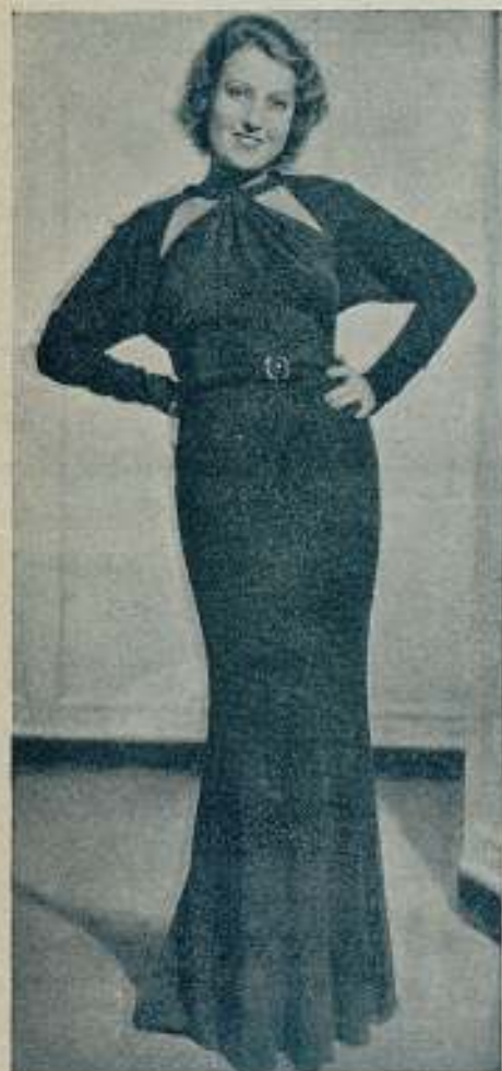
Jeannette Mac Donald, la arrogante actriz que tiene el caminar de reina