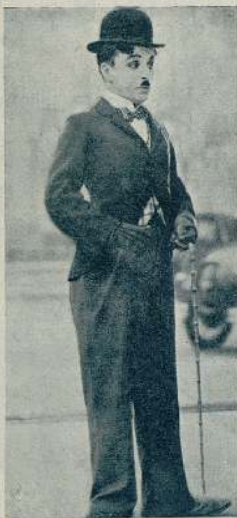
Charlie Chaplin (Charlot), creador de su andar único