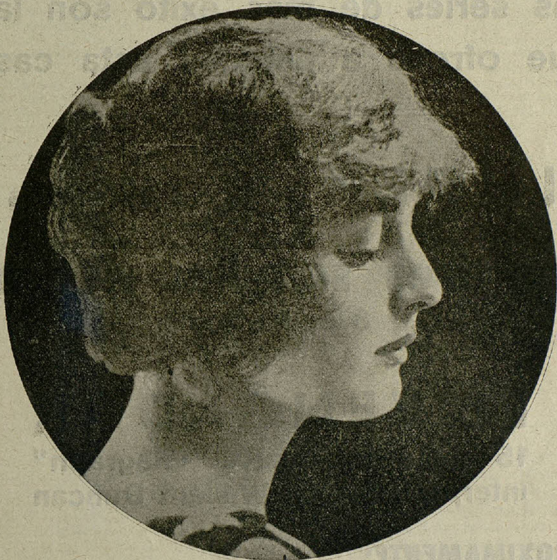
Principal intérprete de "El rey de la audacia"

a ser madre, y el dolor de haber sido engañada y ver su vida troncada, la deja sólo vivir pocas semanas después del nacimiento de su hija Alicia.