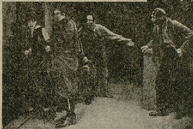
«El rey de la audacia»

fecha — terminó diciendo el doctor Suttino. — Violeta te ama, Dupont, y no quiere, como es natural, verte mezclado en este torbellino de intrigas y de crímenes.