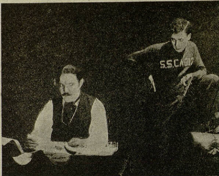
«El rey de la audacia»

Procine. — Se pasaron de prueba, «Por un millón», bonita cinta cómica de la Lary Semon, «El tigre de los llanos», hermoso drama marca Goldwing, interpretado por la renombrada artista Elmire Vutier, y «Quien asesinó», drama de largo metraje y de interesante argumento.