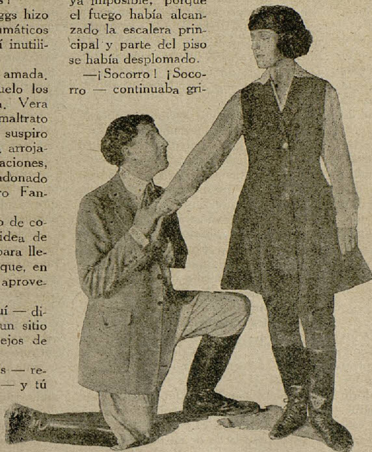
«El rey de la audacia»