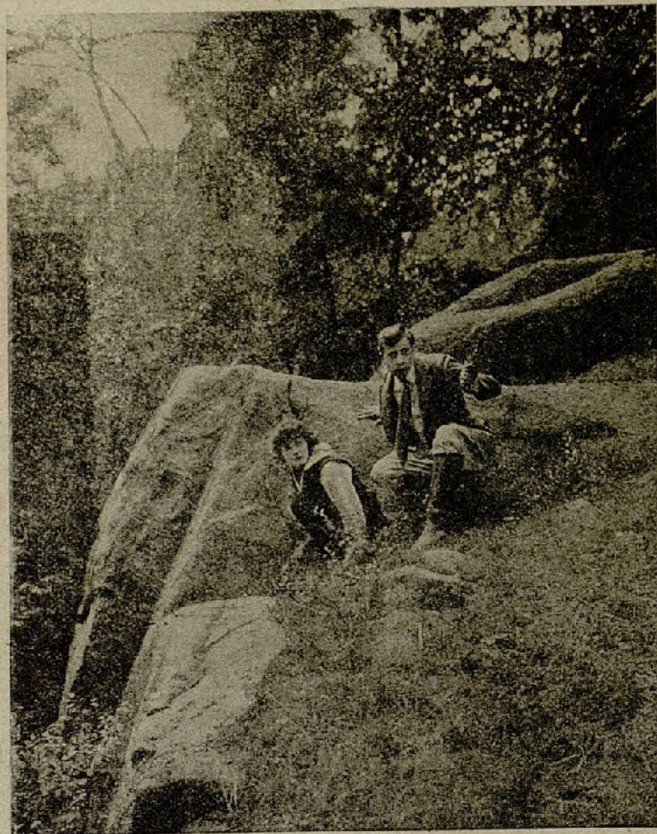
«El rey de la audacia»

El colorido de la decoración del cabaret se hizo en negro y oro. El fondo es una masa sólida de tela dorada, con enormes columnas rematadas en cúpu-