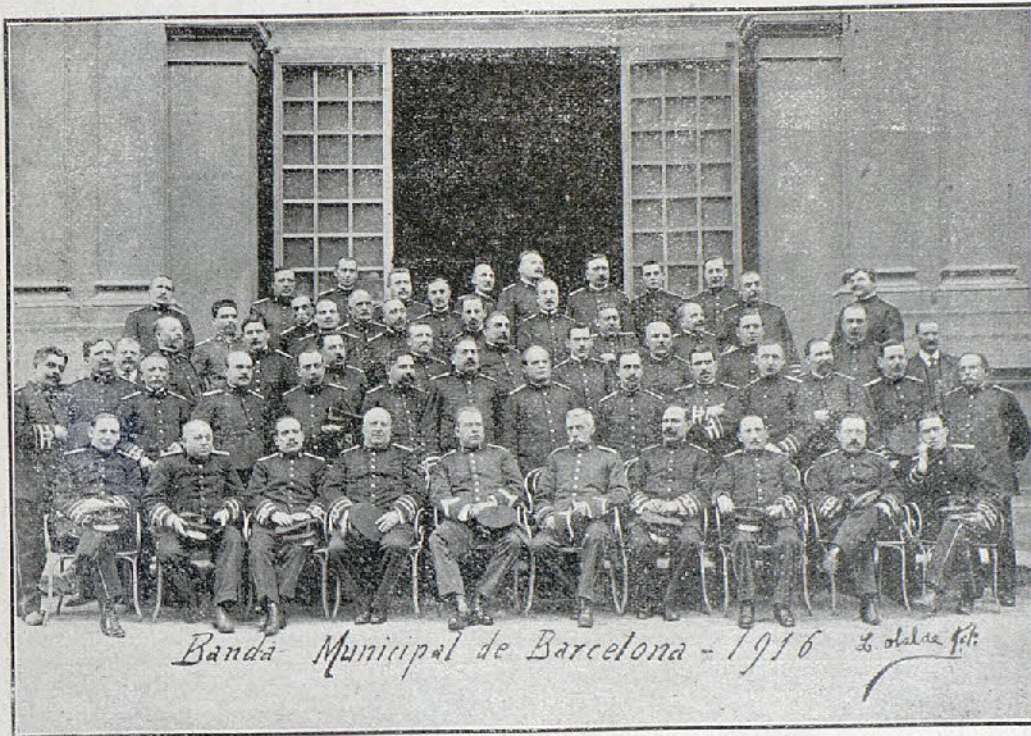
Banda Municipal de Barcelona - 1916

temperamentos distintos ha encarnado nuestra más grande actriz. ¡Qué flexibilidad más portentosa!