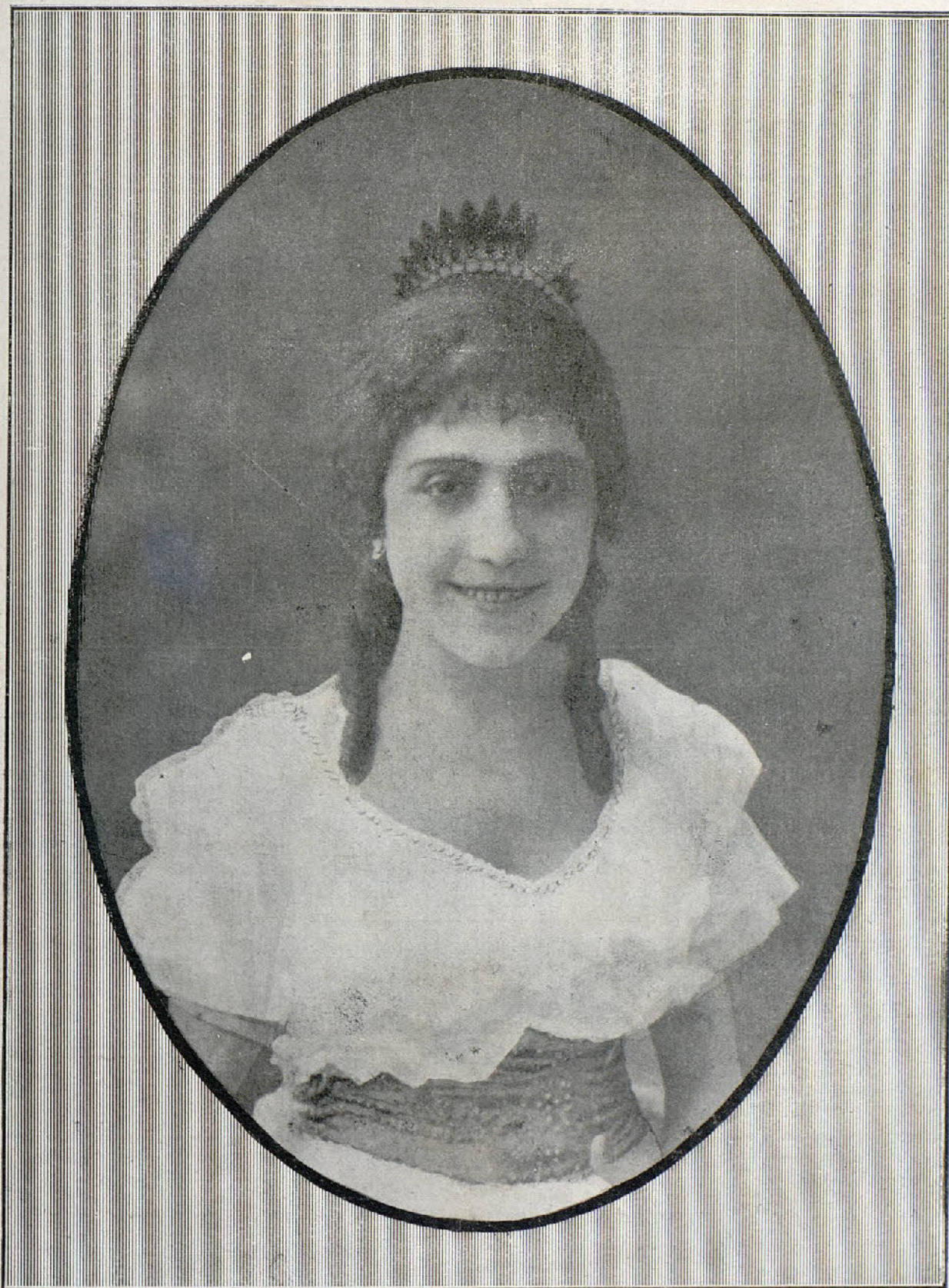
FAVORITA , gentil cupletista madrileña que ha actuado en los principales teatros y conciertos de España con gran éxito