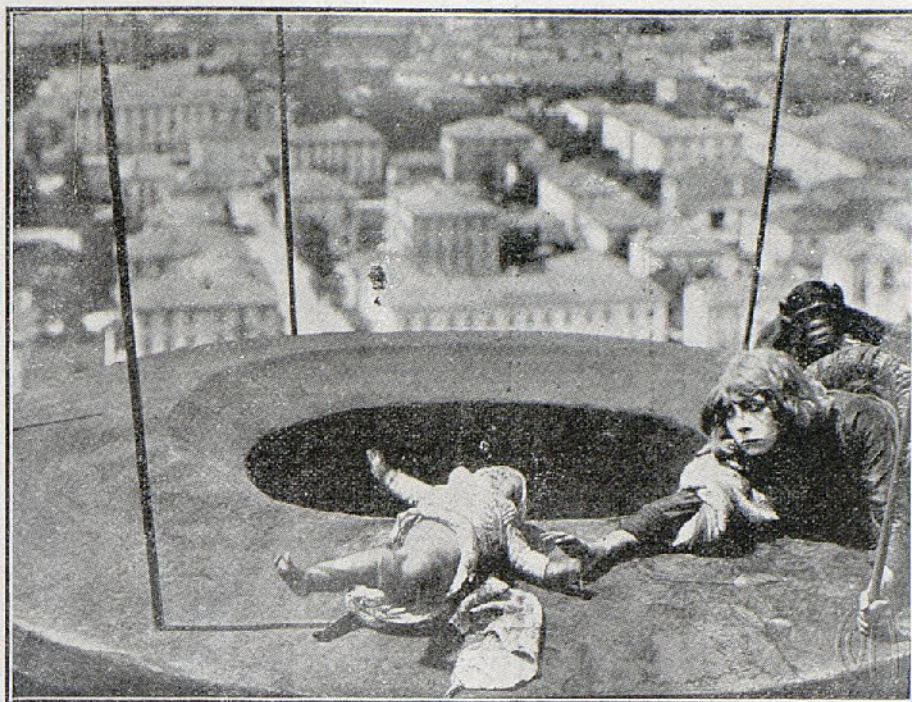
El Circo de la muerte o la última representación de gala del Circo Wolfson

caban los bandidos a sus víctimas para a mansalva apoderarse de sus riquísimas joyas. Logrado su objeto, desaparecieron de la casa a toda velocidad en los autos que tenían preparados. Alaska vigilaba, y sin que Los Vampiros le apercibiesen, trepó sigilosamente a lo alto del auto que conducía al jefe de la banda. Ya en plena carretera, abrió las maletas que constituían el equipaje repletas de brillantes y oro. Logrado su botín, desapareció del coche sin que nadie se apercibiese ni se diese cuenta de lo que acababa de hacer.