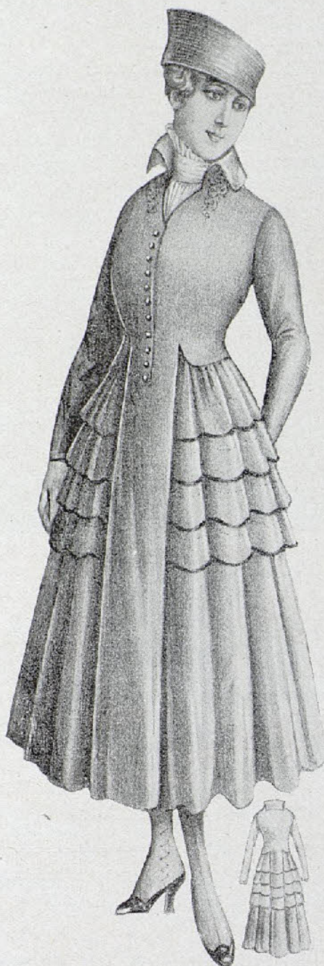
Traje muy sencillo, en gabardina. Falda fruncida, adornada la parte alta con volantes planos, ribeteados de satén. «Orpiño» ajustado, que se continúa formando pequeños tableros en la falda.