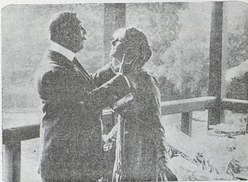
Una escena de la película «La niña perversa»

Reina gran interés por conocer la labor que han desarrollado ante la pantalla el emi-