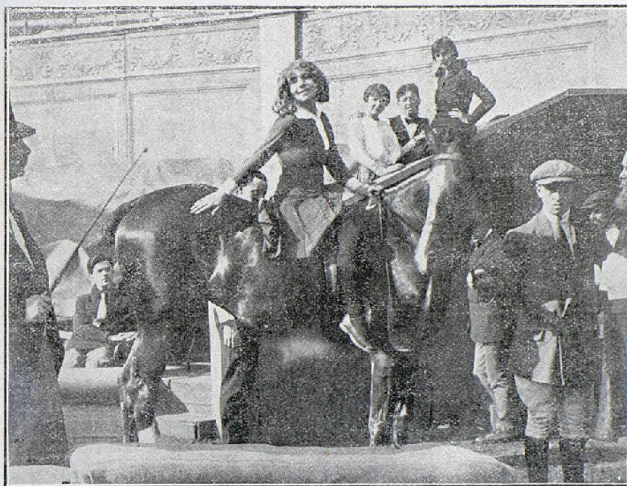
El Circo de la Muerte o La última representación de gala del Circo Wolfson

A las palabras que dirigió Guerande al atracista, supo por éste que el baúl había sido alquilado junto con unos trajes al barón de Mortesaigues, que habitaba un suntuoso hotel en una aristocrática avenida cercana. Con este