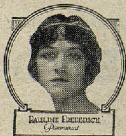
PAULINE FREDERICK Paramount