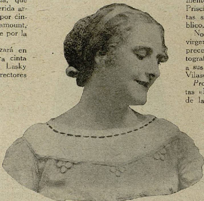
Henny Porten, del Programa Verdaguer

Seiscientos pacientes recibieron asistencia médica en los hospitales de la casa Paramount en el curso de tres meses. La manufactura de película resulta a veces tan peligrosa y es tal el número de personas que en ella toman parte, que la compañía de que hablamos decidió abrir una clínica en su estudio de Long Island, destinada a dar socorro inmediato a quienes lo necesitasen. La