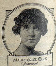
MARGUERITE CLARK Paramount