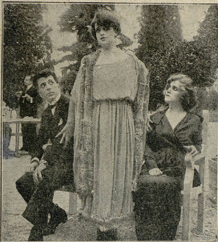
Una escena de la película «Hedda Gabler»

favor hacia Krogstad. Cuando la señorita Linden habla con el prestamista, este ya ha escrito a Torvaldo Helmar explicando todo y amenazándole con hacerlo público si no le vuelve a admitir en el Banco. El efecto que estas noticias causan a Helmar es desastroso. Se indigna contra su esposa y declara que es indigna de ser la madre de sus hijos. Ella quiere explicarle el motivo de su conducta, pero él no quiere oírlo. Su proceder es una revelación para Nora, quien se había figurado que al descubrirse su acción y las causas que la motivaron, no solamente la ha-