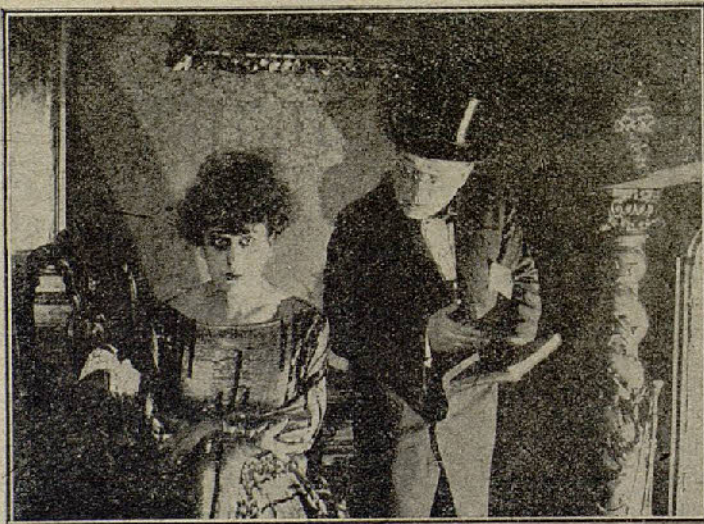
Una escena de la película «Hedda Gabler»

Dan un baile de máscaras al que Leila asiste vestida de Julieta y Sutphen, que lo sabe de antemano, se viste de Romeo. Porter, a ruegos de su esposa, se viste también de Romeo; pero hace un triste papel como el héroe del inmortal Shakespeare, mientras que Sutphen está excelente. Sutphen habla mucho con Leila, y finalmente le confiesa su amor, al que ella corresponde,