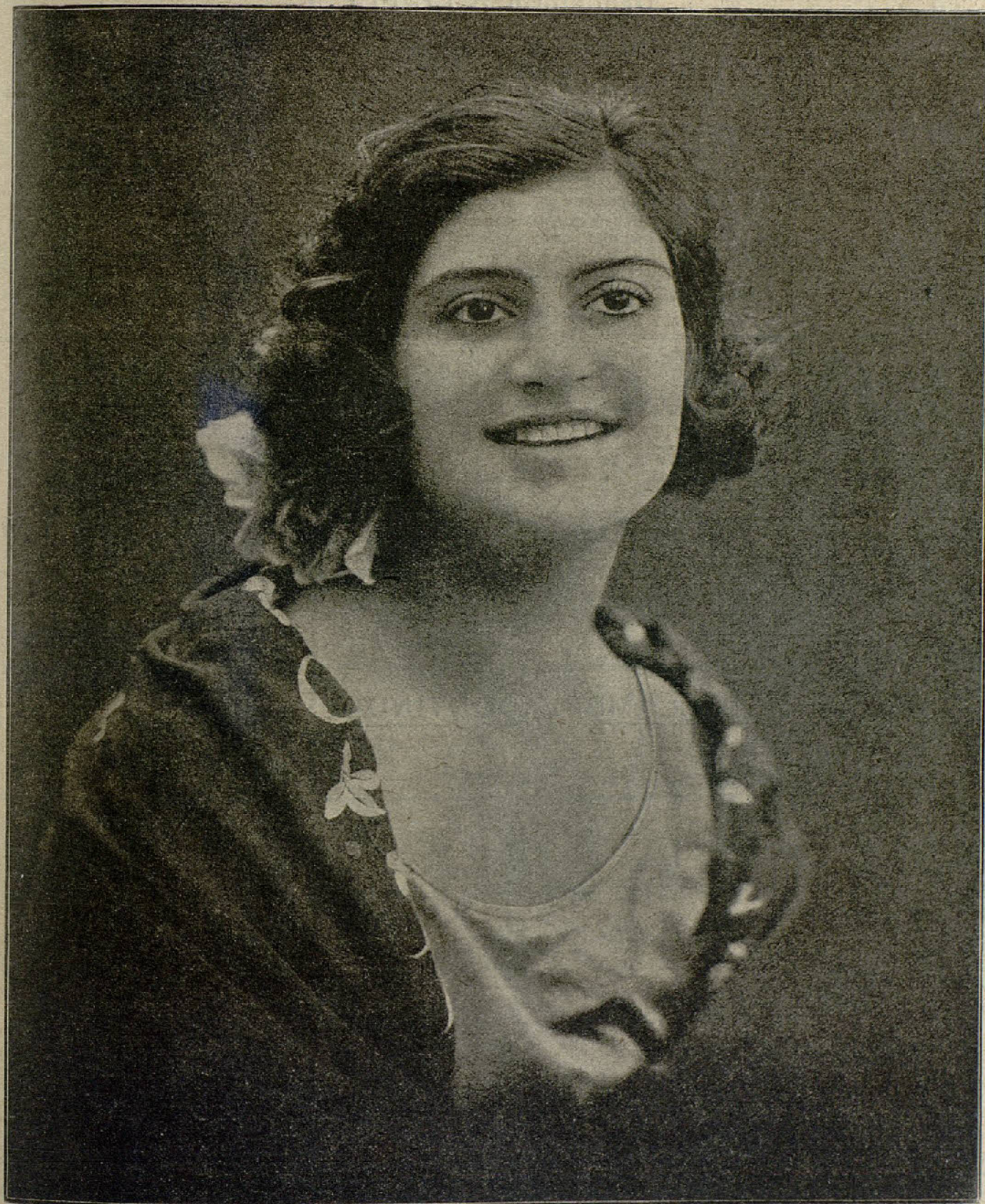
TINA DE JARQUE

bella cancionista que en su brillante tournée por provincias está obteniendo muchos aplausos