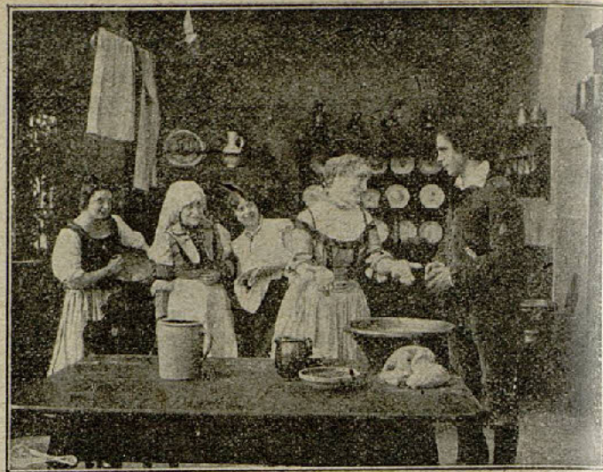
Dos escenas de la película «Madrigal de amor»

cia, donde los más apuestos galanes asediaban a la gentil cortesana, diciéndola, lisonjeros: