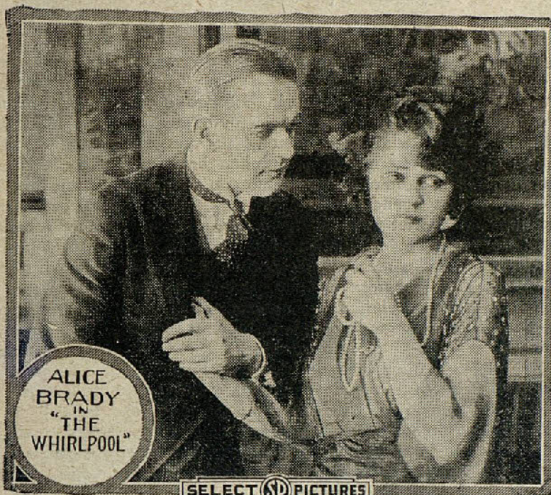
Una escena de la película «El Remolino»

A partir de aquel instante, buscó por todas partes el contagio, y cuando sintió invadido su organismo por los gérmenes del mal, encaminóse a Floren-