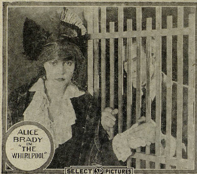
Una escena de la película «El remolino»

Marcela y Underwood se ven al fin libres de todos sus enemigos.