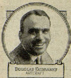
DOUGLAS FAIRBANKS, JR. ARTCRAFT

bría perdonado, sino que él se habría dado la culpa a sí mismo de todo. Ahora comprende que nunca conoció bien a su marido a pesar de los años que llevan de matrimonio.