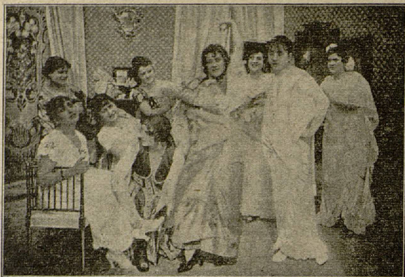
Una escena de la película «A la caza de los 45 millones»