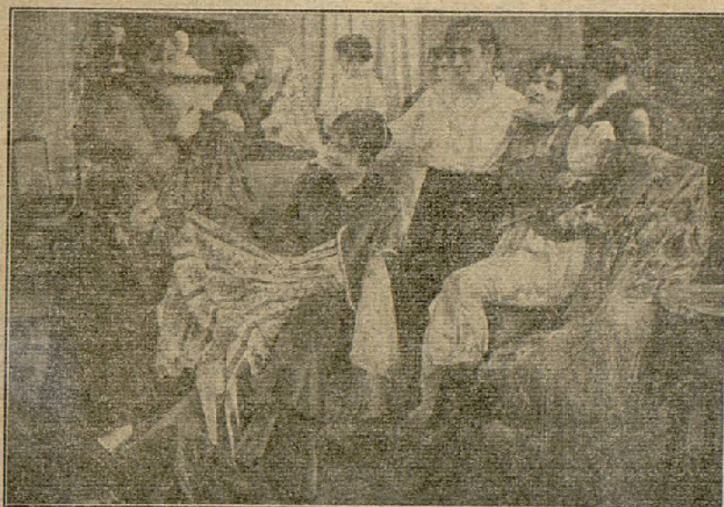
Una escena de la película «A la pesca de los 45 millones».

Ansiosamente espera Clarel que la joven desmienta lo que se anuncia en el periódico, pero una ligera inclinación de cabeza permite