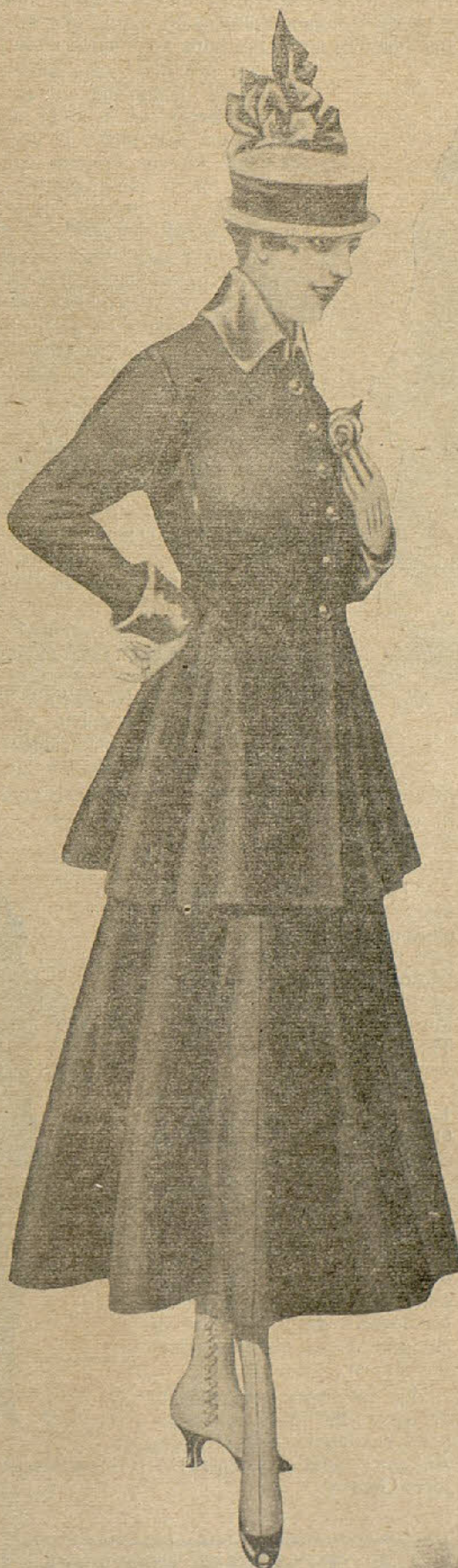
Traje de velardina verde. La falda es de media capa, y la chaqueta cerrada, de faldón acanalado, adornada de vivos de charol.

Se ha efectuado el gran festival organizado a beneficio de las víctimas del naufragio del «Príncipe de Asturias».