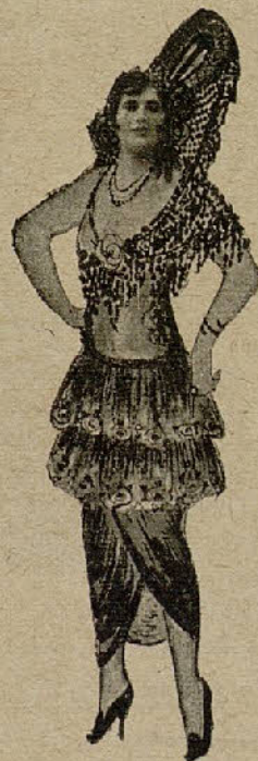
Paquita Siolla hermosa cancionista

Después de una brillante tourneé por Manila que ha durado seis meses, ha llegado a esta capital la conocida y queridísima artista Enriqueta C. Birba, la cual muéstrase muy satisfecha de sus éxitos alcanzados en América. Sea bienvenida.