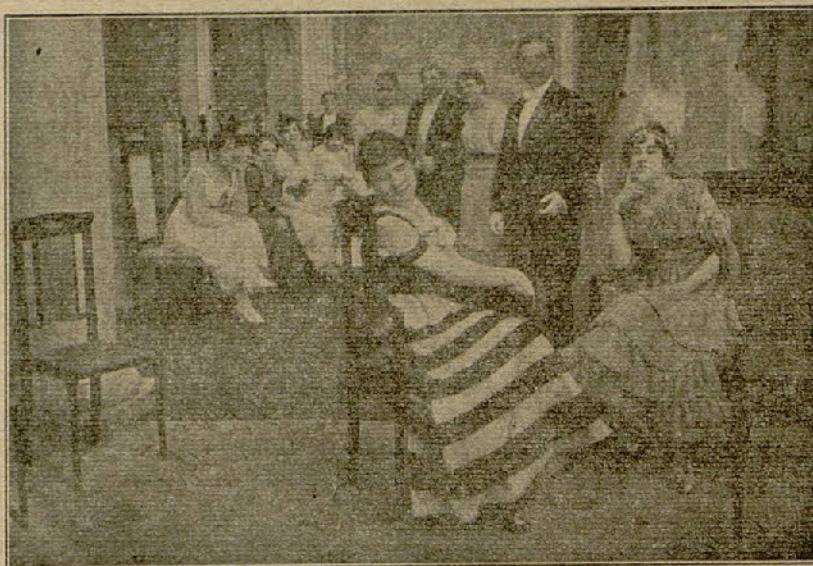
«A la pesca de 45 millones»

El señor Raimundo tiene el raro privilegio de poseer diez hijas casaderas, que tropiezan con el natural inconveniente de encontrar diez maridos, cosa a todas luces absolutamente imposible en los actuales... y en los pasados tiempos. Estas dificultades para hallar diez candidatos al matrimonio aumentan un día en que, por la subida al poder del ilustre conde