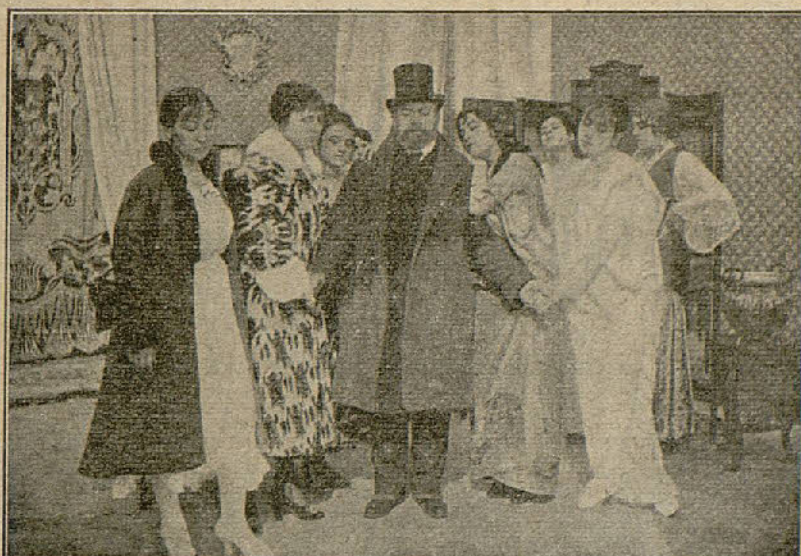
Una escena de la película «A la caza de los 45 millones»