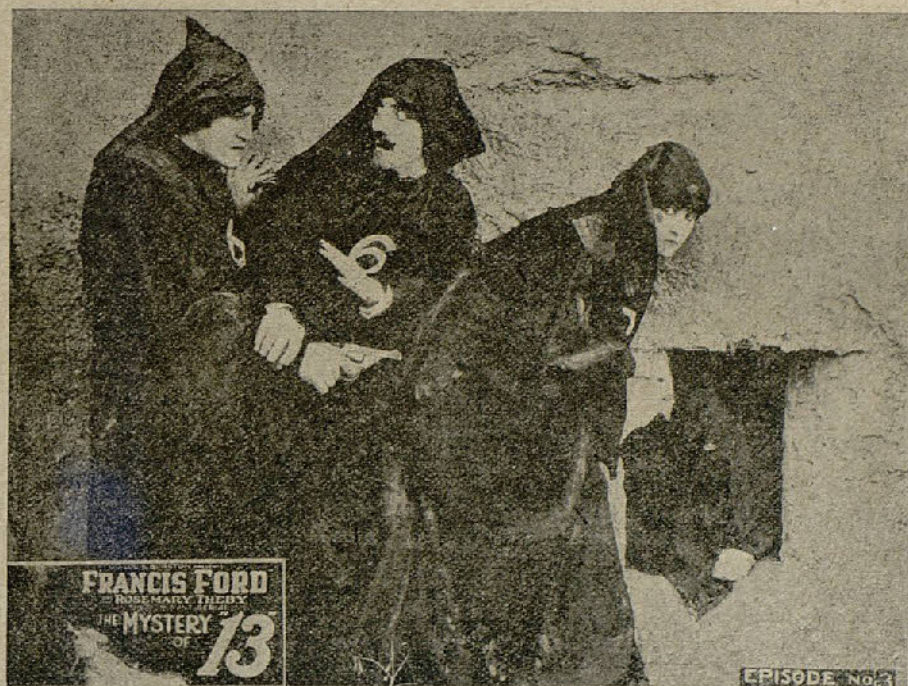
Una escena de la película «El misterio de los 13»