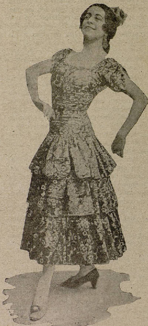
LA ARGENTINA que ha hecho una brillante campaña en el Teatro Lara

cia; con verdadera gracia, que es lo que debe exigirse al género. Se pasa un rato divertido; se ríe uno mucho, y luego no tiene uno que indignarse de haberse reído, porque nada hay que atente al arte, ni al idioma, ni al respeto que se debe al público y a los mismos artistas. En menos palabras: nada hay que pueda confundirse con el as-