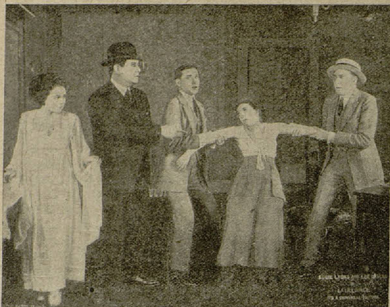
Una escena de la película «Divorcio de Lucile»

vengadoras, cuantos obstáculos vivientes se oponían a su avance, Hugo perseguía al lobo hasta su guarida. Y entró en el local de la asamblea bajo su disfraz de jefe supremo, convencido de que no corría peligro alguno, por ser el silencio consigna de la secta.