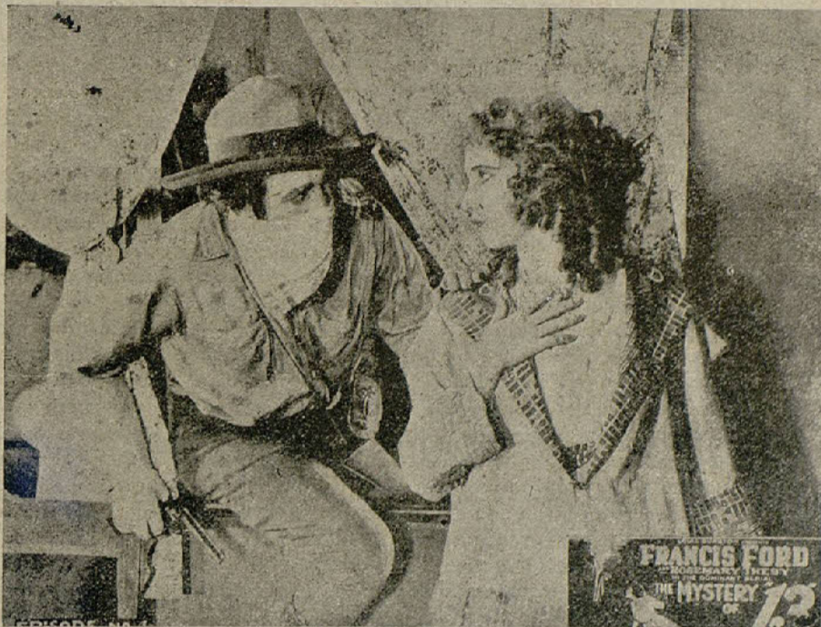
Una escena de la película «El misterio de los 13»

Burlando, con el auxilio de Rosa Lafin, a varios números que preparaban su muerte, Hugo corrió a casa de Greer para convencerse de si era un hecho real la prisión de Mariana o sólo una alucinación del pobre loco. Y partió, con la túnica del número trece bajo el brazo, hacia los sótanos de Riley, mientras sus amigos reclamaban el auxilio de la policía. Marcando con flechas el sendero a sus auxiliares, arrollando, implacable en sus ansias