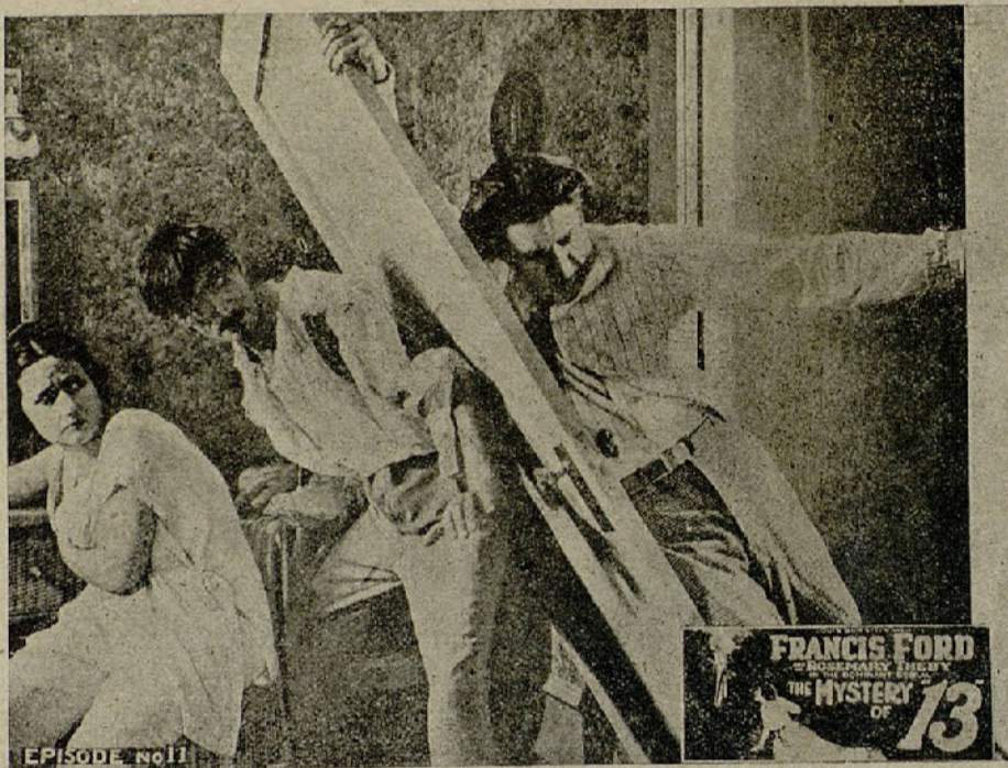
Una escena de la película «El misterio de los 13»

Inerme contra el mal. — Hugo y Mariana mirábanse, mudos de estupefacción; cada uno de ellos se creía engañado por el otro, sin que ninguno se atreviese a pronunciar la frase acusadora. Y se separaron, jurándose haber perdido mutuamente la fe. Mariana montó en el auto para volver a su casa; sospechando que, cogida al coche, iba Rosa Lafin, que la seguía por orden de Hugo, hizo un viraje tan rápido, que lanzó a la muchacha contra el suelo; pero ésta pudo comprobar que Mariana se dirigía a su casa y que Mádiz iba en su persecución, y así se lo