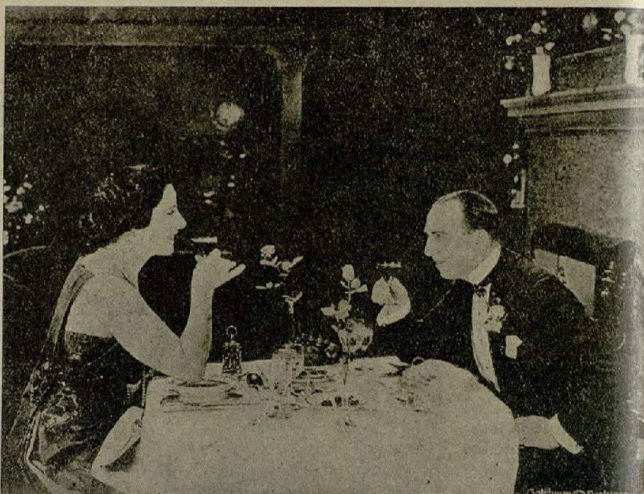
Una escena de la película «Giro de la rueda»

él; el «13», nombre de la siniestra asociación, y el «6», número del asesino de su hermano Jaime. Libre por un momento de su irreductible rival, corrió Hugo al piso superior, donde aún su pupila Rosa se defendía bravamente de los ataques de Rafael Greer, y la libró del monstruo de lascivia, en tanto que Ferron arrancaba el plano de manos de Mariana; pero no mucho después, una sorpresa de los enmascara-