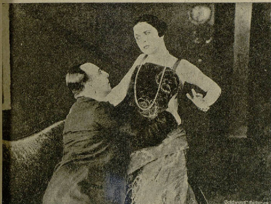
Una escena de la película «Giro de la rueda»

Agua y fuego. — «Los Trece» golpearon, hasta derribarla, la puerta del subterráneo en que Hugo se había re-