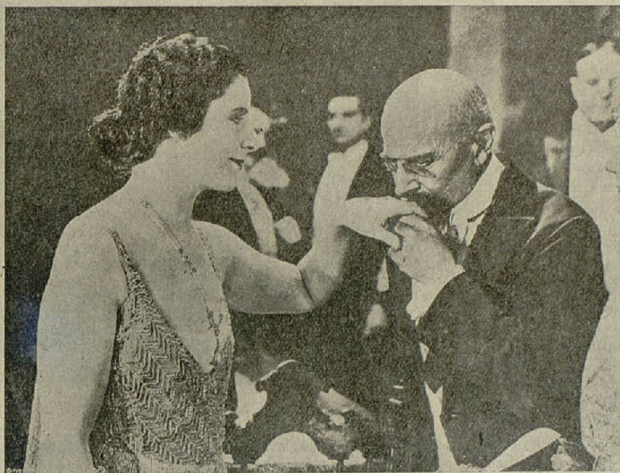
Una escena de la película «Giro de la rueda»

bado un golpe de Tom, disparó contra éste, hiriéndole en una muñeca. La lucha se generalizó y el resultado de ella fué la ocupación por Elena del mapa, que estaba en poder de «El Rojo», y la huída de la muchacha por la ventana, a la que llegó cubriendo su cuerpo con el de Tom, para librarse del revólver de Warden, que apuntaba a su pecho.