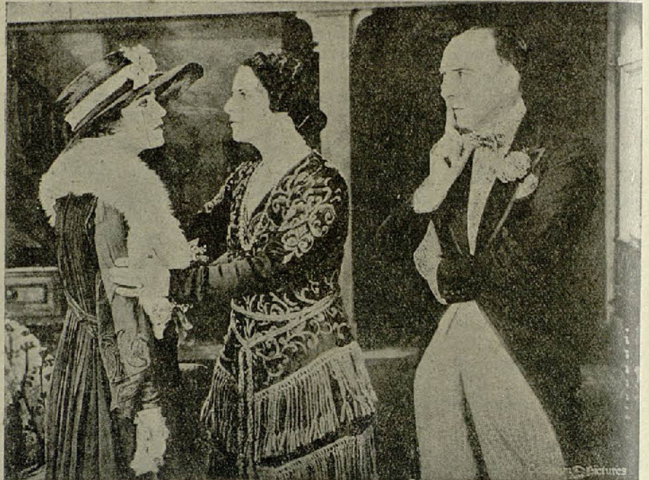
Una escena de la película «Giro de la rueda»

Y una semana más tarde, Elena y Tom, en compañía de «La Urraca», bogaban hacia el hogar tranquilo, sin ambiciones ni luchas, donde tendría un trono eterno, la alegría del amor.