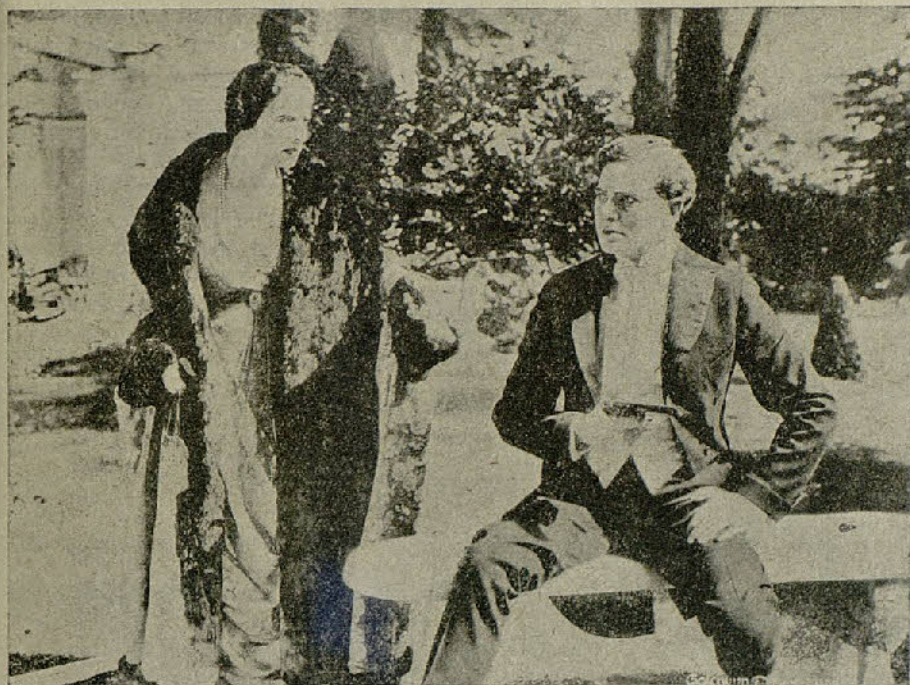
Una escena de la película «Giro de la rueda»

El hecho por testigos tuvo a Lillian y a Cora, las cuales por distintos caminos se topan y juntas corren para llegar a tiempo de salvar a Harry del terrible peligro y tras esfuerzos sobrehumanos lo consiguen. No obstante, el azar dispuso que los guardias fronterizos reconociesen en Harry al fugitivo que tanto les dió que hacer y comienza otra vez la persecución de aquel hombre bondadoso que tiene el prurito de no vindicarse ante la justicia. Antes de emprender la huida, de acuerdo con Cora pone a la madre de Lillian en brazos de su hija mientras Cora para salvar la huida de Harry pone en movimiento los motores de la aeronave, remontándose con la consiguiente estupefacción de los bandidos, Duval recrimina a Cora. Harry no titubea un momento en