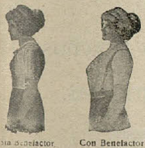
Sin Benefactor Con Benefactor

Para el desarrollo de pecho de las señoras, caballeros y niños : : Indispensable a toda persona que aprecie y practique la higiene en el vestir : : : Con el uso del Tirante-Benefactor, las señoras conseguirán el desarrollo de sus senos pudiendo prescindir así de medicinas y ungüentos perjudiciales muchas veces a la salud De venta en casa los Sres. Eduardo Schilling, S. en C. (Barcelona-Madrid-Valencia) y al fabricante de Ligas y Tirantes «Smart» AMADOR ALSINA Riera San Juan, 8 - BARCELONA que mandará folleto gratis a quien lo pida