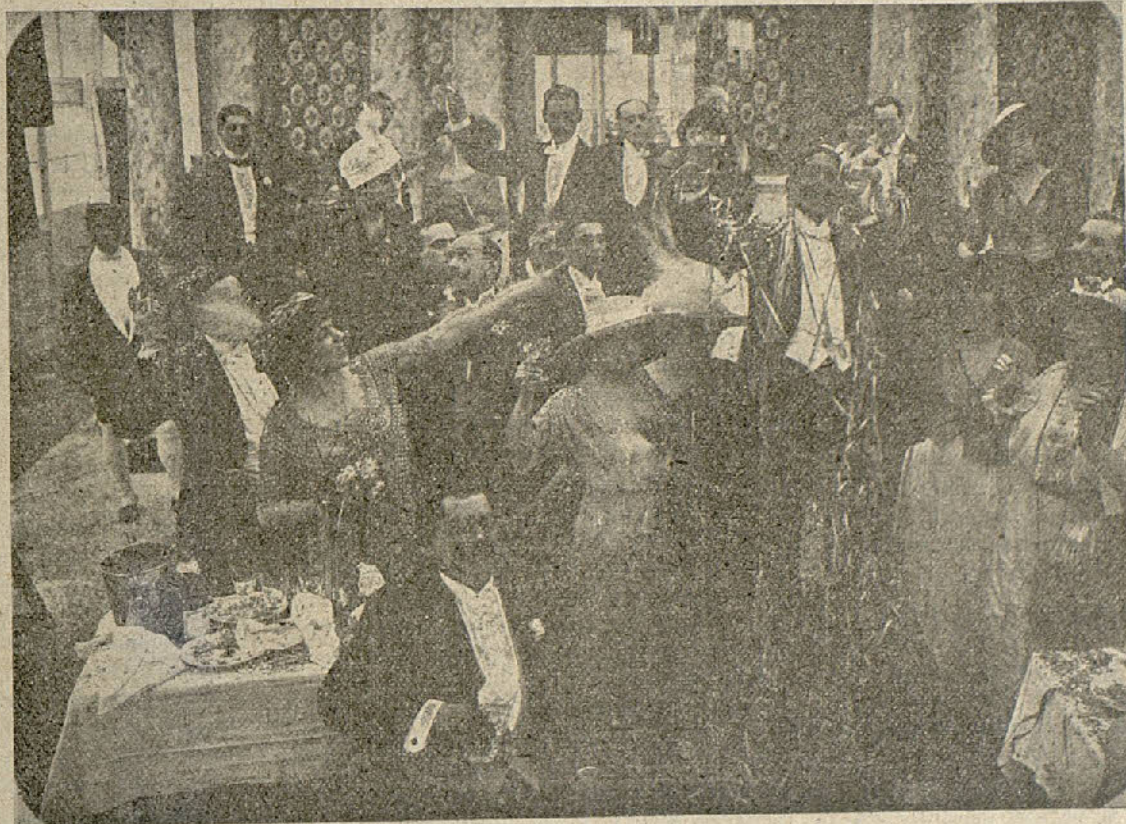
Una escena de la película «El Pollo Tejada»

A. P. P.-Diríjase a la casa Studio film.-Universidad 31; a ver que pasa.