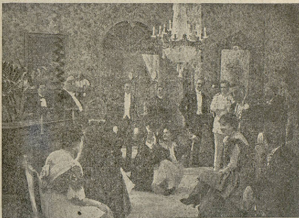
Una escena de la película "Prueba Trágica"