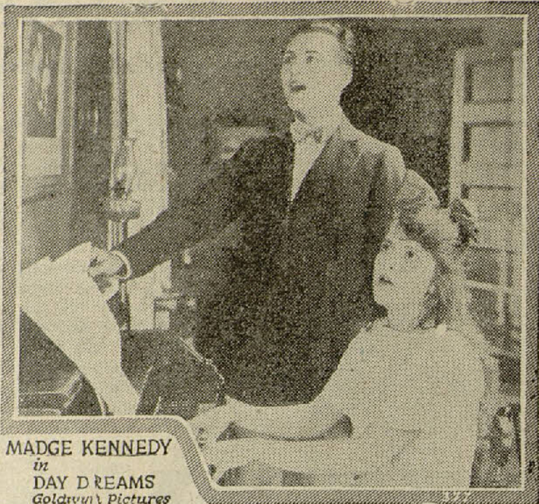
MADGE KENNEDY in DAY DREAMS Goldwyn Pictures

Una escena de la película «Sueños de juventud»