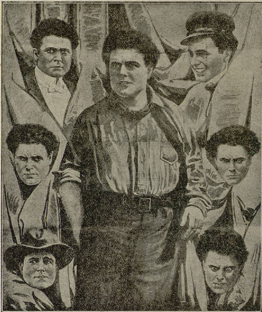
WILLIAM FARNUM Protagonista de «Los Miserables»

Julio César. — «Cual de las dos», graciosa comedia de la casa Christie, «El jinete fantasma», hermoso drama de 1.500 metros, y «El marido de su viuda», interesante y graciosa comedia.