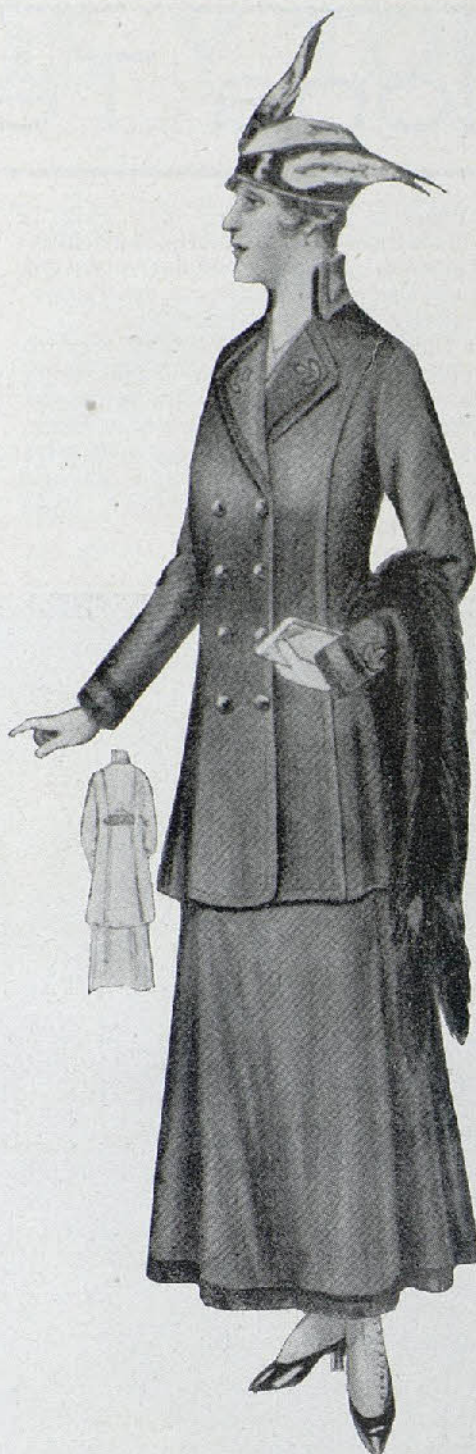
Tailleur azul. Falda acampanada, chaqueta de tableros, cruzada; y adornos de trenilla negra.

Al final de la obra, el público en pie tribu-