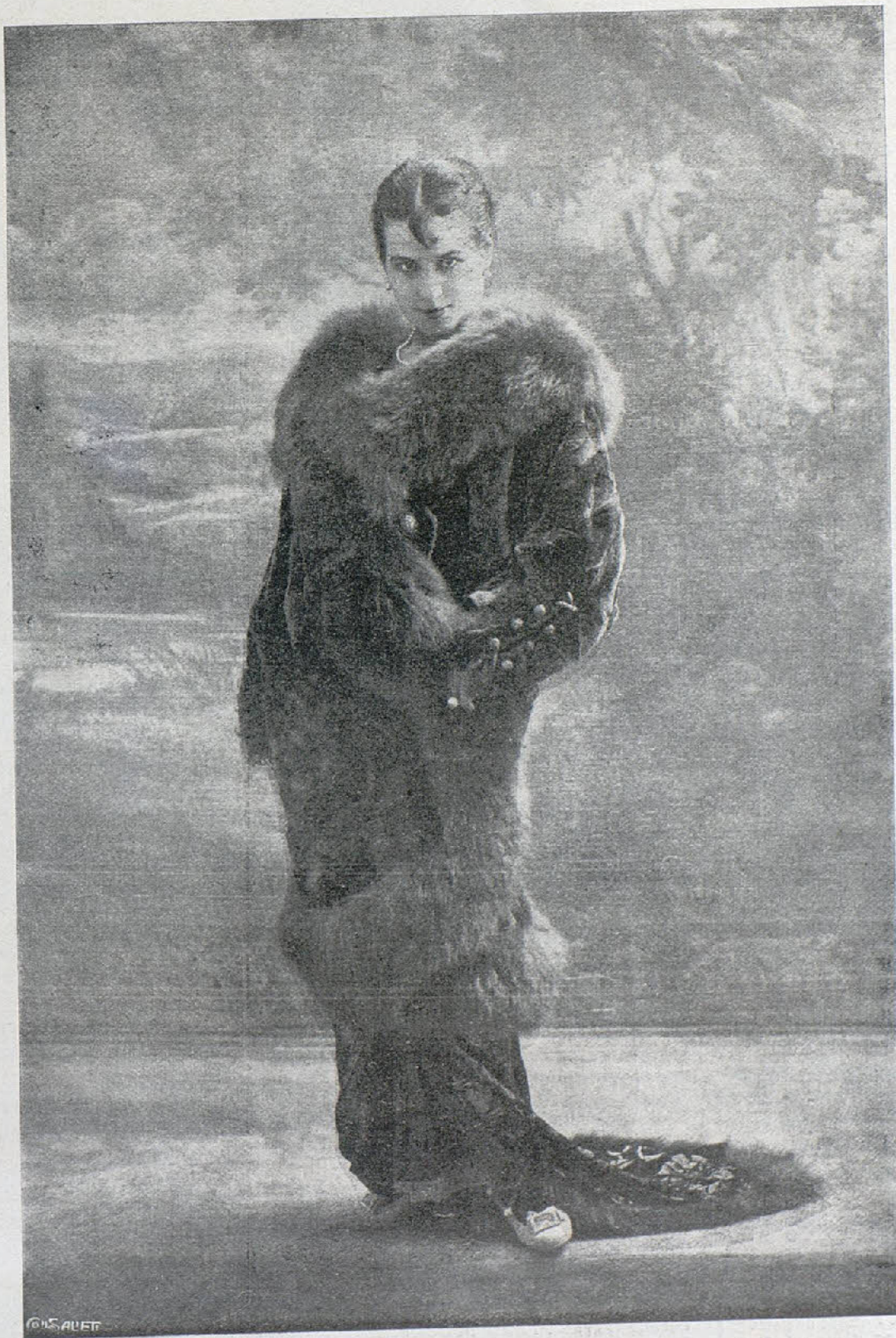
La célebre danzarina Tórtola Valencia en una Creación de la Peletería «La Siberia»

El reino de Dios — Así se titula la nueva obra de Martínez Sierra estrenada en Novedades, la que impresionó al público, pues en ella el autor, discretamente revela las miserias sociales, verdades amargas. La elegía se compone de tres cuadros: un asilo de ancianos, una casa de maternidad y un asilo de expósitos. En todos ellos la acción es profundamente real. El espectador, siente la desdicha de los pobres desgraciados que