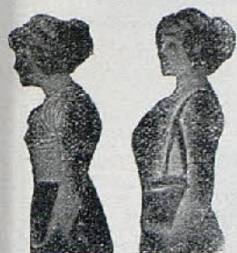
Sin Benefactor Con Benefactor

Contiene además el retrato del autor y el de las artistas que han hecho célebre este genero de MUSICA POPULAR que EL CINE vende por 2 reales en toda España