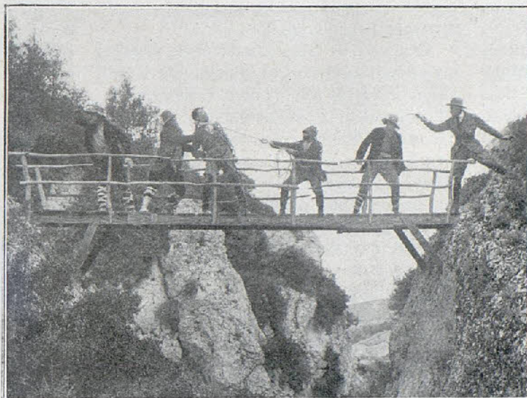
Una escena interesante de la película «Hernán el aventurero»