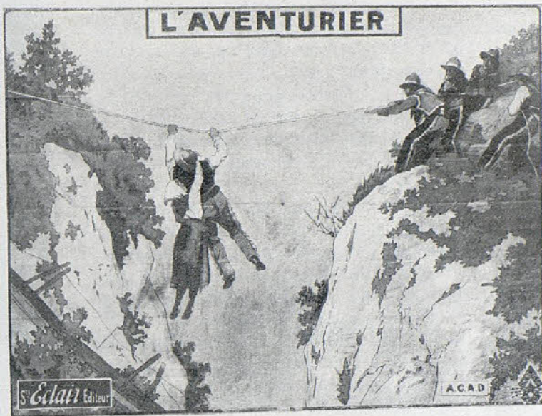
Una escena de la película «Hernán el aventurero»

«Esposa en la muerte», es una de estas películas que se nos presentan de tarde en tarde; el derroche de lujo y fastuosidad con que se ha presentado esta cinta, es digna de alabanza; en la dirección escénica Emilio Ghione se ha revelado como un gran artista que merece toda clase de felicitaciones por