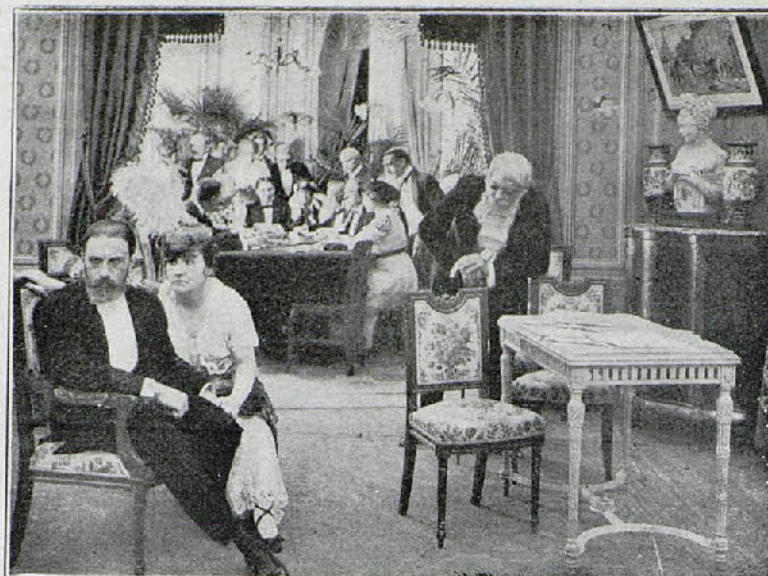
Dos interesantes escenas de la película «Hernán el aventurero»