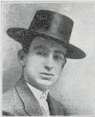
José Gómez, «Gallito»

Cuando apareció el menor de los Gallos en el palenque taurino, nos asombró a todos por su sabiduría y su dominio de los toros. Poco a poco ese dominio fué tan excepcional, que lo absorbió todo y resultó excesivo, pues el diestro aprendió demasiado y su toreo llegó a tildarse de ventajista. Y no sin razón. Joselito no se preocupaba más al torear que de dominar al toro, por buenas o por malas artes. Su afición desmedida, sus asombrosos conocimientos y facultades, le emborrachaban cuando se liaba con el toro en pelea rápida, rotunda y eficaz para los fines de su propósito: dominar.