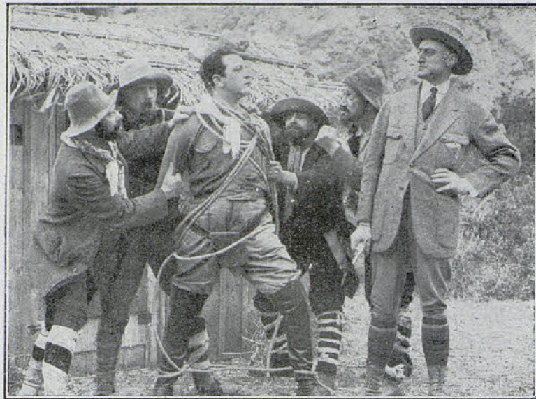
Dos escenas interesantes de la película «Hernán el aventurero»