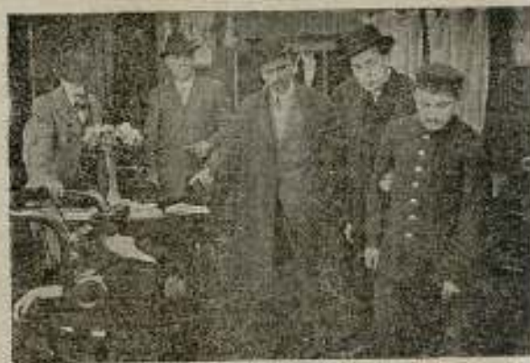
«La fuerza del bien»

En el presidio se capta, por su buen comportamiento y dulce carácter, la estimación de sus superiores, que le distinguen de todos los demás presos. Al cabo de muchos años de estar sufriendo la condena, ve un día ingresar al Rufo, quien por fin ha sido cogido en una de sus fechorías; ante la presencia de Espín, el Rufo se turba y procura rehuir su compañía. Una noche el Rufo lima los hierros de una ventana para escapar, en cuya operación le sorprende Juan Espín, reprochándole su pro-