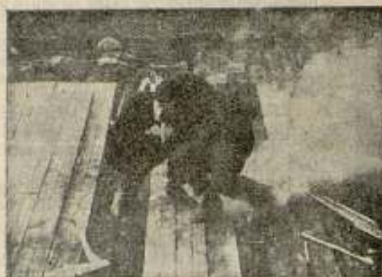
«La fuerza del bien»