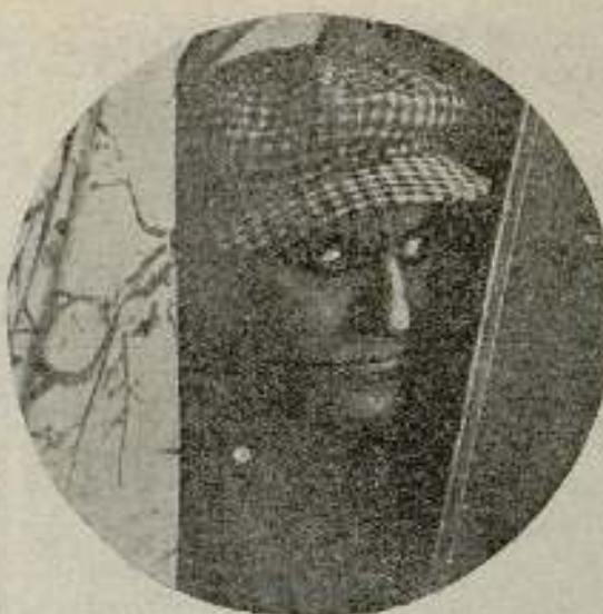
La fuerza del bien

do de nuevo acto deshonoroso alguno, ya que en tal caso la fortuna pasaría a favor de la esposa de Gleason. Por los términos en que está redactado el testamento, Gleason comprende que Arnold entrará en posesión de la herencia, y sumamente contrariado abandona el despacho en el mismo instante en que Arnold sale de la casa. La mente ingeniosa de Gleason le hace concebir inmediatamente el proyecto de acusar a Arnold de haber intentado el robo de la caja de caudales: pone en práctica su idea y le ayuda en su falsa acusación el encontrar en poder de Arnold el medallón que la regalara su sobrina como recuerdo. Al verse acusado Arnold tan de repente y comprendiendo la aparente evidencia de las circunstancias, huye