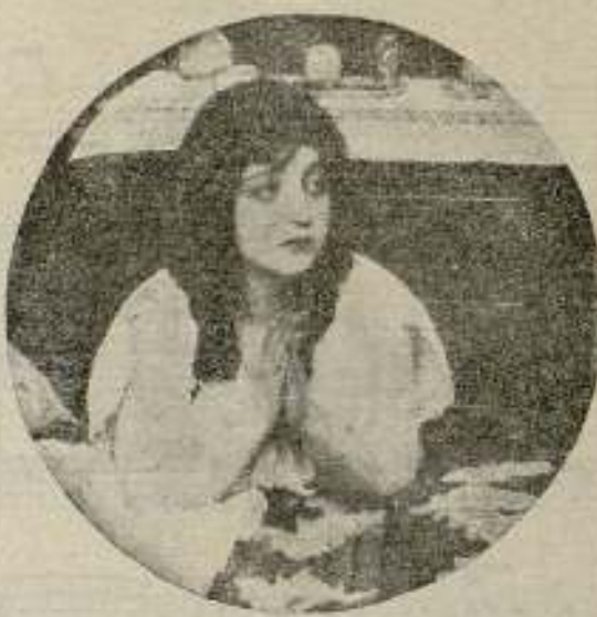
«La fuerza del bien»

CUARTO DE PROYECCIÓN. — El cuarto de proyecciones debe estar lo más separado posible de la sala en que está la pantalla, por varias razones: Primera, los espectadores deben estar en una cámara oscura, para que no vean más luz que la reflejada en la pantalla. El operador, en cambio, necesita mucha luz para cuidar su trabajo; segunda, la prudencia exige