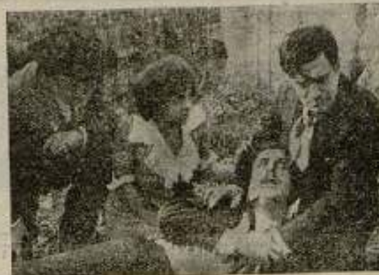
«La fuerza del bien»

Alberto, acurrucado junto al hogar tembloroso, agitado por horribles remordimientos, recuerda su pasado maldito, cuando de pronto un grito estremecedor le hace levantar con sobresalto. Algo así como un espectro, el fantasma de una imagen inolvidable, aparece a sus ojos dilatados por espanto. Es ella, Caridad, la infeliz loca que ha descendido de la sierra, impelida por la extraña agitación que la tempestad produce en ella. La desdichada mira a Alberto con estupor, primero, con fijeza después y en un fugitivo momento de suprema