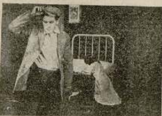
La fuerza del bien