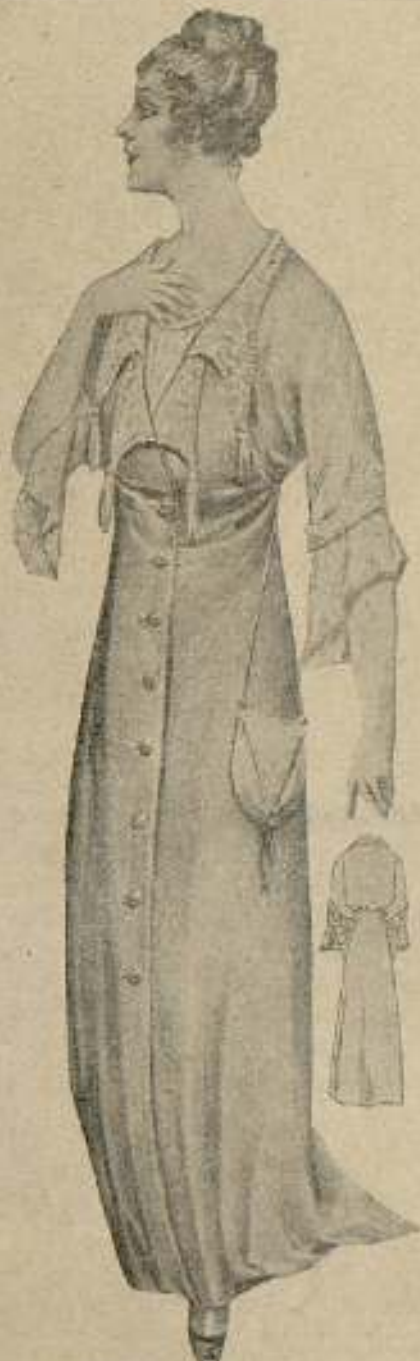
Elegante bata verde esmeralda, con ligero fruncido que recoge la espalda. Volumen de mangas, y cuello y solapas de encaje con borlas y botones de cristal mate.

Carmen, 42 y Dr. Dou, 1 MANTAS de lana y algodón