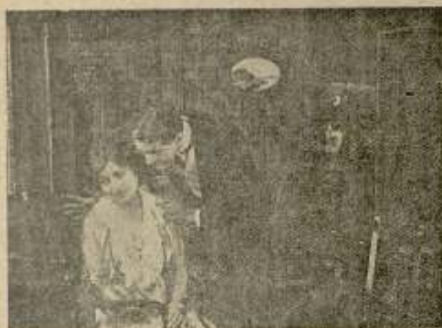
Las horas de Londres