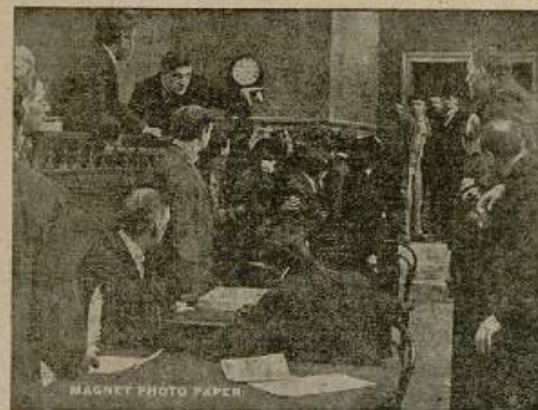
Una escena de la película «Las locas de Londres».