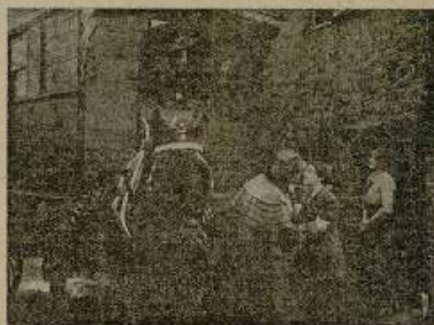
Las horas de Londres

Rosita fué dichosa a partir de aquel momento y esperando el momento de poder abrazar nuevamente a su amado, partió más alegre que de costumbre a sus campestres quehaceres. En una de las revueltas del solitario camino, apareciósele el barón de Randal que atajóla en su ruta, haciéndole infinidad de galantes proposiciones. Era desierto el lugar y la fuerza del hombre, privaba sobre la debilidad de la mujer, que acudió, como último remedio, a la astucia. Pingió quizás acceder a las demandas del petimetre, llegando a convencerle fuese con ella hasta la casa. Siguióla el barón, satisfecho de poder llevar a cabo tan felizmente su aventura, pero cuando estaban ya cerca, corrió la niña a refugiarse en los brazos de su abuelo a quien explicó la infame conducta del castellano. El anciano, lívido de cólera, volvióse hacia el joven que le mira con aire insolente y le escupió en la cara, su conducta malvada. —El que ultraja a las mujeres cuando los hombres de su edad están ausentes es un miserable, un cobarde, indigno hasta de estar en la pocilga de mi casa. Váyase V. de mi presencia, villano.