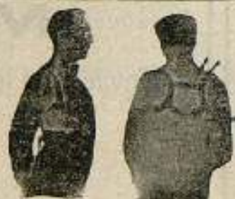
El Benefactor. El Benefactor de espalda

Riera San Juan, 8 - BARCELONA que mandará folleto gratis a quien lo pida