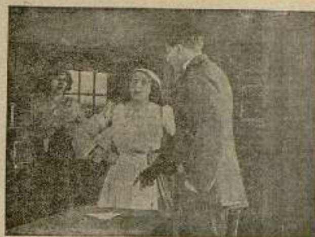
Las liras de Londres

La sorpresa paralizó a los conspiradores que fueron inmediatamente detenidos; sin poder sin embargo evitar que Thibaut al verse tra-