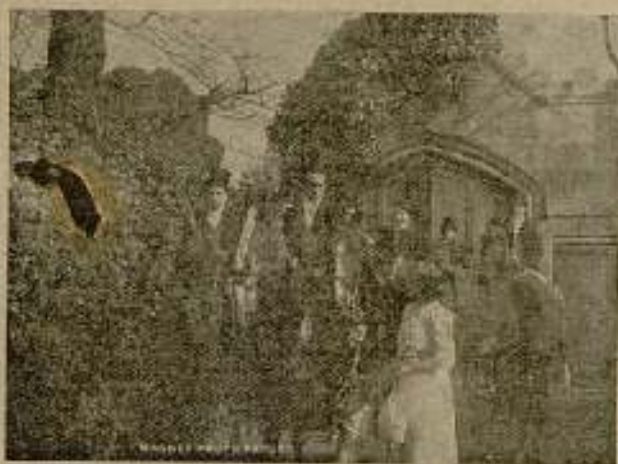
Los Jués de Londres (Tolosa y Trias)