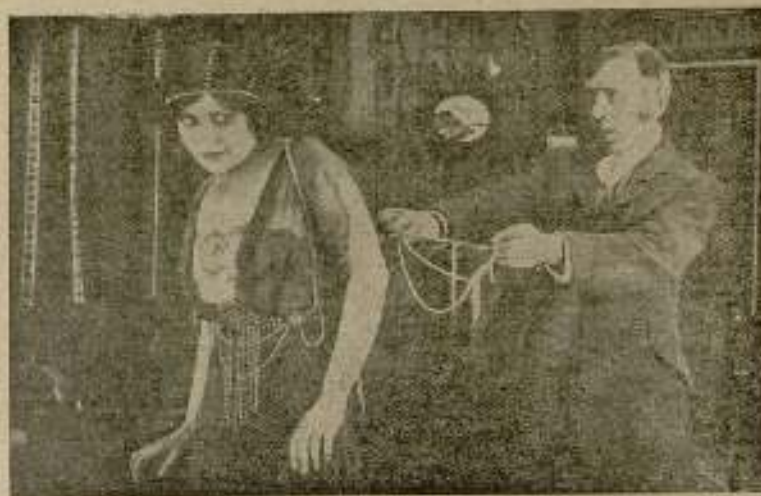
Una escena de «Las luces de Londres».