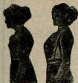
El Benefactor. El Benefactor

Para los envíos por correo se ha de acompañar al importe 25 céntimos para el certificado