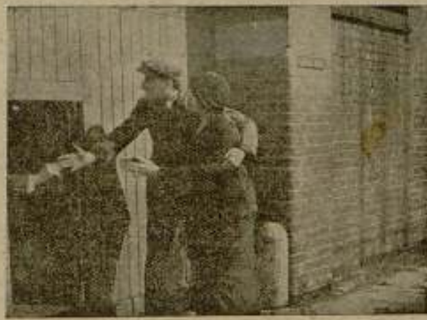
Las lucas de Londres