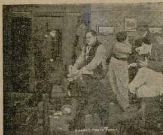
Las liras de Londres