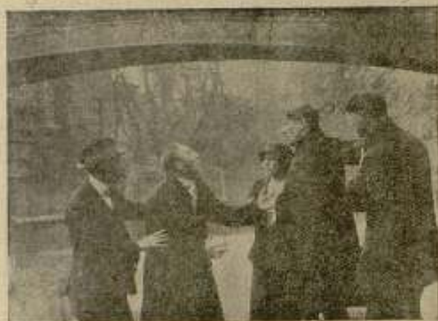
Las lucas de Londres