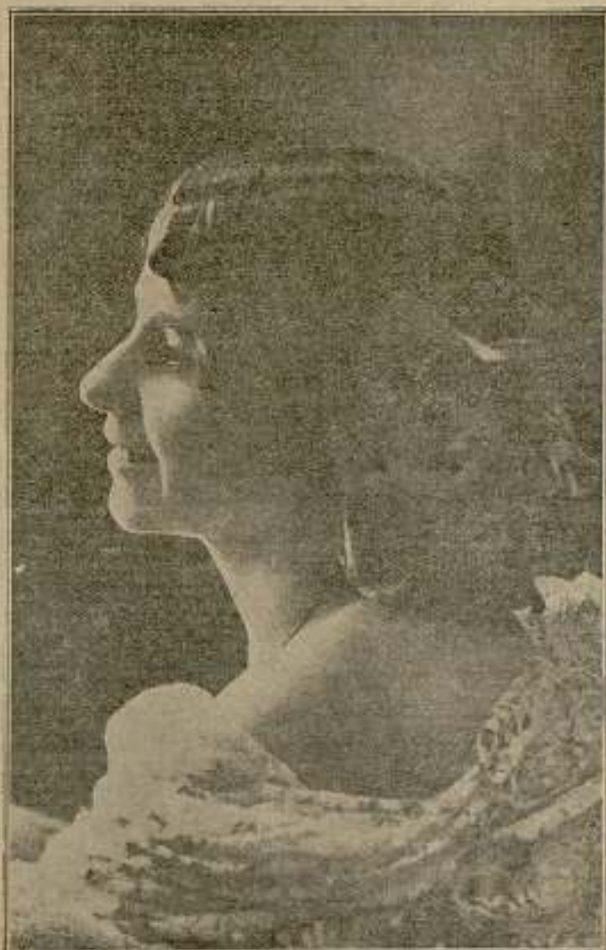
La Muralantea, hermosa bailarina que está alcanzando grandes éxitos

Debutaron los Aygel-Hurlurs, que, como siempre, fueron aclamados.