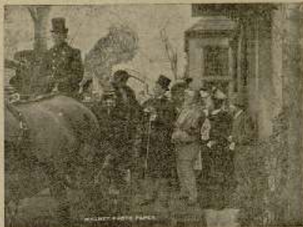
Las lucas de Londres

Estas palabras fueron repetidas por los heraldos, y de pronto hizose un gran silencio.