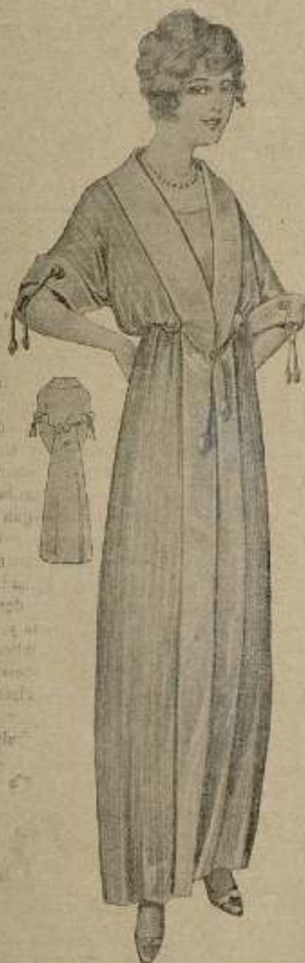
Bata de todo día, ligera. Tiene la blusa suya y se cierra en la cintura. En los bordes lleva anchos flecos lisos.

sola de cobre sin estaniar; eche un vaso de agua hirviendo, cuatrocientos gramos de azúcar, un pedacito de canela, deje que tome punto de cera, bata diez y ocho yemas y una clara durante dos minutos; eche de golpe en el almidar y de un solo movimiento, dele inmediatamente cuatro o cinco vueltas con el batidor para mezclar el almidar con las yemas, deje un momento sobre el fuego hasta que empiece a quemarse, tape, ponga en el horno durante un cuarto de hora, vuelque en un plato, salpique con grajeras y sirva frío; es ligero y excelente postre.