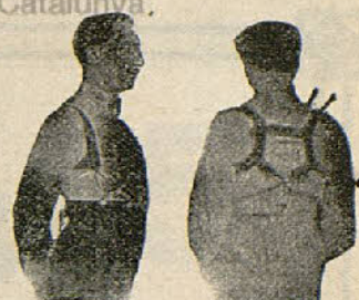
Con Benefactor El Benefactor de espalda

Riera San Juan, 8 - BARCELONA que mandará folleto gratis a quien lo pida