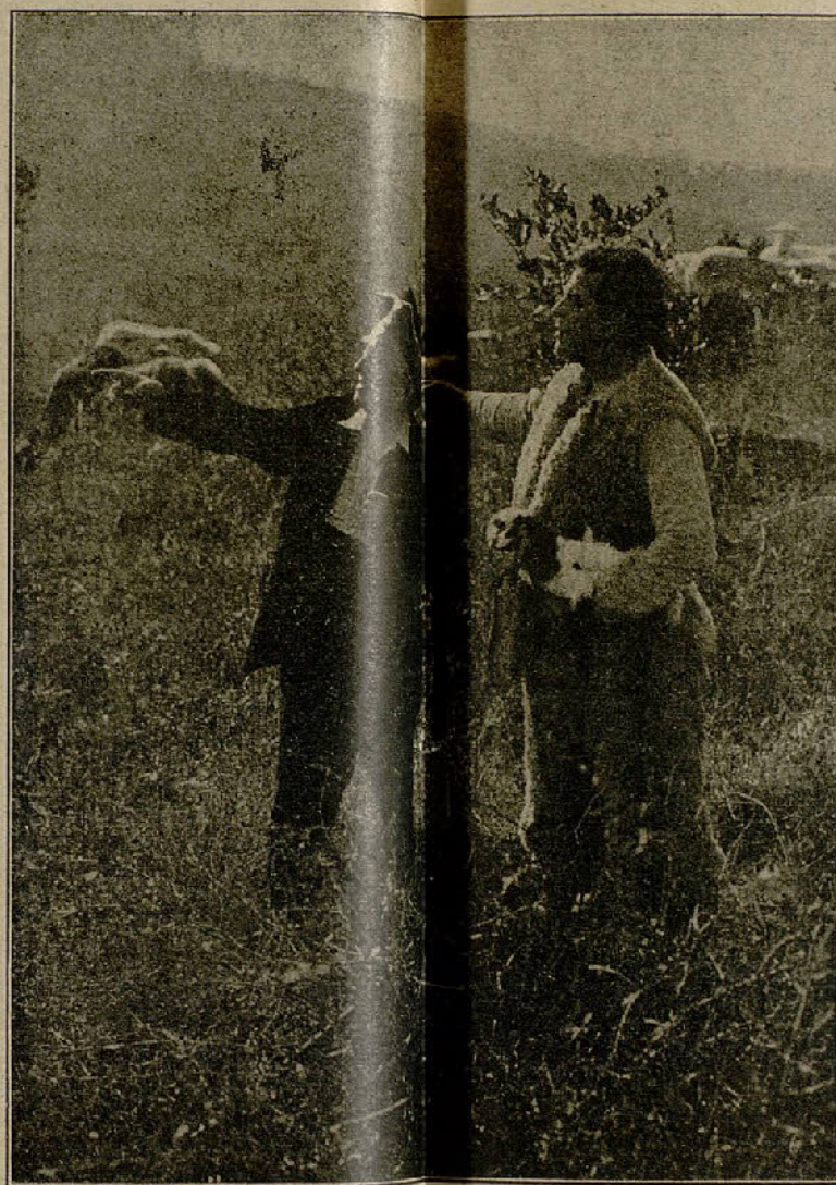
Una escena de Tierra Baja , según el drama de Angel Guimerá

Su cariñosa esposa acude y trata de calmarle, pero él fatalmente trata de repetir los actos de su padre y después de maltratar a su esposa huye y errante por calles y campos da con la costa brava y se tira por un precipicio.