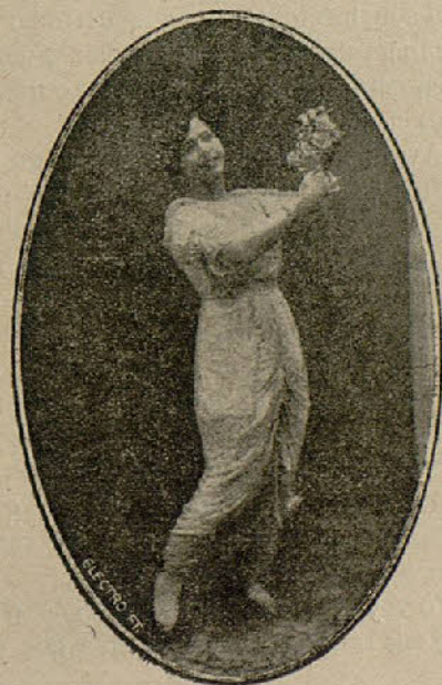
Elvira Ferrero, celebrada canzonetista