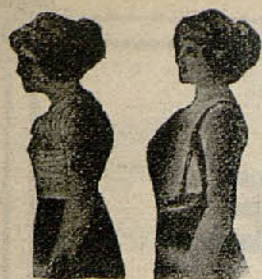
Sin Benefactor Con Benefactor