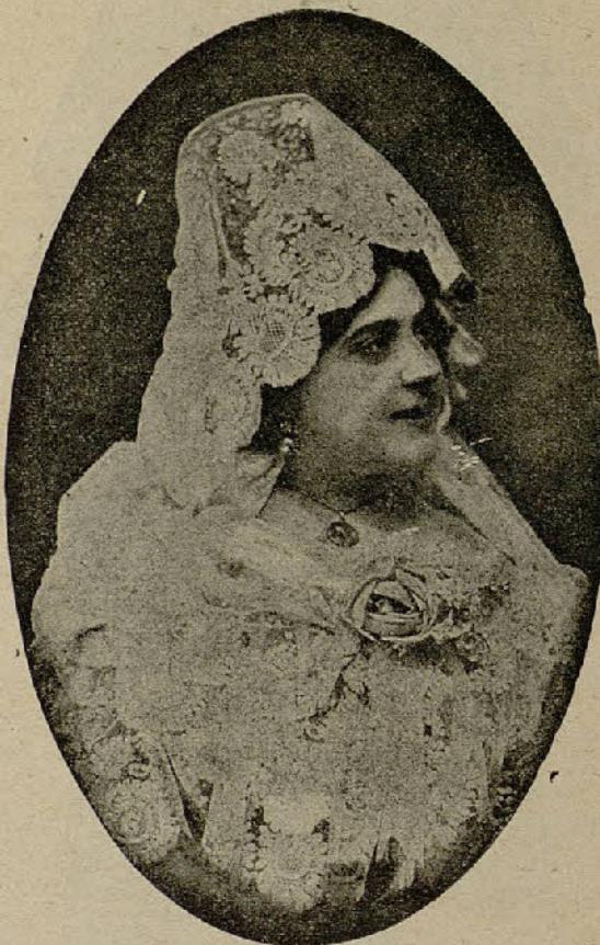
Conchita Muñoz Bella y notable cupletista española

«La tierra de promisión», es el Canadá, a donde