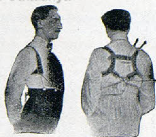
Con Benefactor El Benefactor de espalda

Riera San Juan, 8 - BARCELONA que mandará folleto gratis a quien lo pida