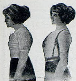
Sin Benefactor Con Benefactor