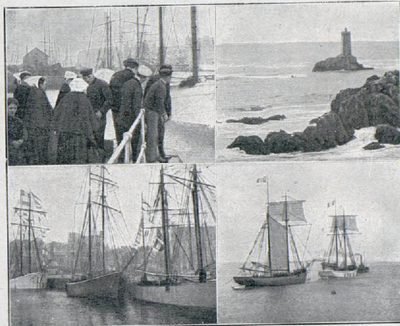
Una escena de «Paimpol»

Al día siguiente la desleal doncella da la