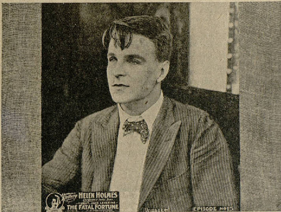
Una escena de la película «Fortuna fatal»

Misterioso salvador. — Si la era de los terrores comienza para el falso Duque de Villarés, temeroso del siniestro