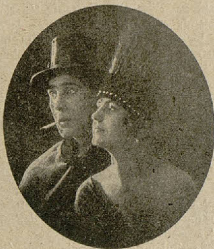
El afamado dueto LOS BERIFREI, que tras una brillante tournee por provincias, han reaparecido en Barcelona con notable éxito.

ritono Carbonell y otros conocidos de nuestro público ventajosamente. Circunstancias imprevistas y para nosotros desconocidas demoraron la presentación de esta compañía hasta el sábado y el debut les fué adverso. Maruxa se volvió contra ellos y no pudieron con la «égloga». La actuación de la compañía va a ser muy breve.