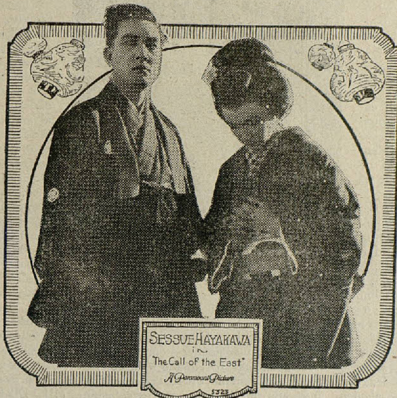
Una escena de la película «Voz de Oriente»

Caprichito ha sido encerrado por su desnaturalizada madre en un castillo solitario, pero en un descuido de la an-