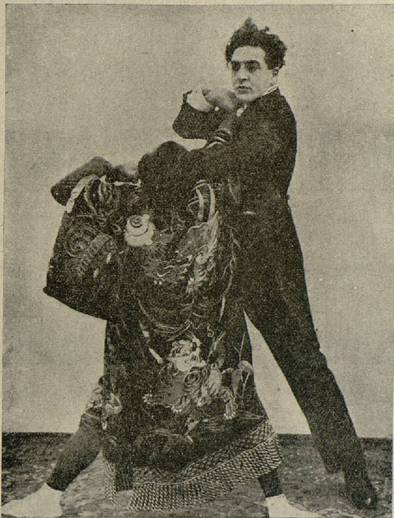
Una escena de la película «Noche infernal»

En medio del silencio más absoluto uno de los árabes dice: — Yo fuí quien se llevó a este niño oculto en mi chilaba y le he educado como a propio hijo... El nombre que lleva yo se lo he dado. Sí, El Hijo de la Noche es el niño que yo recogí junto a su madre muerta!