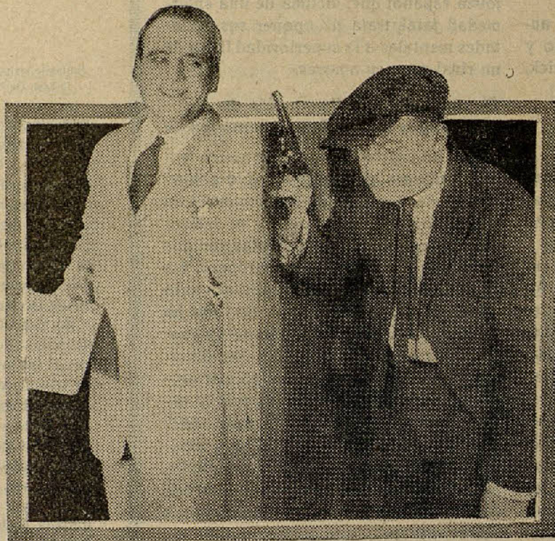
DOUGLAS FAIRBANKS in "A Modern Musketeer" 354 An ARTCRAFT Picture

Mientras tanto, los miembros de la pequeña banda de Hugo, tras de buscar infructuosamente a su jefe y amigo, con el cansancio en los cuerpos y el desaliento en los corazones, se refugiaron en unas cuevas. Hugo, al fin, halló en el subterráneo un sillar giratorio y salió al campo; los amigos tuvieron el placer de verle llegar alegre y triunfador. Sin embargo, "Los Trece" le perseguían; trepaban por la montaña, brotando de sus profundas quebraduras cual monstruos fantásticos. Rosa, perdida en las negras cavernas laberínticas, gritó en demanda de socorro. Su voz atrajo a los infames sectarios, que la hicieron prisionera, así como a Hugo, en ataque de traición. Rosa fué encerrada en una casita aislada, próxima a los muelles, y Hugo en la bodega de la casa del crimen. Y Mariana, sabiendo que ya no habría compasión para él, decidió salvarlo aunque en la empresa dejara la vida; a este fin volvió