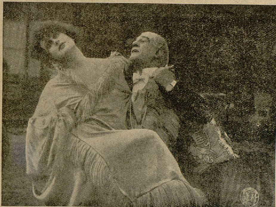
Una escena de la grandiosa película «Eva pecadora»

Perla, siempre atenta, no tarda en descubrir que el banquero está vivamente enamorado de una de sus invitadas, miss Wells. Perla la vigila, la espía y al fin se entera de que por la noche la joven