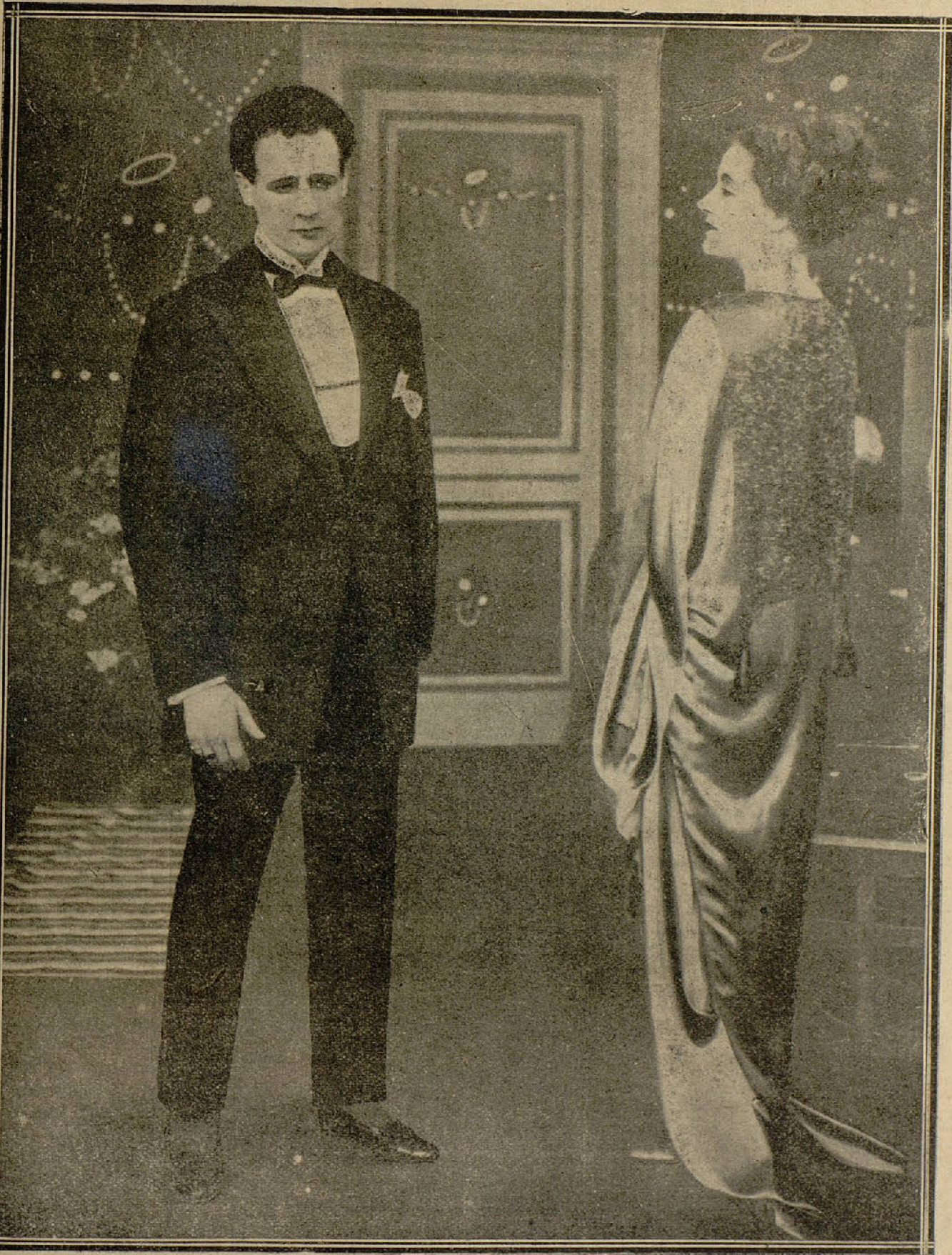
HESPERIA y TULLIO CARMINATI en una interesante escena de la película próxima a estrenarse, "La señora sin paz"