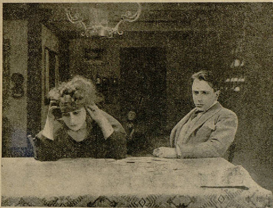
Una escena de la grandiosa película «Eva pecadora»

Darrow ha dado pruebas de valor en los campos de batalla de Lorena. Al presenciar los sufrimientos de sus soldados, brota en su corazón un grande amor por la Humanidad, y ha resuelto dedicarse al amparo de los oprimidos. Para conseguirlo, ha fundado el refugio Wil Braham donde se aceptan indistintamente a los niños abandonados y a todos los pobres. Casi siempre tiene éxito en su noble