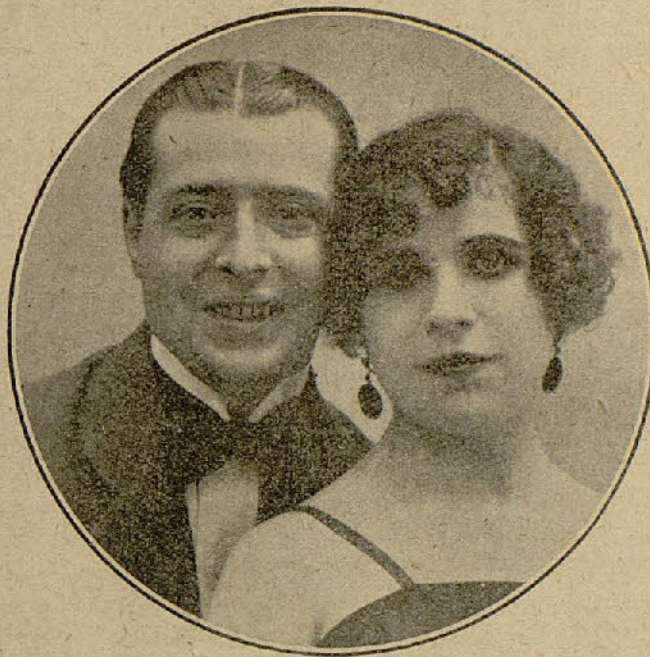
LOS RIERA - PELLICER

Una nota un poco dolorosa dentro del arte nos la ha dado la eximia actriz Rosario Pino. Rosario Pino la nunca bien ponderada ha accedido a dar un bolo bajo pretexto de una nueva despedida en el teatro Goya. Claro está que una representación de Rosario Pino es siempre