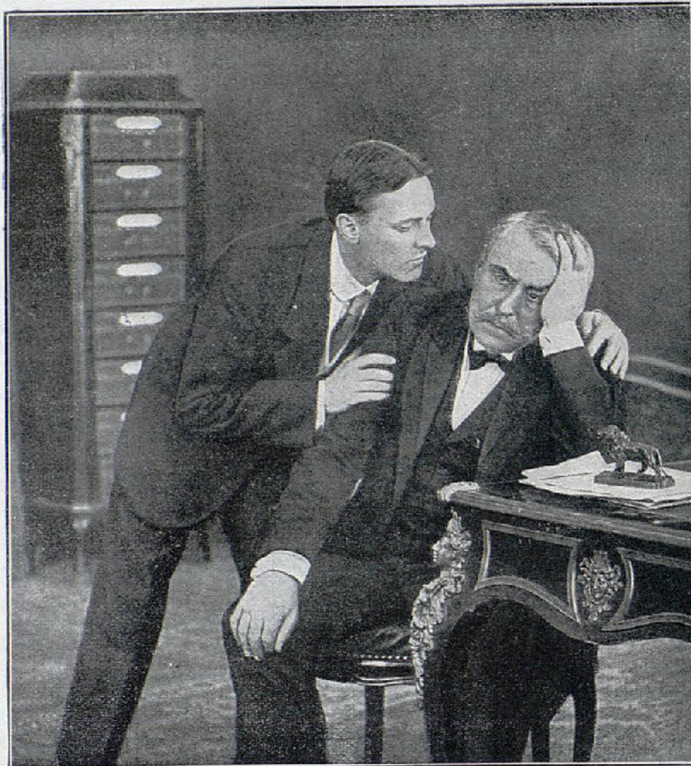
Una escena de la película Corazón de avaro

Enterados de donde se oculta la doncella, fingen una disputa con el sargento Rebollo y entran en la habitación batiéndose. En este