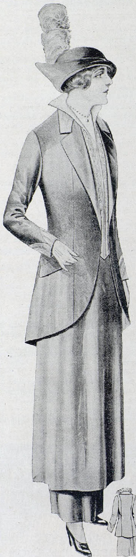
Tailleur muy liso. Falda ajustada; sobrefalda acampanada y chaqueta lisa completamente. Cuello de seda, y chaleco y sobrecuello de brillante

—No debes decir esto, que el mundo con sus pasiones y sus dolores está constituido por la individualidad. Lo que hagáis en bien de los que sufren, será un granito de arena, al que vendrán a reunirse otros granitos. Sé de muchas personas que se excusan diciendo: «¿qué puede hacer mi pequeñísimo óbolo?» Este socorro aliviaría por lo menos la miseria de «una madre»; y si todos los seres a quienes no falta lo necesario, se acordaran de ayudar a un pobre, habría quizá menos lágrimas y