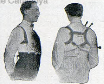
Con Benefactor El Benefactor de espalda

Riera San Juan, 8 - BARCELONA que mandará folleto gratis a quien lo pida