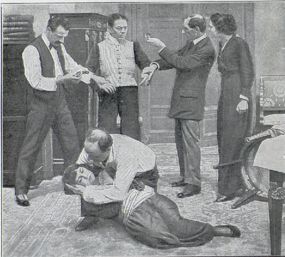
Una escena de la película Corazón de anaro