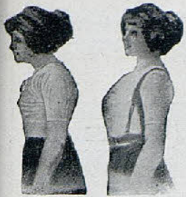
Sin Benefactor Con Benefactor