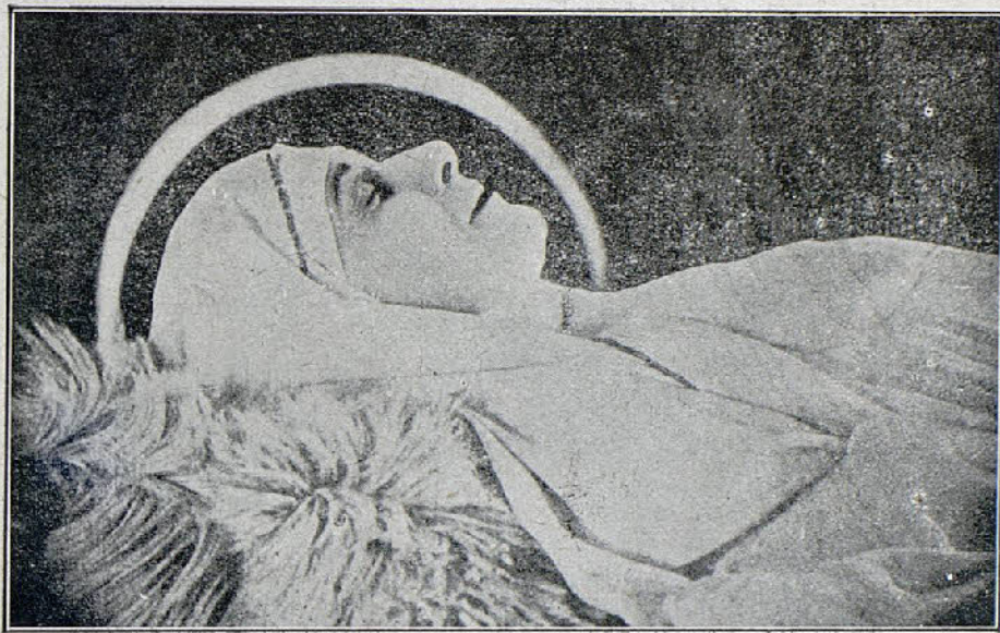
Una escena de la interesante película Thais

Mientras tanto, Dixon, para ganarse a Giest, que quería hacer por sí solo el negocio de la venta de las minas, colocó en la entrada del cuarto de Kennedy una marmita de hierro, que estallaría por percusión al abrirse la puerta; pero Dixon