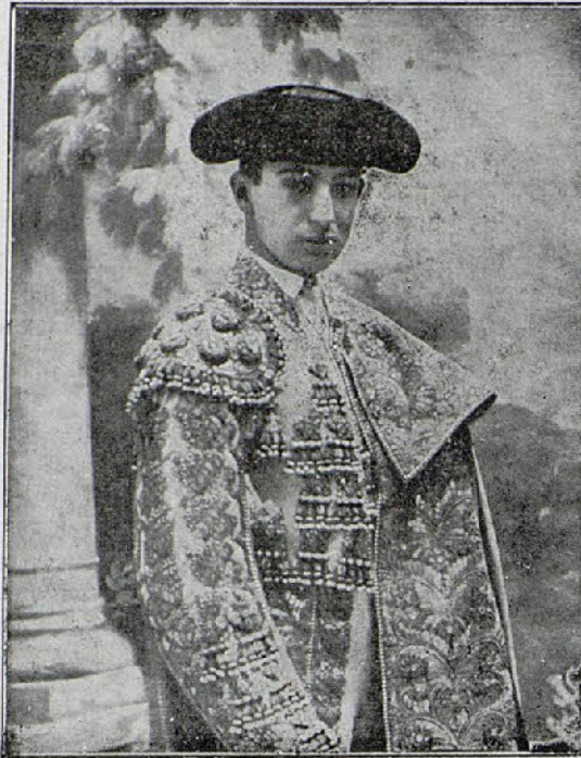
Joselito, figura cumbre del toreo, maestro de maestros, que ha llenado con Belmonte toda una época, muerto por un toro el domingo en Talavera de la Reina, a los veinticinco años de edad, en pleno apogeo, semidiós, triunfador de la Vida, millonario, en la cumbre de una carrera gloriosa y una senda florida, donde le acechaba la muerte. Su desaparición como encarnación de su época constituye una catástrofe en el toreo actual y la más sensacional y sangrienta efemérides de la Tauromaquia.

Qué cosa más absurda. Cómo nos negamos a creerlo. Cómo «forcejamos» para no con-