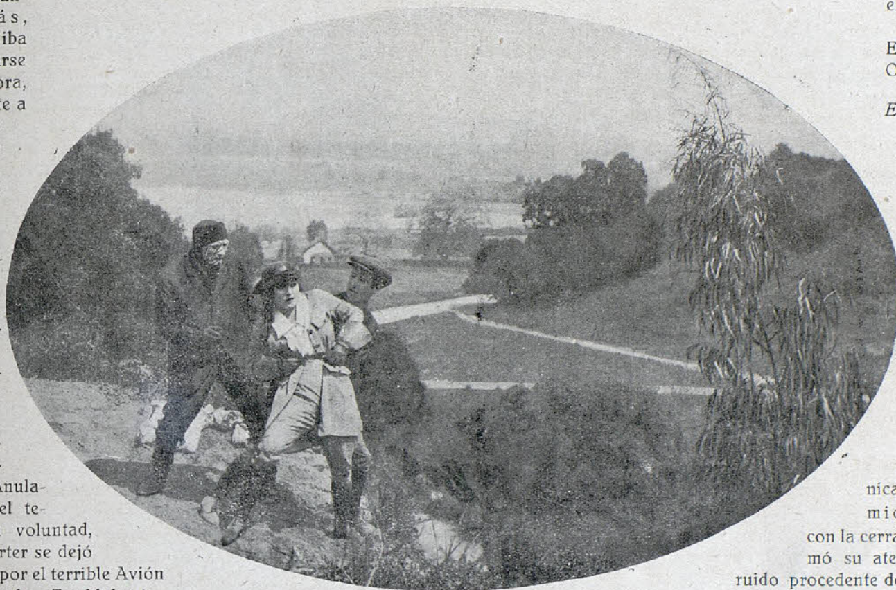
Una escena de la interesante película «La huella del tigre».

Apenas llegados a Dixonia, Kennedy dejó a Anita en el hotel al cuidado de Jameson, y se dirigió a la vivienda de Culpeper, en cuya presencia halló a Ema-