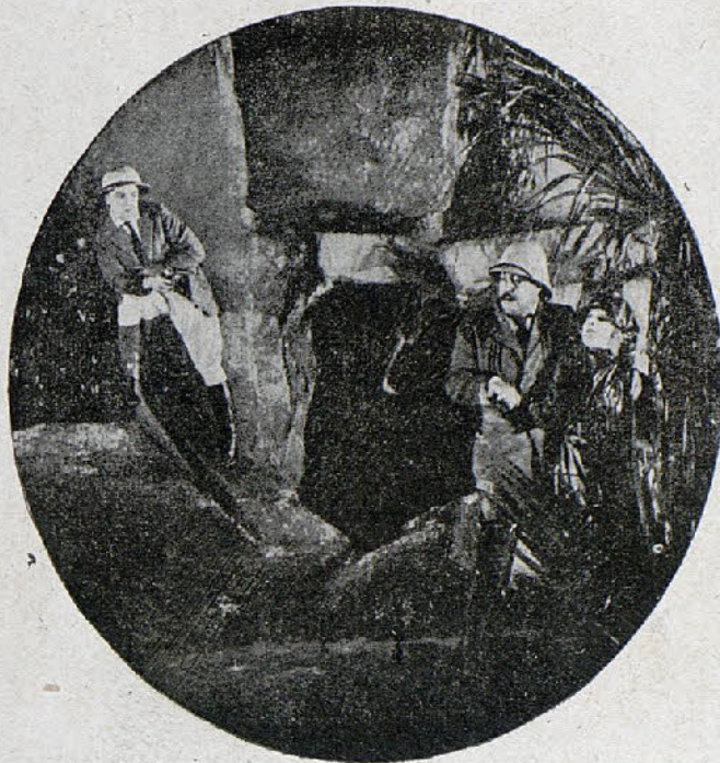
Una escena de la interesante pel6cula «Por amor»